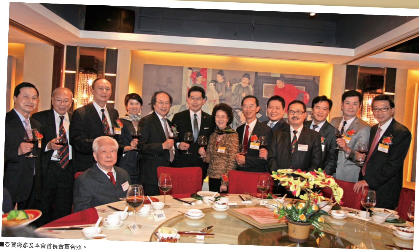
■ 受賀鄉彥及本會首長會董合照。