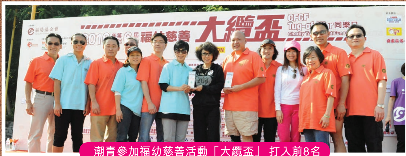
潮青參加福幼慈善活動「大纜盃」 打入前8名