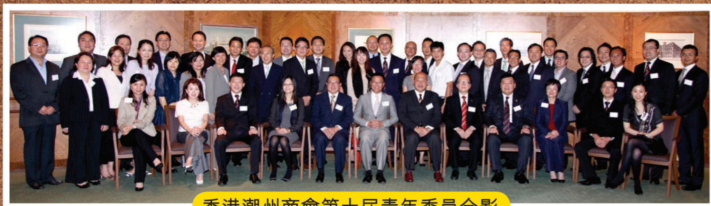
香港潮州商會第十屆青年委員合影