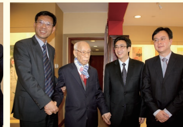
■ (左起) 廣東省副省長劉昆、饒宗頤教授、汕頭市市委書記李鋒、廣東省政府副秘書長兼港澳辦主任譚君鐵。