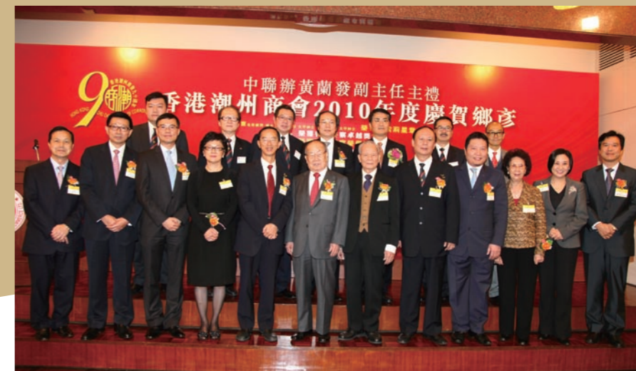
■ 本會正副會長與主禮嘉賓及受賀鄉彥合影。