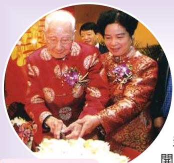
楊遵儀與夫人李曉珍切生日蛋糕。

楊遵儀，號宗一，廣東揭陽人，生於1908年10月7日，是中國科學院資深院士，我國古生物地層學教育的奠基人，新中國地層古生物事業的開創者之一。1980年當選為中國科學院院士(學部委員)。