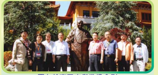
團友於南天寺與佛像合影