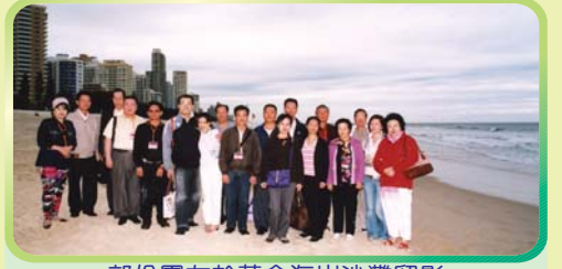
部份團友於黃金海岸沙灘留影