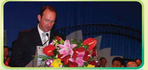
澳大利亞聯邦政府馬克·威爾副總理在開幕式上發表講話