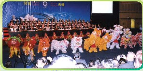
開幕典禮舞獅助慶