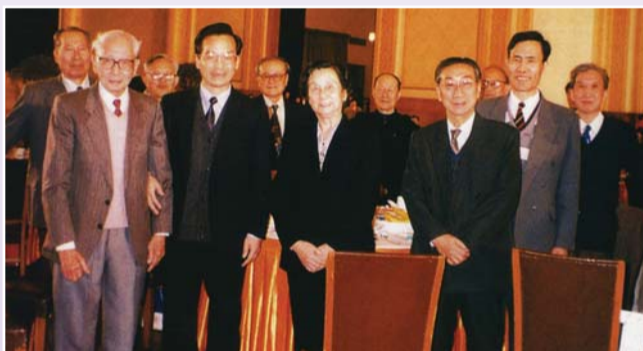
1994年在慶祝中國科學院建院45周年大會上，中央書記處書記溫家寶與地學部部分院士合影。

2007年10月7日，楊遵儀百歲華誕慶祝會在中國地質大學(北京)舉行，楊遵儀的弟子——中共中央政治局常委、國務院總理溫家寶親筆致信祝賀。溫家寶在信中高度評價楊老師為“傑出的地質學家和地質教育家，把一切都獻給了科學和教育事業。”溫家寶說：“四十七年前您是我的老師，今天仍是我的老師，我將永遠以您為榜樣，像先生那樣做人、做事、做學問。”“先生的長壽是與先生淡泊名利、樂觀豁達、謙虛謹慎、待人友善的品格分不開的。”落款是“學生溫家寶”。