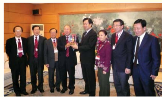
莊學山致送紀念品予夏德仁市長(右四)

張肖鷹部長向大連市領導簡介香港潮屬總會的情況，香港有一百多萬潮籍鄉親，其中有不少著名工商界人士及知名企業。他認為，國家振興東北工業基地的舉措，吸引了不少港商企業到東北尋找商機。港連兩地優勢互補，合作的發展空間很大。張成雄表示，他身兼香港中華總商會副會長，多次接待大連市及夏德仁市長，並協助大連在港招商。此次親身到大連考察，耳聞目睹，獲益良多，將有助於今後的工作。