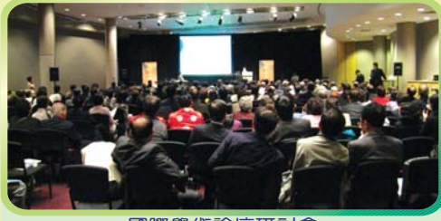
國際學術論壇研討會