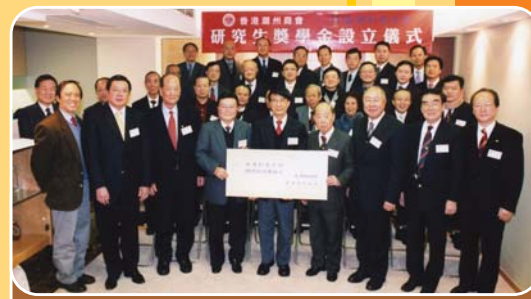
本會捐款四百五十萬元給香港科技大學設立研究生獎學金以以培育高尖端科技人材。圖為馬介璋會長(前排左四)將支票遞交香港科技大學校長朱經武(左五)的儀式上與各首長合照。