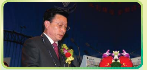
中國國務院僑辦馬渝備副主任在大會開幕儀式上致詞