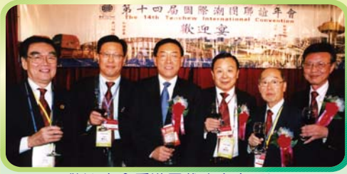
歡迎宴會香港團代表上台祝酒