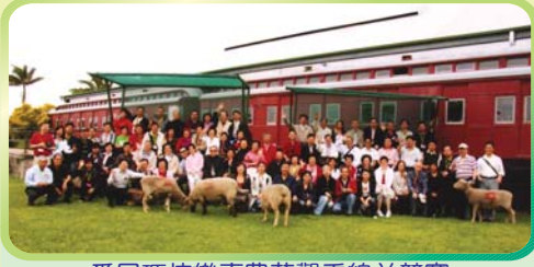
悉尼瑪拉樂嘉莊觀看綿羊競賽