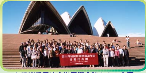
在澳洲悉尼達令港國際會議中心大合照