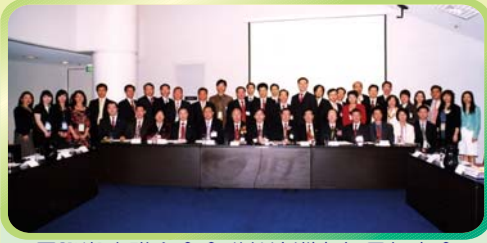
國際潮青聯合會會議於澳洲舉行周年大會