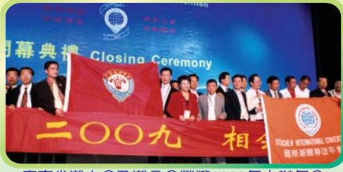
廣東省潮人會及潮商會榮獲2009年主辦年會