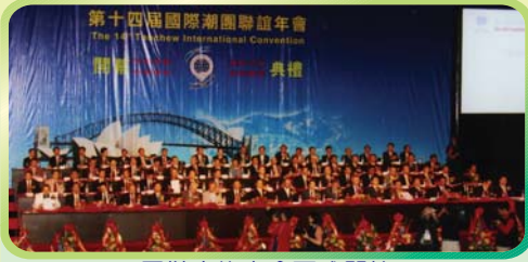
司儀宣佈大會正式開始