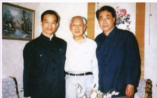
1986年，溫家寶到楊家看望楊遵儀院士。

1952年全國高校院系調整，楊遵儀參與創建了北京地質學院(中國地質大學前身)。先後擔任地質學院的