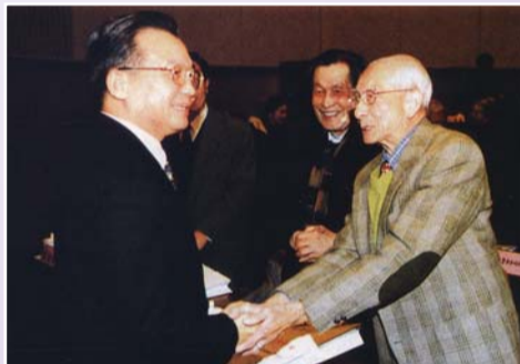
2001年12月，在第七次李四光地質科學獎大會上，溫家寶副總理與楊遵儀院士親切握手。