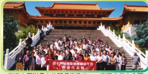
在南太平洋最大的著名佛教寺——南天寺前大合照