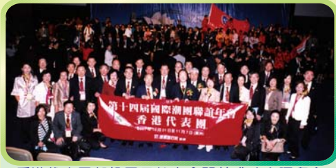
香港代表團部份團員於大會開幕禮時合照留念