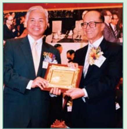
楊釗(左)代表主辦機構向主禮嘉賓李嘉誠博士致送紀念品

展覽得到社會各界的重視和支持，籌備委員會成員涵蓋香港政經界、文化教育界、香港各大社團和知名人士。展覽期間，還舉辦講座及座談會。「功在家國 垂範香江——莊世平光輝事蹟展」七月三日起，在廣州、澳門等地巡迴展出。