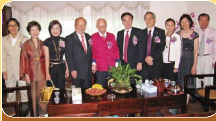
東莞長安饒宗頤書畫展於七月九日在東莞市長安鎮舉行開幕禮，饒宗頤教授、陳偉南永遠名譽會長和許學之副會長等出席。