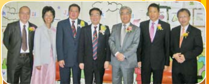
本會所屬潮商學校於七月四日舉行第77屆畢業禮，本會會長會董與校長、嘉賓合影。