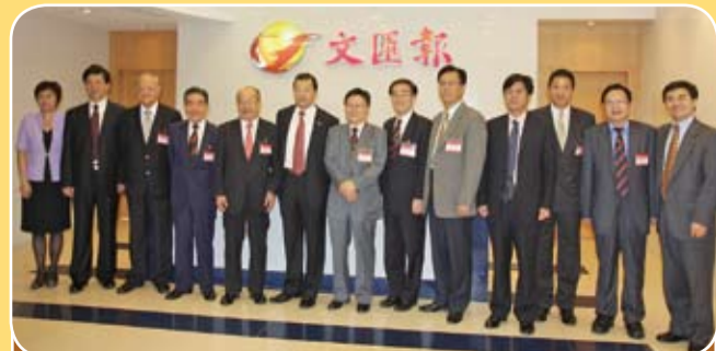
香港潮屬社團總會和香港潮州商會首長拜訪文匯報，與該報高層合照。