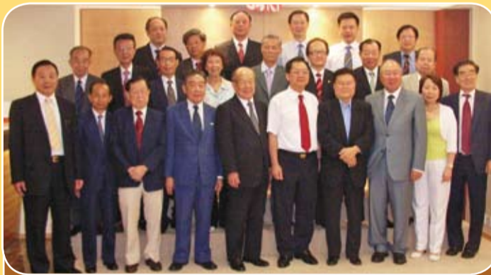
潮州市委書記駱文智於七月二十四日在香港會見多家潮屬社團首長