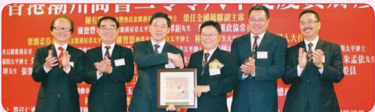
正副會長向主禮嘉賓林瑞麟局長(左三)致送紀念品