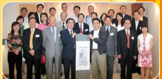
香港中華總商會舉辦的「第150期工商業研討班」全體學員蒞會訪問。