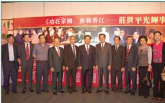
中聯辦彭清華副主任(中)參觀莊世平事蹟展，右五為揭陽市陳奕威市長