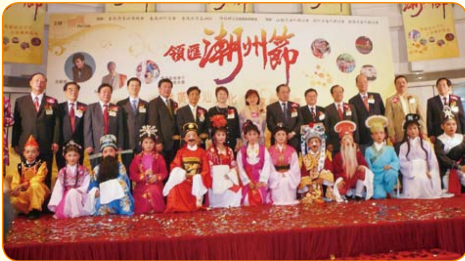
出席「領匯潮州節」開幕禮的嘉賓與小演員合照。

「領匯潮州節」閉幕禮於6月29日在藍田啓田商場舉行，由多位主禮嘉賓主持簡單而隆重的儀式，以拼圖寓意活動順利圓滿舉行，祝願潮州文化繼續發揚光大。同場更有潮商互助社音樂部作壓軸表演，演繹多首經典潮曲，配合傳統中樂及大鑼鼓表演，讓「領匯潮州節」在一片熱鬧的歡呼聲和音樂聲中結束。