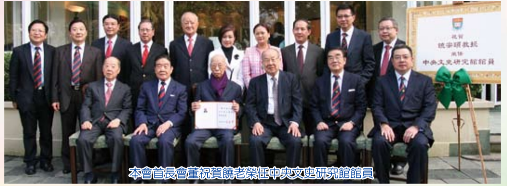
本會首長會董祝賀饒老榮任中央文史研究館館員