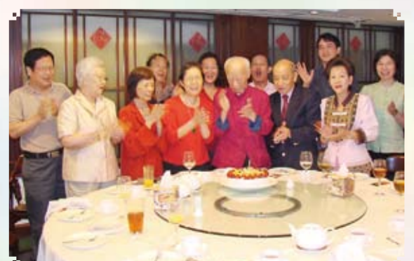
親友賀饒公九二榮壽