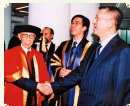
和澳門行政長官何厚錕