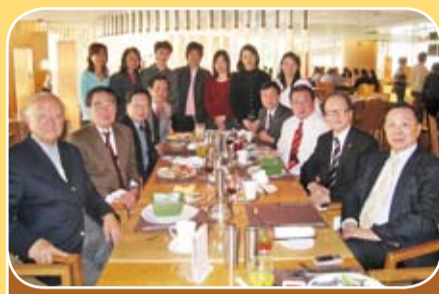
本會首長與秘書處職員共晉午餐迎新