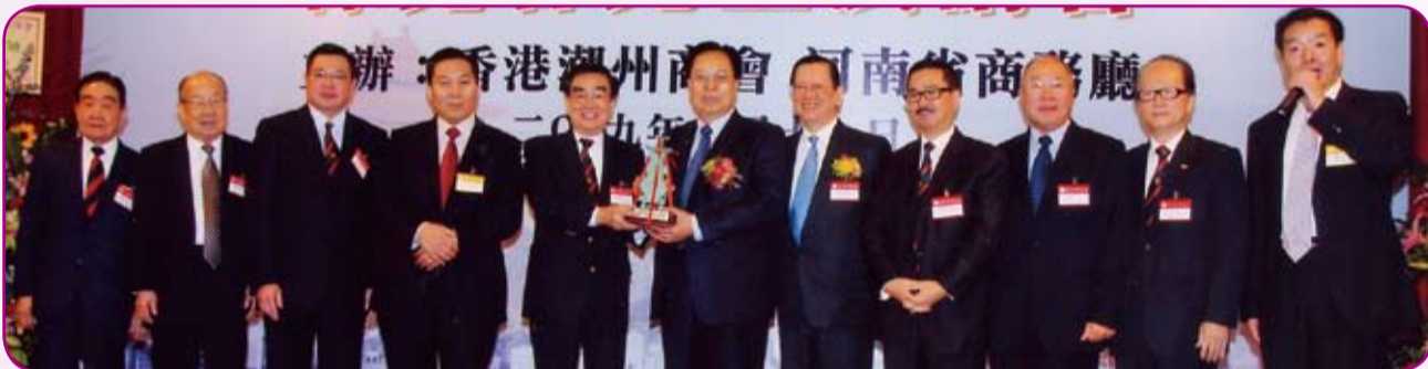
河南省人民政府向本會致送紀念品。