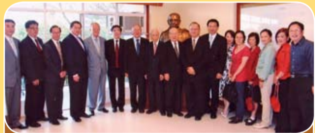
莊學山昆仲三人捐助之饒宗頤教授銅像豎立於港大饒宗頤學術館，揭幕禮上，本會多位首長出席。