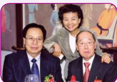
梁劉柔芬議員(中)和徐光春(左)、蔡衍濤(右)