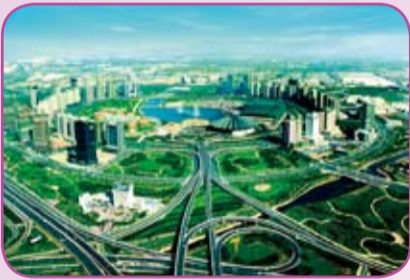
河南省鄭州市的「鄭東新城」

當前由美國次貸危機引發的國際金融危機，使全球經濟陷入了上世紀大蕭條以來最困難的境地。這場危機對香港和河南都造成了不同程度的衝擊。危機、危機，危中有“機”，危後也有“機”。就河南而言，危機並沒有改變我們所處的發展階段、所處的發展機遇期，沒有改變經濟發展的基本態勢和支撐發展的基本條件。與此同時，危機帶來的經濟格局變化與中原崛起、加快發展的時機相吻合，產業佈局重新“洗牌”與河南正在實施的結構轉型和產業升級戰略相一致，擴大內需舉措與河南巨大的消費市場相呼應。在金融危機背景下，河南經濟社會發展不僅有調整的空間、迴旋的餘地，也蘊含著巨大的商機。我們願意與貴商會以及香港各界精英一起，在應對危機中尋找機遇，在深化合作中抓住商機。目前的主要商機可以概括為以下八個方面：