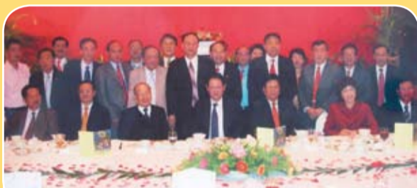
汕頭市海外聯誼會第五屆大會，本會多位首長出席。