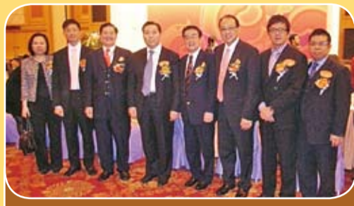
河南海外聯誼會新春酒會