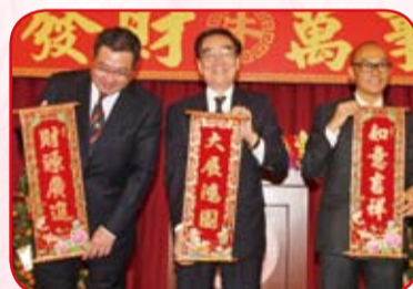
正副會長向來賓拜年