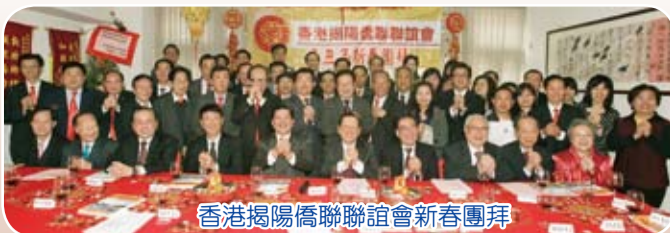
香港揭陽僑聯聯誼會新春團拜