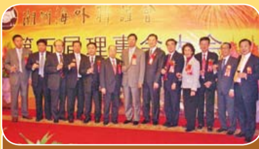
本會多位首長會董出席潮州海外聯誼會第五屆理事會