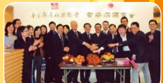
本會會所秘書處裝修完工