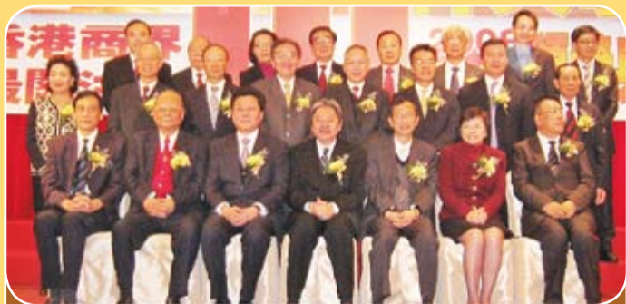
本會參與舉辦香港商界最關注十件大事評選活動