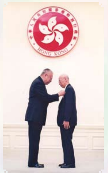
2000年獲行政長官董建華頒授大紫荊勳章