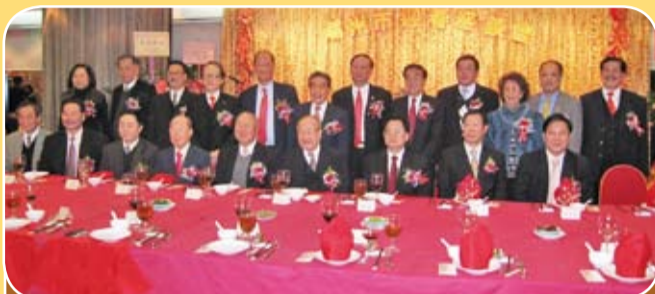
本會及本港潮屬社團首長出席潮州市迎春座談會