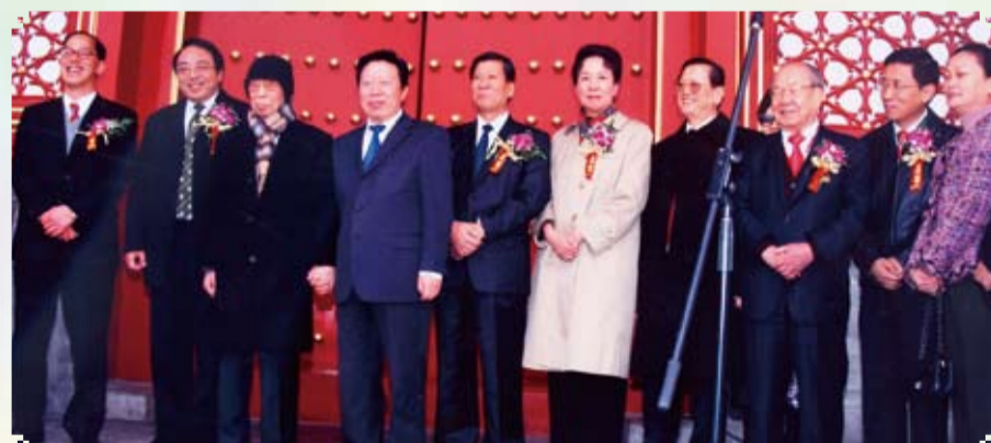
2008年，於北京故宮舉行學術藝術展。全國政協孫家正副主席(左四)主禮。