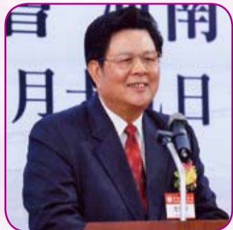
中聯辦周俊明副主任致辭