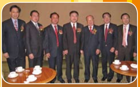
出席雲浮市新春酒會