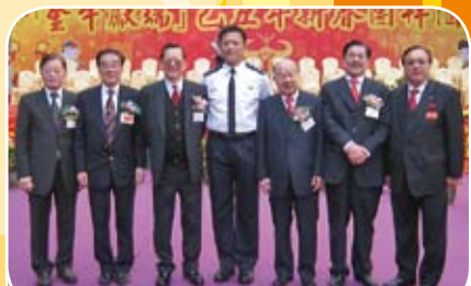
本會多位成員出席西區警區新春團拜