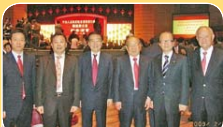
出席中聯辦新春酒會