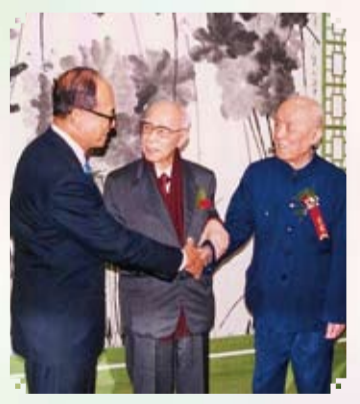
傑出華人：李嘉誠、饒宗頤、季羨林