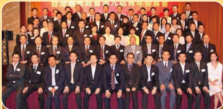
本會首長和第九屆青年委員會成員合影