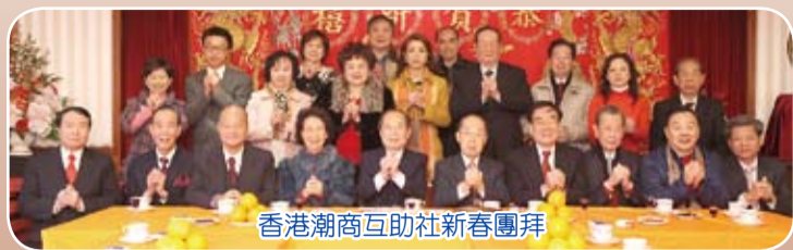
香港潮商互助社新春團拜