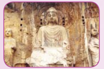
世界文化遺產——龍門石窟

第七，實施旅遊立省戰略，為開發旅遊產品、形成永續發展產業提供了新商機。河南是旅遊資源大省，“古、山、河、花、拳、根”樣樣俱全。從人祖伏羲太昊陵、軒轅黃帝故里到“萬姓同根、萬宗同源”的華人祖地；從世界文化遺產龍門石窟、安陽殷墟到名揚天下的少林寺、白馬寺、大相國寺；從世界地質公園嵩山、雲臺山、伏牛山到世界生物圈保護區寶天曼等等，河南猶如一座浩瀚如煙的歷史長廊，一幅風光旖旎的天然畫卷。目前，河南旅遊業正處於一個轉型增效的關鍵階段，面臨著深度開發與質量提升的雙重機遇，我們明確提出了“旅遊立省”戰略，把旅遊產業的發展放在更加優先的位置來考慮，作為經濟社會發展的重要支柱來培育。在這次活動中，河南旅遊代表團在港初步推出了49個旅遊項目，這些項目都是具有很強開發潛力的專案，也是充滿商機的專案。同時也希望香港各界人士、海內外潮商到中原大地走一走、看一看，親身領略中原豐富的人文景觀、優美的自然山水，尋覓更加廣泛的合作機會，共同開發文化游、山水游、休閒遊，共同打造中原旅遊盛筵。