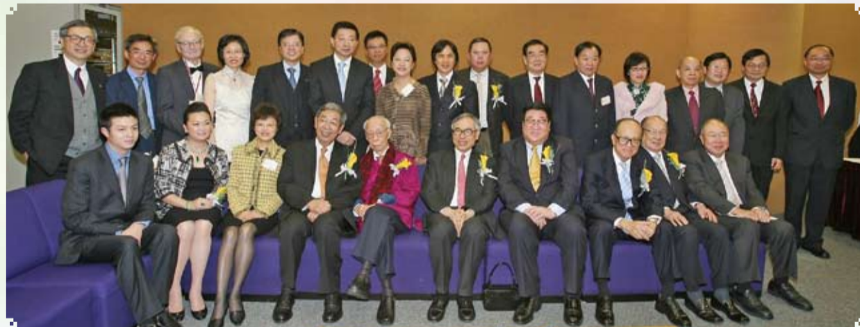
2007年，全國人大許嘉璐副委員長（前左四）專程蒞港祝賀饒公九十榮壽