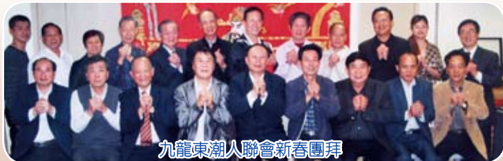
九龍東潮人聯會新春團拜