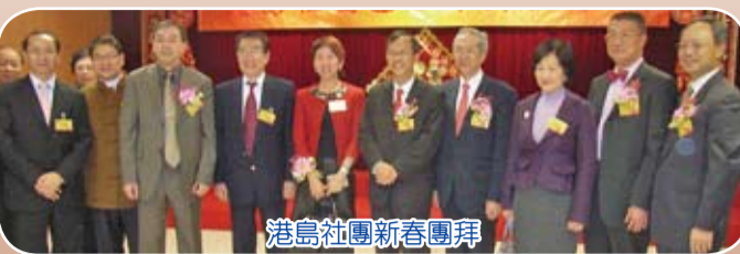
港島社團新春團拜