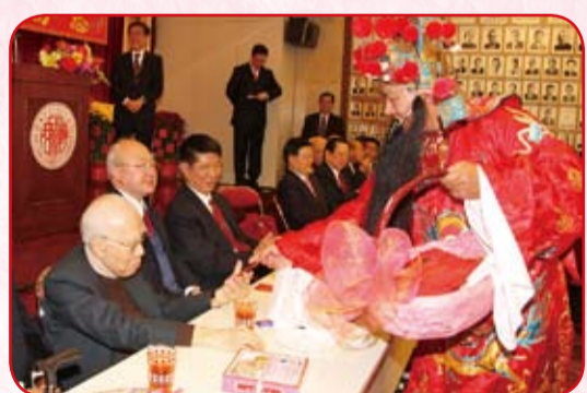
財神向來賓派利是