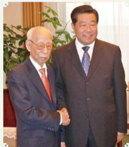
全國政協賈慶林主席接見饒公

饒教授於中國文化而言，乃一百科全書式的學者，更是一位非常傑出的文學家和藝術家，擅長各體舊體詩詞、辭賦、古文，乃至書法和繪畫。曾刊行詩文作品集二十餘種、書畫集十餘種。去年六月，饒公揮就「大愛無疆」四字，籌得五百萬善款捐助四川災民。