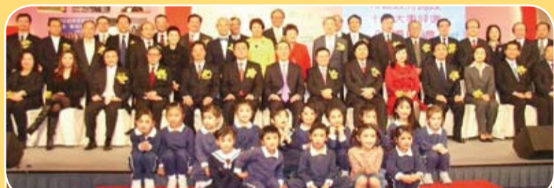
馬介璋博士獨家贊助本會參與合辦特區政府施政十件大事評選活動