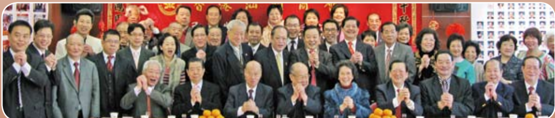
香港汕頭商會舉行己丑牛年新春團拜