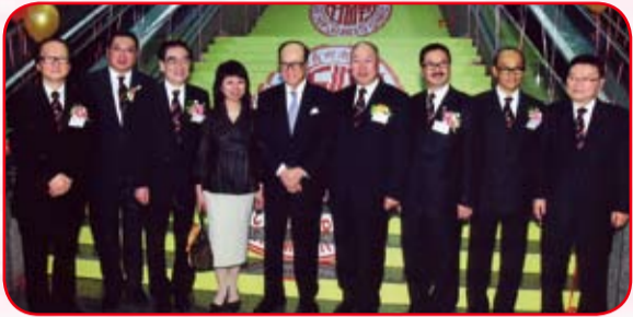
迎接李嘉誠博士(中)