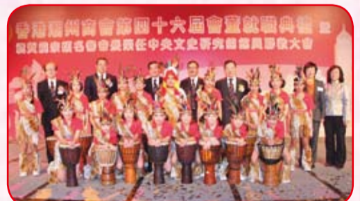
香港潮商學校表演「非洲鼓」