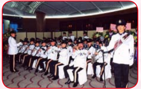
警察樂隊表演迎賓樂曲