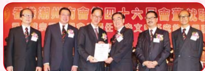
致送感謝狀予主禮嘉賓曾德成局長