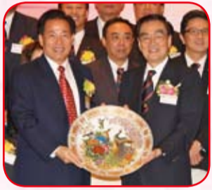
廣東省政協蔡東士副主席 致送紀念品