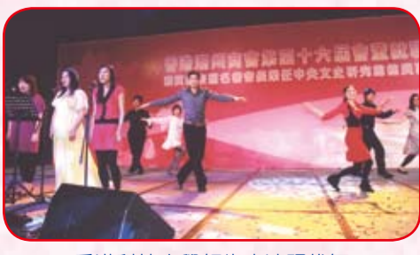
香港科技大學師生表演現代舞