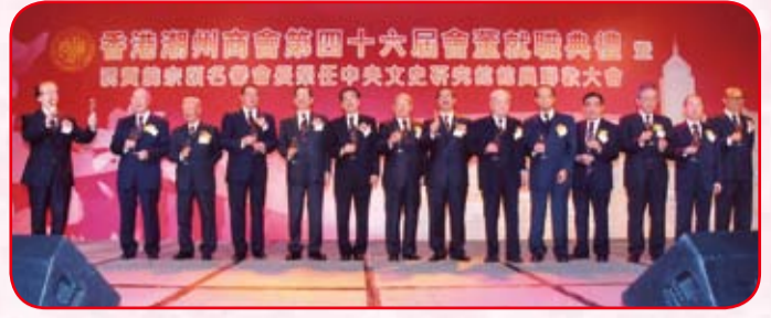
本會首長向來賓祝酒