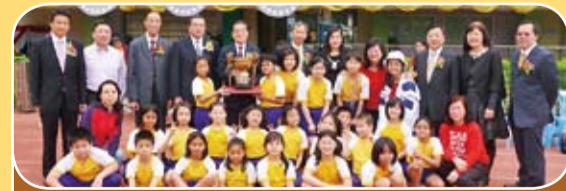
香港潮商學校在灣仔運動場舉行田徑運動會頒獎典禮