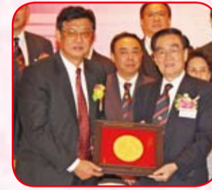
揭陽市政協主席歐漢波 致送紀念品