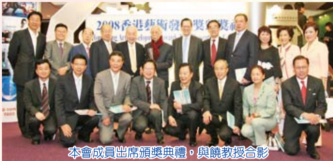
本會成員出席頒獎典禮，與饒教授合影