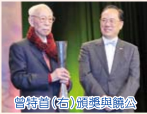
曾特首(右)頒獎與饒公

饒教授非常高興能獲此殊榮，並寄語後輩，認為從事藝術的人必須具備一種「熱力」，亦即是印度人所說的「Tapas」，不怕艱苦，不斷追求創新。