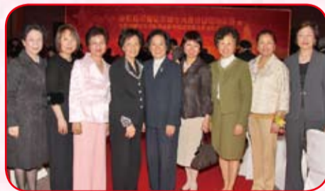
本會首長夫人和女會董