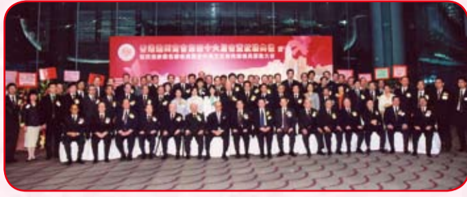
全體會董、青委與李嘉誠博士合照