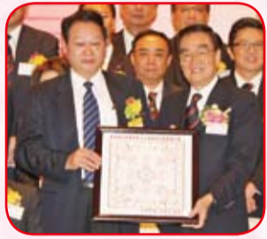
汕頭市委書記黃志光 致送紀念品