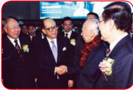
李嘉誠博士與饒宗頤教授相見甚歡