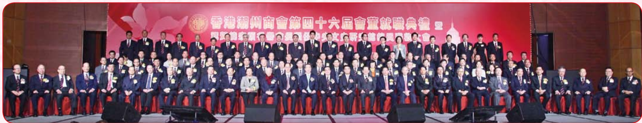
嘉賓與本會會董大合照

本會第四十六屆會董就職典禮暨祝賀饒宗頤名譽會長榮任中央文史研究館館員聯歡大會，於三月二十五日下午七時正，假座香港會議展覽中心舊翼二樓宴會廳舉行。筵開近百席，場面盛大。特區政府政務司司長唐英年、中聯辦副主任黃蘭發、民政事務局長曾德成、全國僑聯副主席陳有慶為主禮嘉賓。中聯辦周俊明副主任、長實集團主席李嘉誠博士蒞會致賀。行政長官曾蔭權、中聯辦主任高祀仁、政務司司長唐英年、財政司司長曾俊華、律政司司長黃仁龍、民政事務局長曾德成、長實集團主席李嘉誠、全國僑聯副主席陳有慶、香港潮屬社團總會創會主席陳偉南和主席馬介璋等題辭祝賀。逾千嘉賓歡聚一堂，喜氣洋洋。