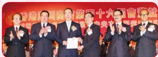
許會長與四位副會長致送感謝狀予主禮嘉賓唐英年司長