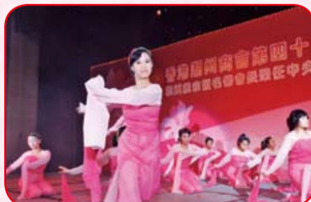
潮州會館中學群舞