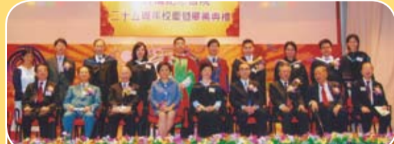
廖寶珊書院舉行第二十五周年校慶暨畢業典禮