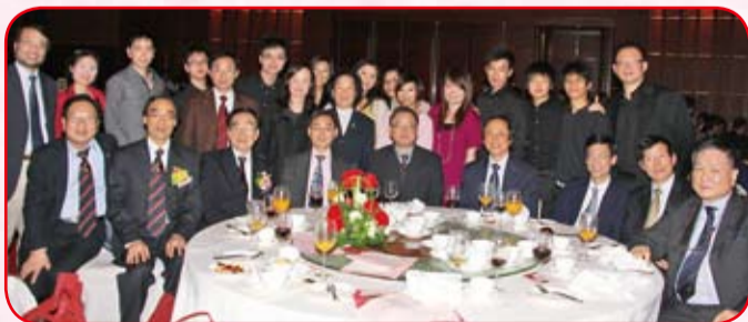
許學之會長與香港科技大學嘉賓合照