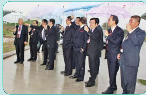
本會首長及會董考察構思中的潮商產業園區