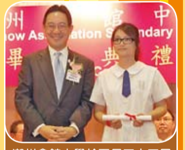
潮州會館中學於五月二十二日在該校禮堂舉行第二十一屆畢業典禮，主禮嘉賓教育局陳維安副局長頒發予學生