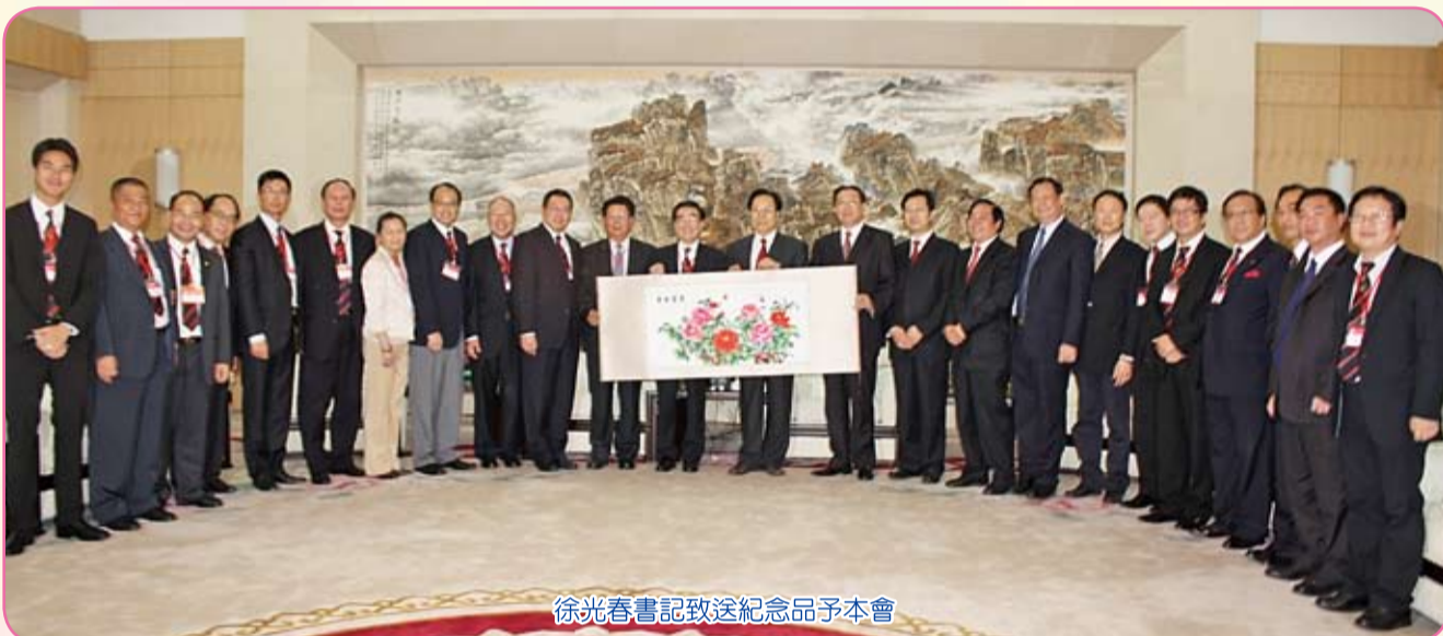
徐光春書記致送紀念品予本會

日前由中聯辦副主任周俊明、會長許學之率香港潮州商會數十位各行各業的精英企業家訪問河南，獲該省領導高規格禮遇，河南省委書記徐光春、省長郭庚茂分別親切會見考察團全體成員，歡迎眾「潮人」走進河南、投資河南、創業河南。期間，香港潮州商會與河南省商務廳高效地簽訂了戰略合作框架協議。