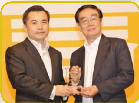
本會獲保安局禁毒處與禁毒常務委員會頒授推廣禁毒訊息卓越獎，黃仁龍律政司長(左)頒獎予許學之會長