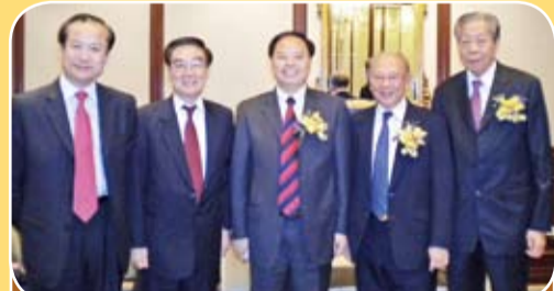
許學之會長(左二)出席長沙(香港)投資貿易洽談會與張劍飛市長(中)等合影