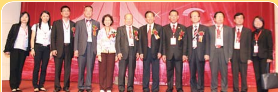
本會及香港潮屬社團首長出席東莞市潮商民營企業協會會慶活動