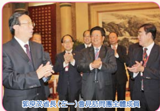
郭庚茂省長(左一)會見訪問團全體成員