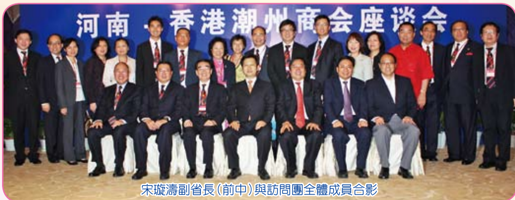
宋璇濤副省長(前中)與訪問團全體成員合影