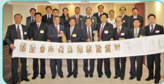
河南省商務廳宋國剛副廳長（右四）及開封市郭軻副市長（左四）一行八人於6月22日蒞會訪問，與本會「開封潮商產業園」工作小組成員就有關事項之進展進行探討。