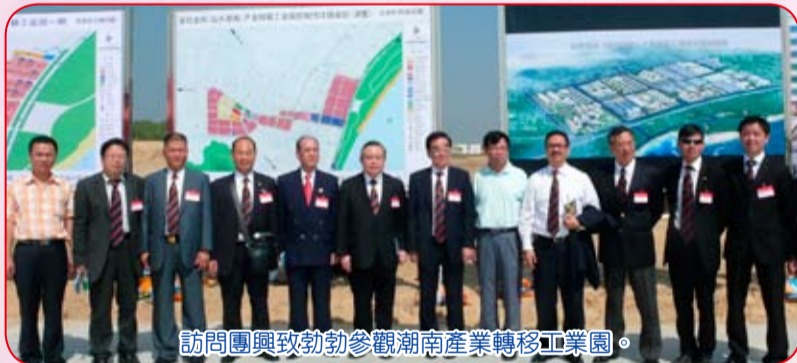
訪問團與致勃勃參觀潮南產業轉移工業園。