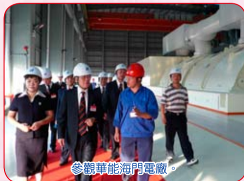
參觀華能海門電廠。