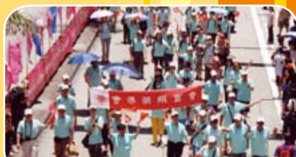
本會組隊參加「慶祝香港回歸祖國十二周年大巡遊」