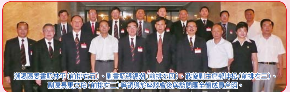
潮陽區委書記林平（前排右五）、副書記張錫潮（前排左四）、政協副主席郭坤松（前排右三）、副區長馬文玲（前排右二）等領導於座談後與訪問團全體成員合照。