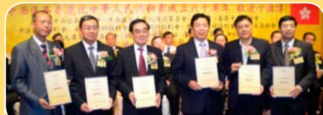
「耆英千歲宴敬老活動」於十月六日在金鐘名都酒樓舉行，本會合辦並贊助活動經費