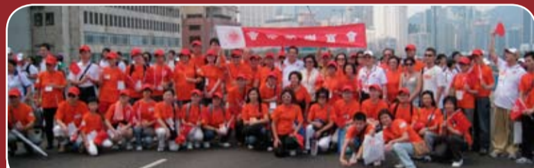
於東區走廊行車天橋上。