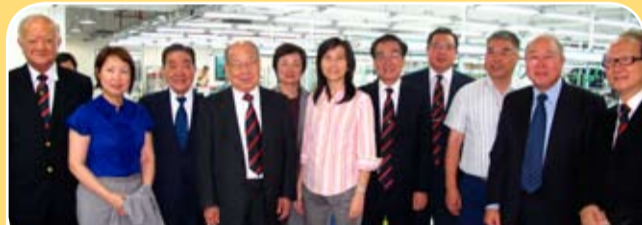
參觀莊學山永遠名譽會長(右二)的社會企業綿德服裝公司