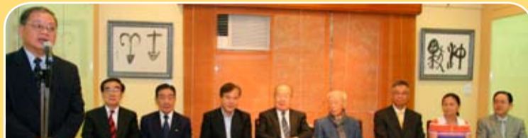
饒宗頤學術館舉辦「翰墨怡情」饒宗頤教授書法展，本會多位首長出席。