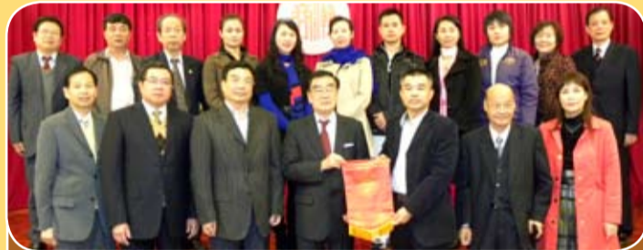
廣東潮劇院二團之領導及主要演員一行十二人於十二月十六日上午蒞會訪問。