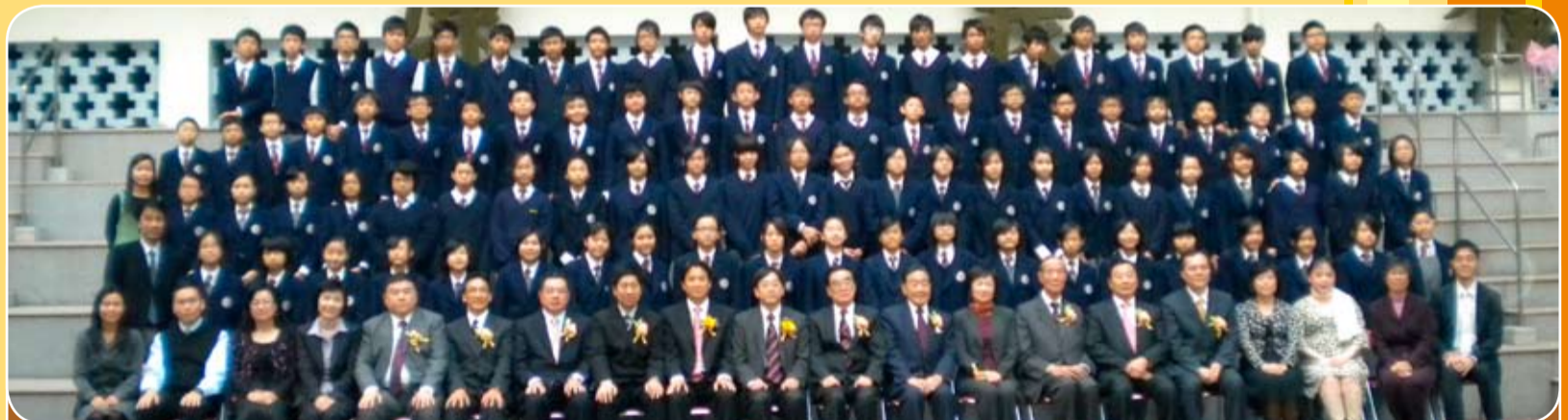
本會所屬潮商學校舉行「第七十八屆畢業典禮」，高永文醫生主禮，本會多位會長會董出席，並與畢業班師生合影。