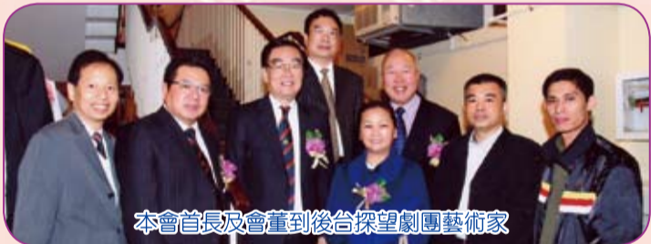
本會首長及會董到後台探望劇團藝術家

今年正值中華人民共和國成立六十周年，在這一年的中，上述三家主辦機構舉辦了各種的慶祝活動，今次的潮劇欣賞會更是今年的壓軸活動，可稱是官、商、民三方合作成果的典範。潮劇源自潮汕地區，文化根源深遠，藝術造詣甚高，唱腔優美獨特，故事過惡揚善。主辦機構希望透過舉辦「潮劇欣賞會」，使全港市民在欣賞潮劇之餘，更能倍增鄉誼、和睦相處，共同歡慶歷史性的日子。