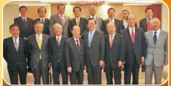
香港潮州會館舉行2009年度周年大會後合影。