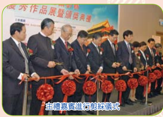
主禮嘉賓進行剪綵儀式