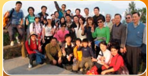
本會青委於十二月五日舉行南丫島行山海鮮宴半日遊活動。