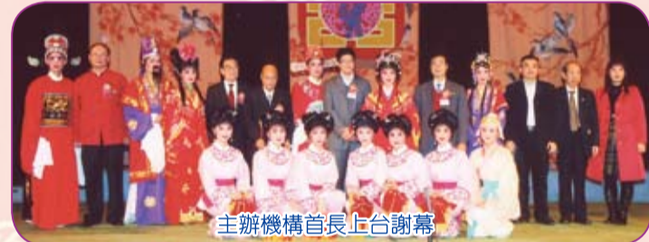
主辦機構首長上台謝幕

曾德成致辭時指出，民政事務處一直致力推廣香港文化藝術，未來亦會努力發展不同的藝術節目，拓展觀眾層面，讓香港成為多元文化活動的大都會。他說，今年9月已向有關部門