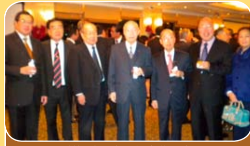
亞洲保險五十周年慶典酒會，本會多位首長出席敬賀。