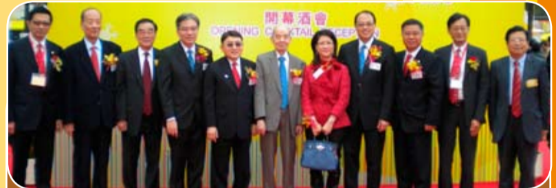
本會會長及會董出席第44屆香港工展會開幕式，與香港中華廠商會會長合影。