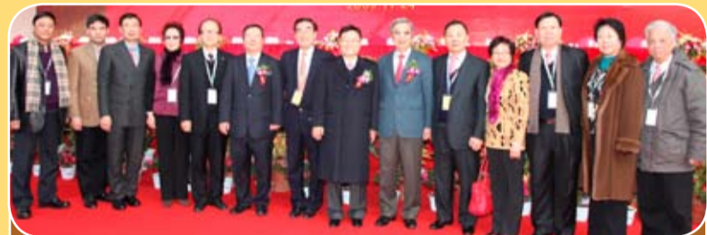
華東城董事局於十一月二十三日至二十五日在江蘇省連雲港舉行「華東城奠基動工典禮」，本會多位首長會董應邀出席。