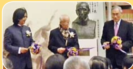
饒宗頤教授塑像揭幕儀式於十一月十二日在香港中文大學舉行，劉遵義校長(右)、饒宗頤教授(中)、雕塑家吳為山教授一同主禮。