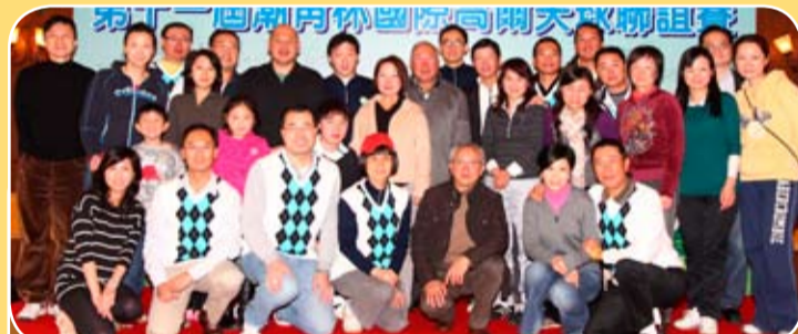
本會青委組隊參加第十一屆潮青杯高爾夫球聯誼賽。