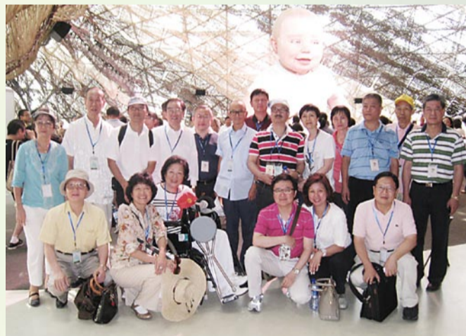
參觀世博西班牙館