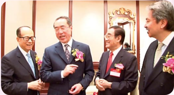
左起：李嘉誠、唐英年、許學之、曾俊華