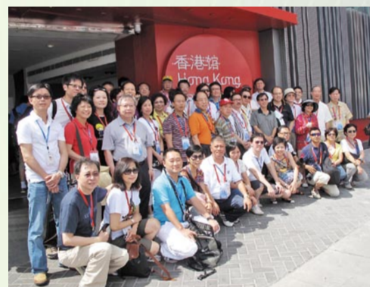
參觀世博會香港館