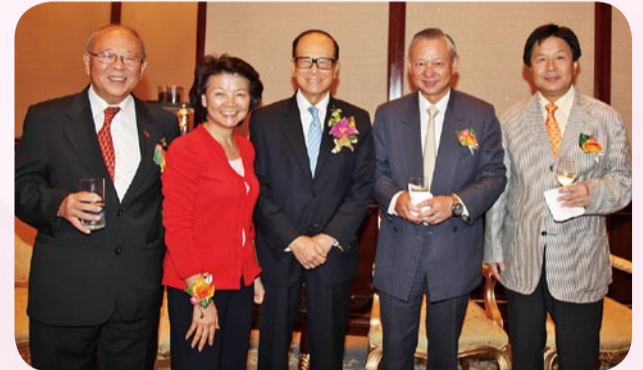
左起：藍鴻震、梁劉柔芬、李嘉誠、李少光、蔡志明