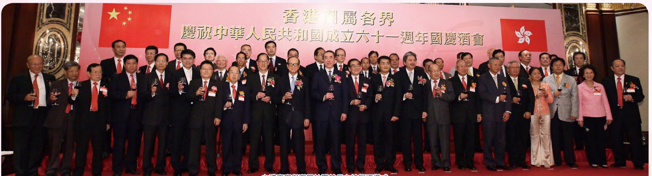
主禮嘉賓與潮屬社團首長主持祝酒儀式