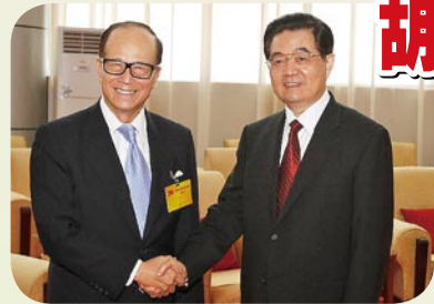
胡錦濤日前在深圳特區成立30周年之際高規格會見李嘉誠博士，讚賞其對香港和特區建設的支持。

白：只要努力，每個香港人都可能成為一個成功的富商。我們鼓勵讚賞每個香港人的進取精神，同時亦會祝福他們的成功。我們習慣香港高度的自由，但我們千萬不要走歪路，不能嫉妒別人的成就，我們應有反省和上進精神。