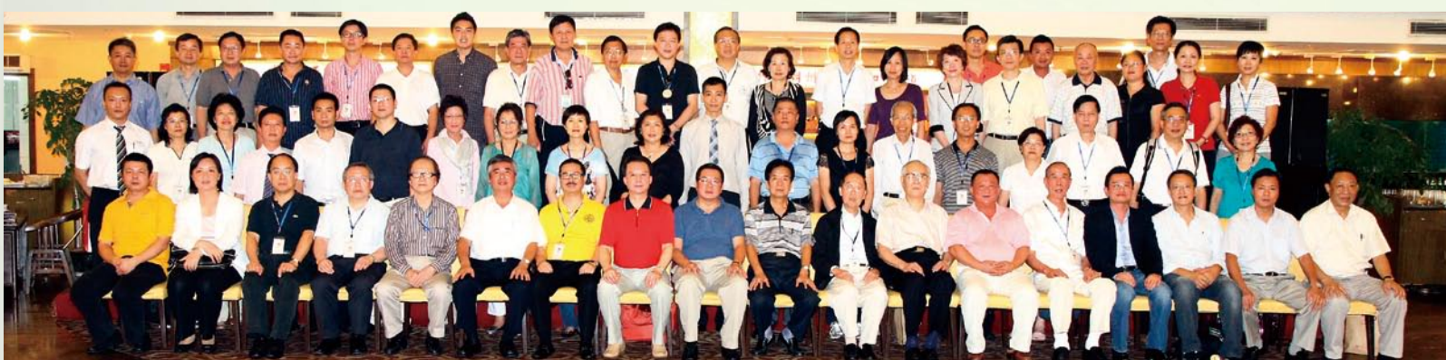
與上海潮籍企業家合影