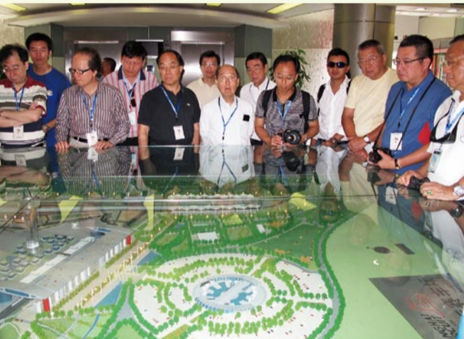
參觀上海國際賽車場