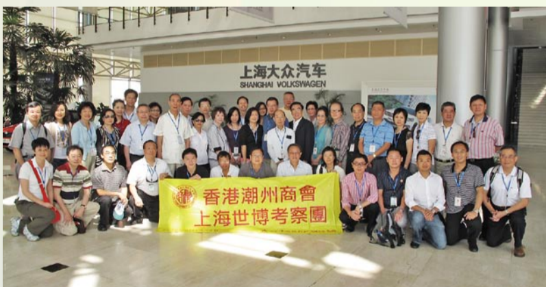
參觀上海大眾汽車廠