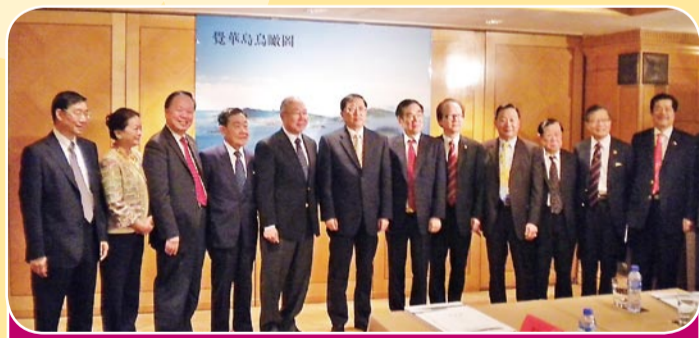
本會首長會董出席遼寧胡蘆島市招商活動和陳政高省長(左六)合照