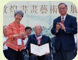
贈送書法頒發收藏證書

由中央文史研究館、敦煌研究院、香港大學饒宗頤學術館主辦，香港潮屬社團總會、香港潮州商會等協辦的“莫高窟餘韻——饒宗頤敦煌書畫藝術特展暨九五華誕壽宴”，8月8日晚上在世界文化遺產莫高窟腳下的敦煌研究院開幕。