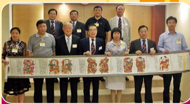
開封市代表團一行於7月27日蒞臨本會訪問，雙方就推動兩地的經濟文化交流與合作交換意見。