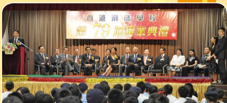
香港潮商學校第79屆畢業典禮