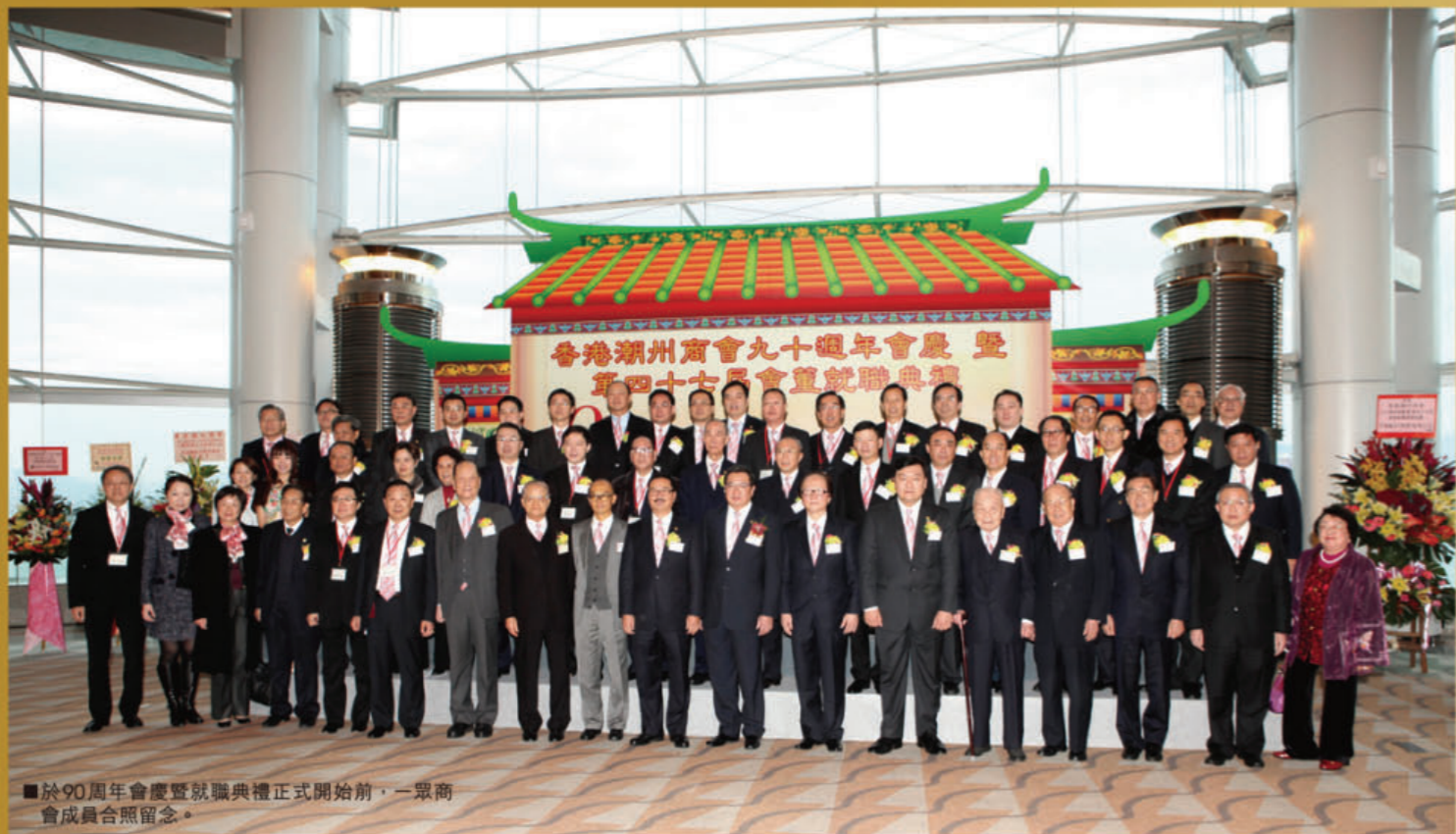
■於90周年會慶暨就職典禮正式開始前，一眾商會成員合照留念。