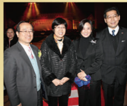
■商務及經濟發展局副局長蘇錦樑（右一）與前立法會議員蔡素玉（左二）及現任立法會議員陳鑑林（左一）亦是典禮的座上貴賓。