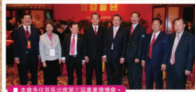
■ 本會多位首長出席第三屆粵東僑博會。