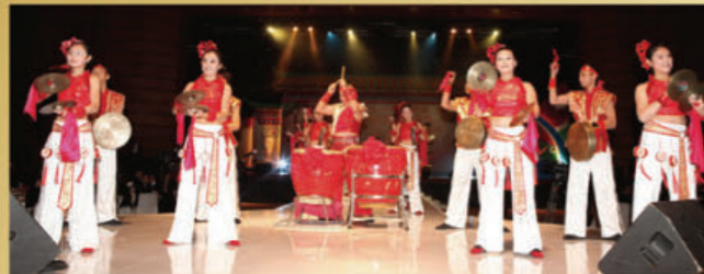
汕頭文化藝術學校表演潮州大鑼鼓。