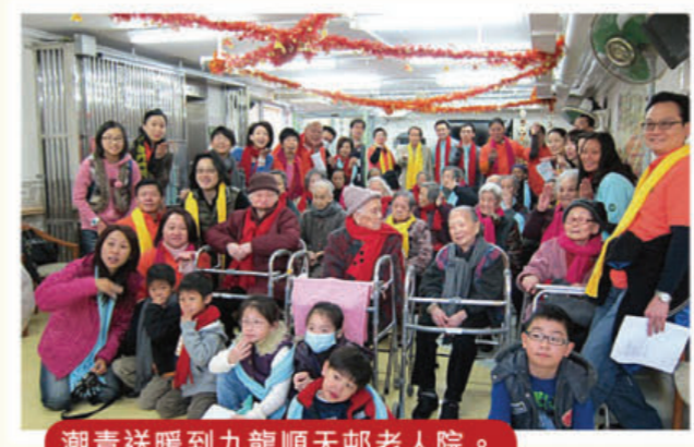
潮青送暖到九龍順天邨老人院。