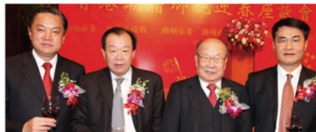
（左起）陳奕威、謝賢團、陳偉南及中聯辦副主任黃蘭發。

迎春座談會由潮州市委常委、常務副市長謝烈鵬主持。蔡宗澤與駱文智在會上分別介紹各市社會經濟發展。出席的三市領導尚包括汕頭市人大副主任王芸、政協副主席張澤華；潮州市政協主席田映生、市委副書記黃俊潮、市政協副主席沈啟綿、揭陽市委副書記、市長陳奕威、揭陽市政協主席歐漢波、政協副主席胡錫輝，出席嘉賓包括中聯辦副主任黃蘭發、外交部駐港副特派員李元明，中聯辦社聯部部長郭鐵生、港島工作部部長吳仰偉，特區政府政制及內地事務局常任秘書長羅智光；出席的政商界人士、首長、僑領包括戴德豐、余國春、陳鑑林、許學之、陳幼南等。