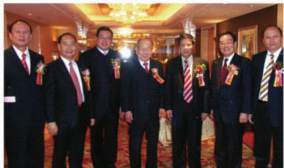
■ 本會多位首長出席汕尾市春茗活動。(左起)吳哲欽、陳強、陳幼南、陳偉南、汕尾市書記戎鐘文、許學之及汕尾市市長鄭雁雄。