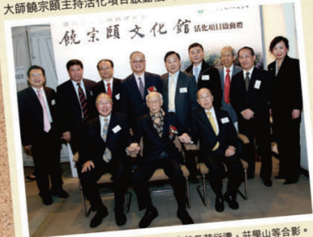
■ 國學大師饒宗頤與出席儀式之本會首長蔡衍濤、莊學山等合影。

建成逾世紀的舊荔枝角醫院即將活化成「饒宗頤文化館」，早前由行政長官曾蔭權、發展局局長林鄭月娥及國學大師饒宗頤主持活化項目啟動儀式。