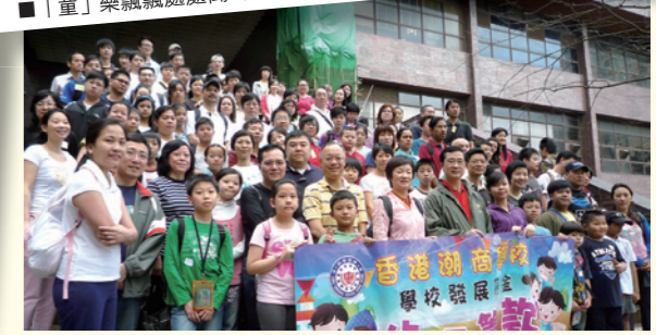
■ 香港潮商學校「學校發展基金」步行籌款。