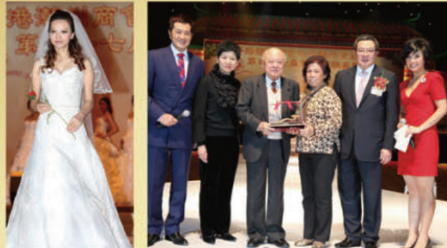
廣東金潮集團婚紗晚裝匯演。