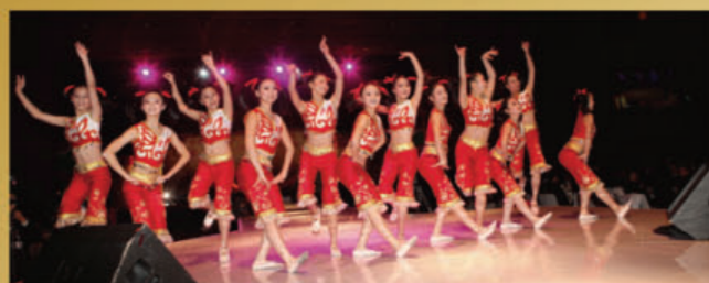
揭陽市藝術學校表演舞蹈「出花園」之一——潮汕「成人禮」。