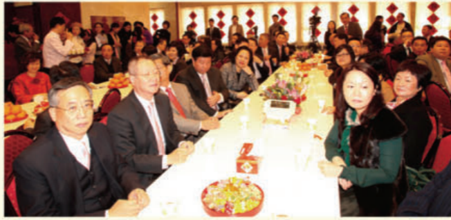
■本會敬備各式家鄉賀年食品給一眾來賓們品嚐。