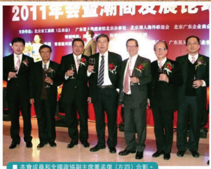
■ 本會成員和全國政協副主席黃孟復(左四)合影。