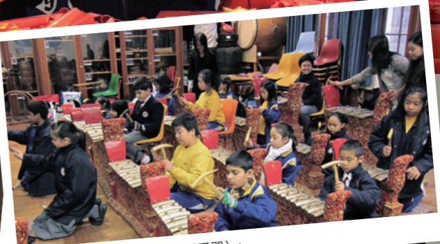
■ 「童」樂飄飄處處聞（專題研習）。