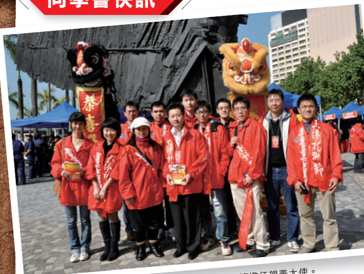
香港潮汕同學會於2011年1月1日為香港龍獅節擔任親善大使。