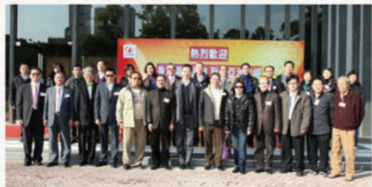
一行30多人參觀亞視。