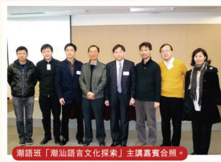
潮語班「潮汕語言文化探索」主講嘉賓合照。