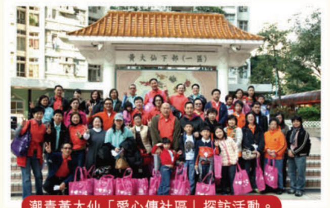
潮青黃大仙「愛心傳社區」探訪活動。