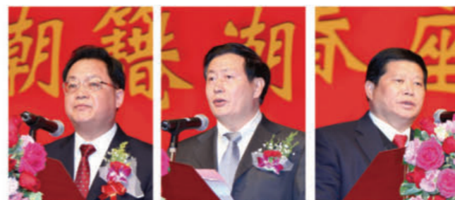
潮州市委書記駱文智致辭。汕頭市市長蔡宗澤致辭。揭陽市委書記陳弘平致辭。

潮汕三市市委、市政府領導早前來港舉行「2011年香港潮籍鄉親迎春座談會」，潮州市委書記駱文智，汕頭市委副書記、市長蔡宗澤，揭陽市委書記陳弘平先後上台致辭，介紹家鄉的最新經濟情況。香港潮屬社團總會創會主席陳偉南盛讚這安排既省人力又省物力，場面更盛大。他致辭時指出，早前親往三市考察，看到不少大型基建陸續開始動工，加上各市政府定下發展目標，相信未來會有令人鼓舞的大好發展。