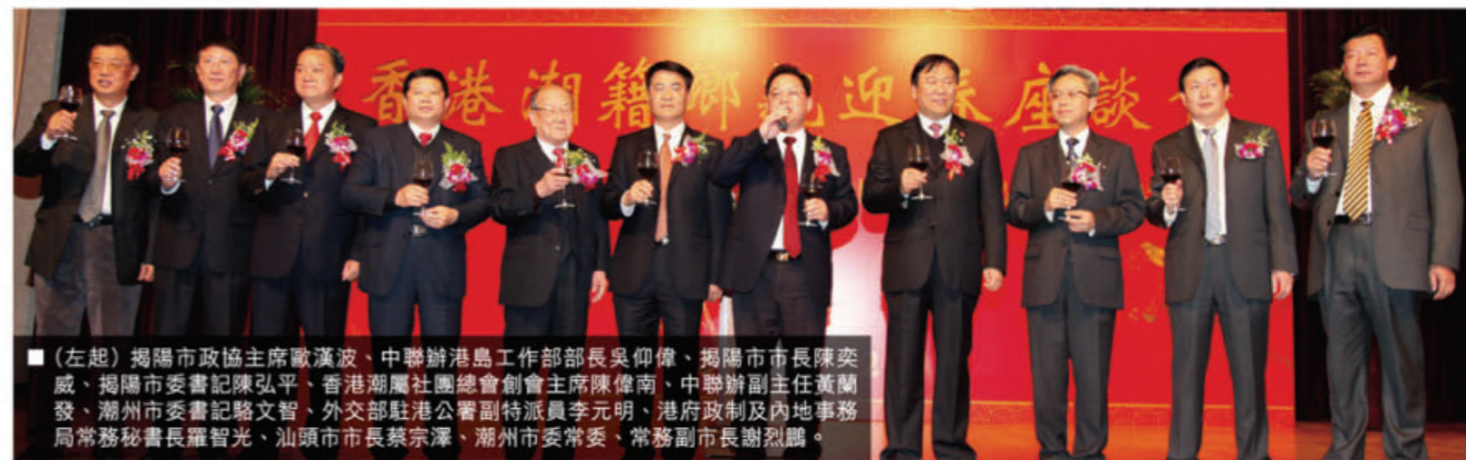
（左起）揭陽市政協主席歐漢波、中聯辦港島工作部部長吳仰偉、揭陽市市長陳奕威、揭陽市委書記陳弘平、香港潮屬社團總會創會主席陳偉南、中聯辦副主任黃蘭發、潮州市委書記駱文智、外交部駐港公署副特派員李元明、港府政制及內地事務局常務秘書長羅智光、汕頭市市長蔡宗澤、潮州市委常委、常務副市長謝烈鵬。