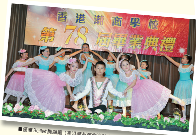
■ 優雅Ballet舞翩翩（香港潮州商會資助項目）。