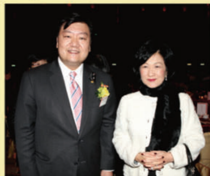
■胡劍江與立法會議員葉劉淑儀於酒會上合照。