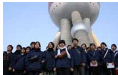
■中二級「國情教育」上海學習之旅。