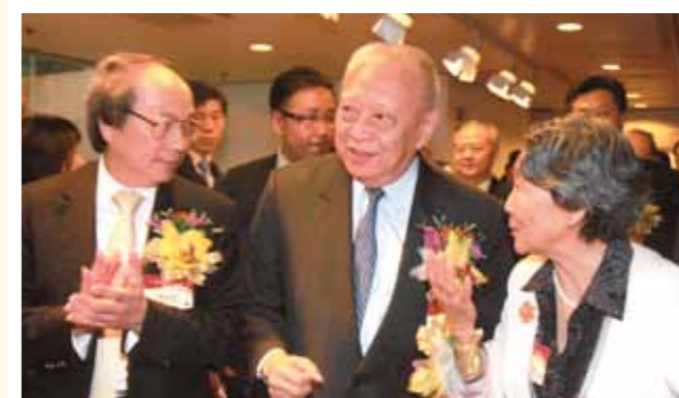
■ 戴德豐(左)、周秉德(右)陪同董建華參觀展覽。