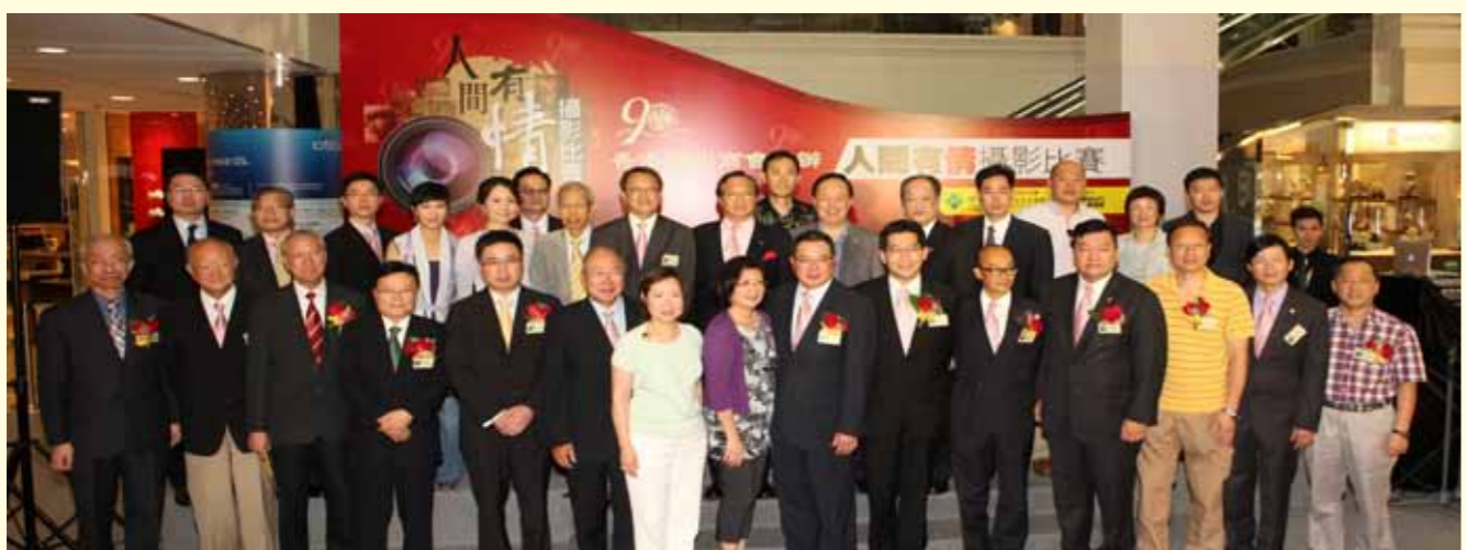
出席儀式之商會首長及會董，與評判及贊助機構代表合照。