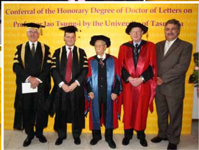
Conferral of the Honorary Degree of Doctor of Letters on Professor Jao Tsung-i by the University of Tasmania