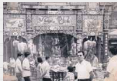
■ 神台及辦事處會客廳。