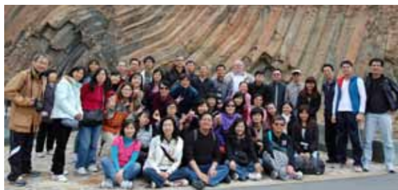
■全體老師參觀地質公園。