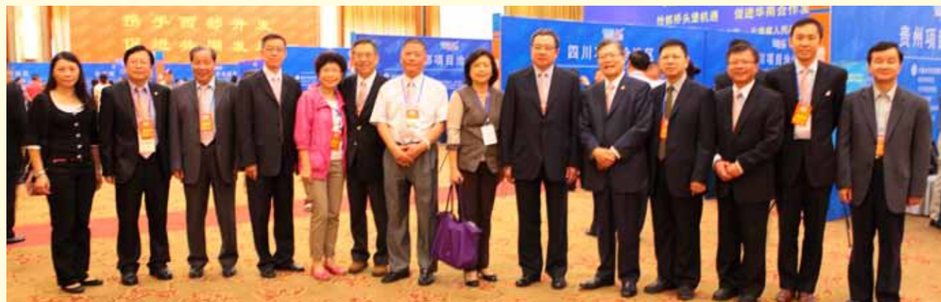
本會參加昆明第九屆東盟華商大會代表在項目推介會上合照。