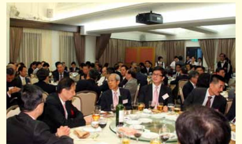
■ 嘉賓盛宴 歡聚一堂。