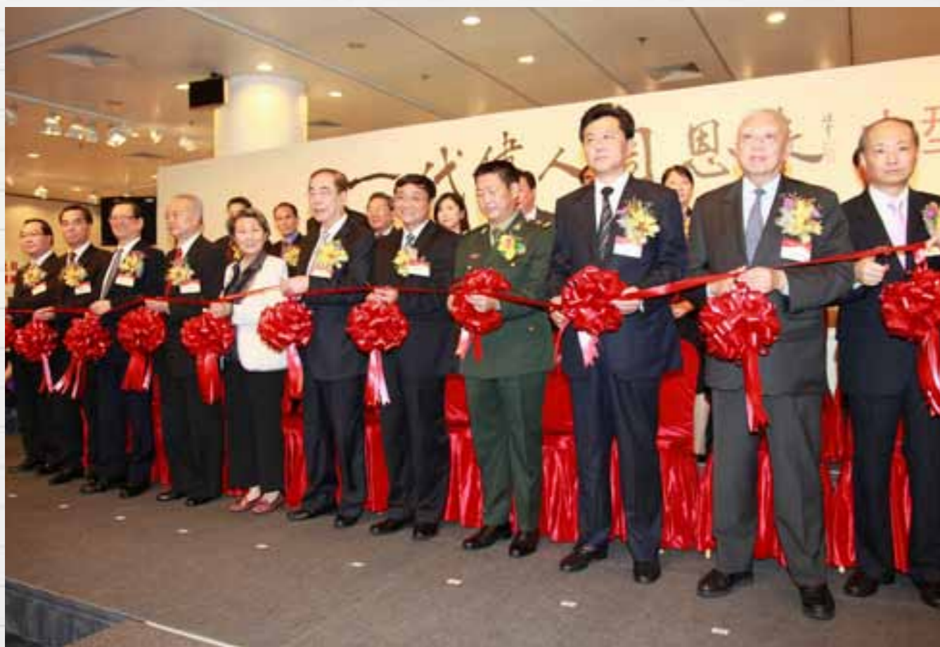
■ 剪綵儀式莊嚴隆重。

由香港各界文化促進會、香港潮屬社團總會等團體合辦，本會等合辦的《一代偉人周恩來》大型專題展覽開幕儀式，於6月28日下午三時在香港中央圖書館隆重舉行。全國政協副主席董建華、中聯辦副主任李剛、外交部駐港副特派員詹永新、解放軍駐港部隊副司令員張明、原全國人大常委曾憲梓及各大主辦團體首長包括香港潮屬社團總會主席許學之、創會主席陳偉南、名譽會長陳有慶及戴德豐等出席主禮。周恩來總理姪女周秉德、周秉建及侄子周秉