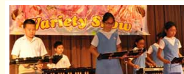
■共譜中西樂章之木琴合奏。