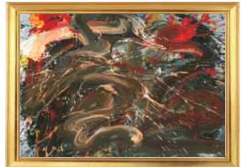
千里波濤滾滾來，雪花飛向釣魚臺 (鋁面丙烯)

1975年出生於吉隆坡。藝術家、水墨畫家、書法家、藝評人及媒體撰稿人。師從當代詩書畫禪高僧伯圓長老 (1914-2009)、法蘭西研究院藝術院院士陳瑞獻先生。1995年獲全球書法繪畫比賽書畫優秀獎、2000年書法作品入編《世界華人書畫作品精選》、2005年獲首爾國際書藝雙年展大會特別獎。