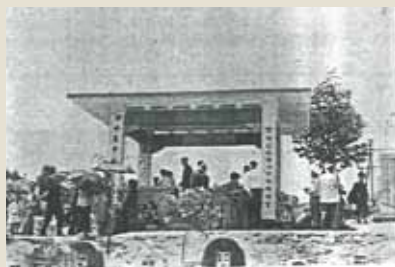
■ 本會和合石潮州義山涼亭（上世紀五十年代）。