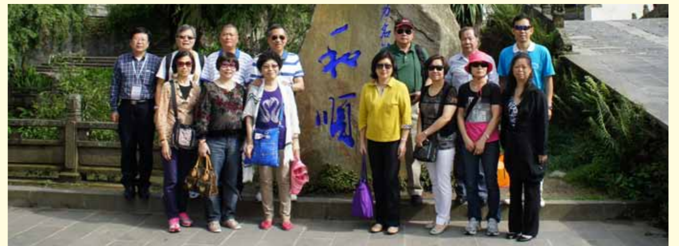
本會代表團在騰沖和順鄉合照。