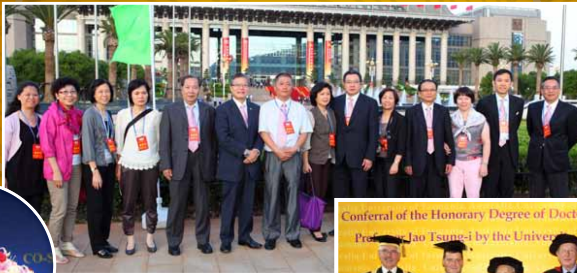
昆明第九屆東盟華商大會