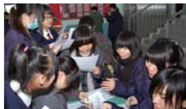
■英語日同學互相切磋。