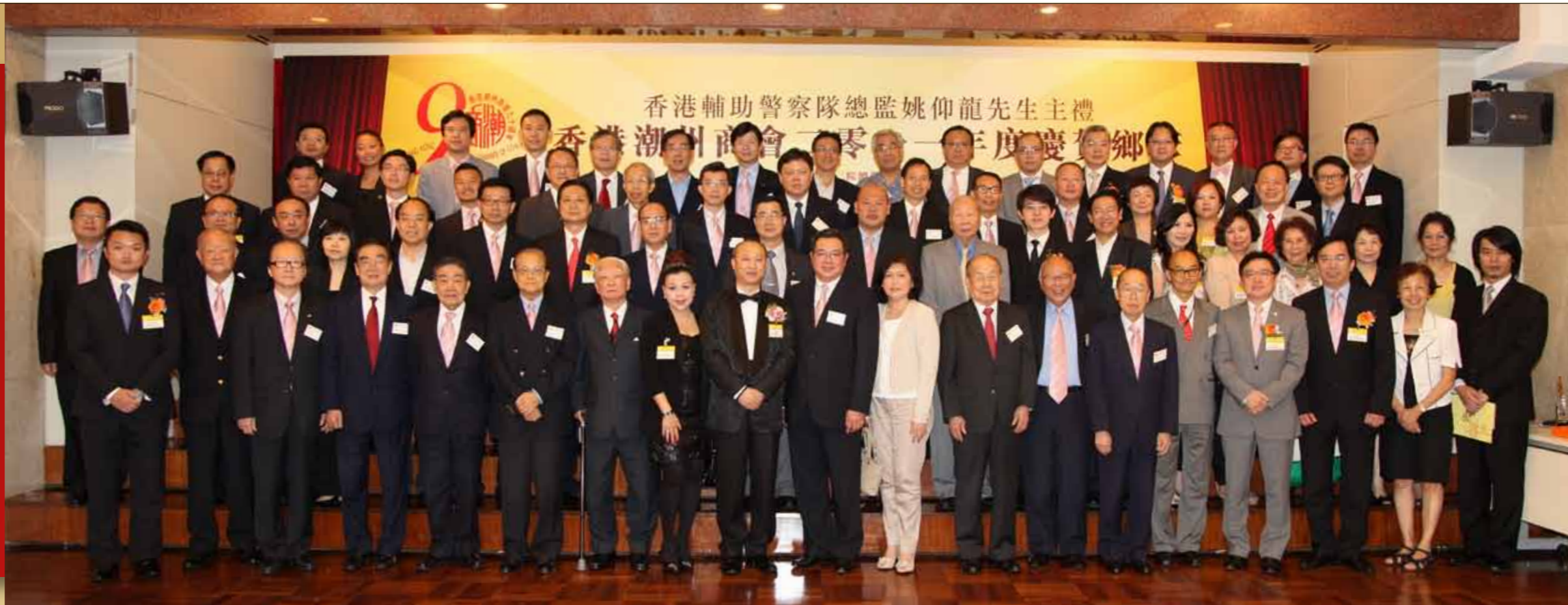
■會長、會董暨受賀鄉彥及嘉賓大合照。

本會6月28日在會所舉行宴賀鄉彥盛事，慶賀榮任本港六大慈善團體要職的潮籍人士。香港輔助警察隊總監姚仰龍蒞臨主禮，他對潮州商會及本港潮籍人士所做出的貢獻予以肯定，並表示衷心的祝賀。姚仰龍亦為潮州人，1976年加入香港輔助警察隊，幾十年來致力服務香港，貢獻良多，先後獲頒香港輔助警察隊長期服務獎章、第一勳扣以及香港警察榮譽獎章等多項殊榮，去年獲行政長官委任為香港輔助警察隊總監。