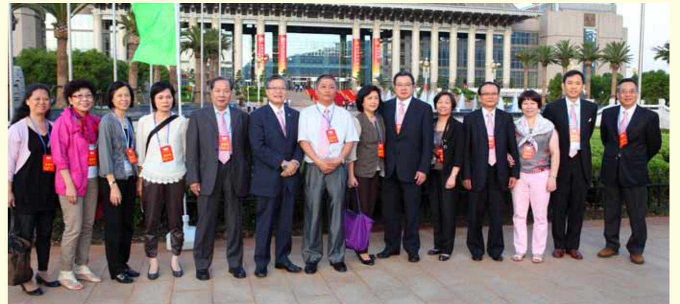
本會代表團參加昆交會開幕式之前合照。