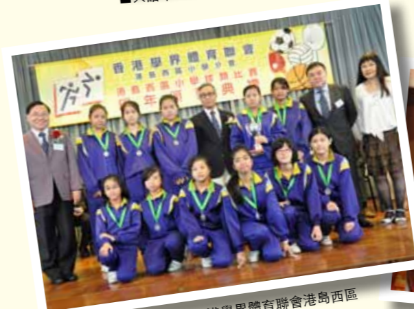
■從小就撐「半邊天」(香港學界體育聯會港島西區小學校際籃球比賽女子組殿軍)。