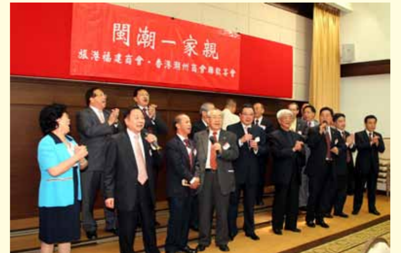
■ 兩會首長及嘉賓高歌一曲《愛拼才會贏》。