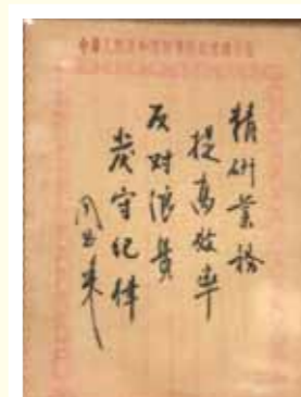
■ 周恩來手稿，至今仍有現實意義。