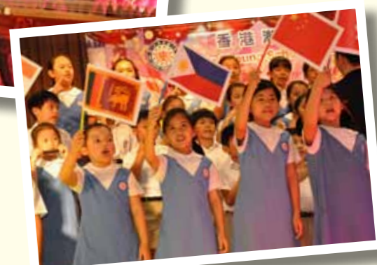
■共譜中西樂章之大合唱。