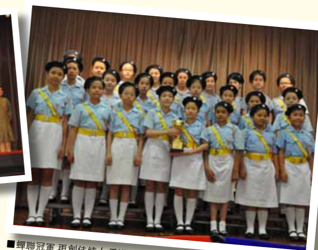
■蟬聯冠軍 再創佳績 (香港交通安全隊港島及離島總區周年檢閱禮步操比賽蟬聯總冠軍)。