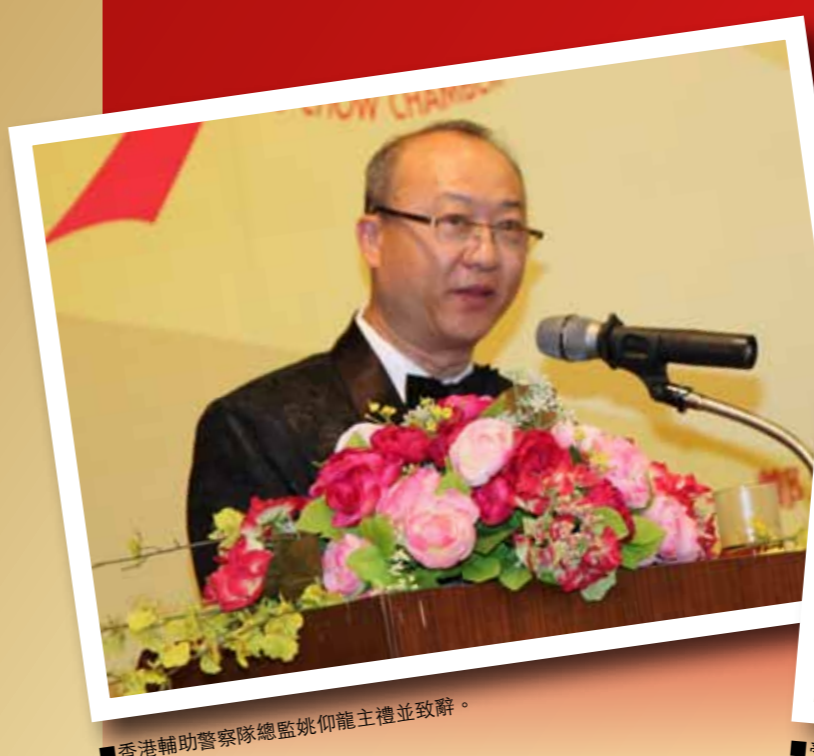
■香港輔助警察隊總監姚仰龍主禮並致辭。