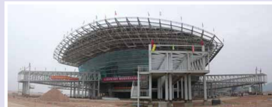
■ 即將完工的潮汕機場。

根據市場預測，潮汕機場為潮汕地區的市場擴展提供了堅實的客貨源基礎。潮汕機場在投入使用兩年後，旅客吞吐量會快速攀升到三百萬人次以上，貨郵吞吐量可望超過兩萬噸。