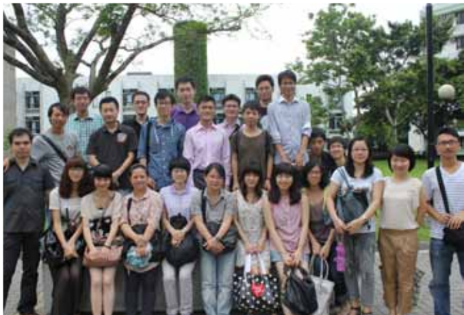
■ 香港潮汕同學會於中文大學聚會，增進友誼。