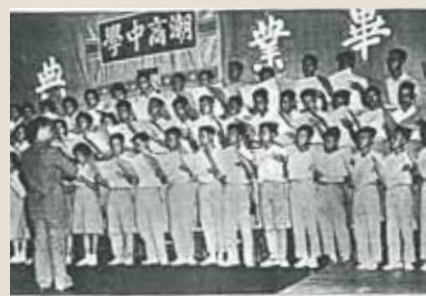
■ 驪歌高唱。本會潮商中學舉行學生畢業典禮（上世紀六十年代）。