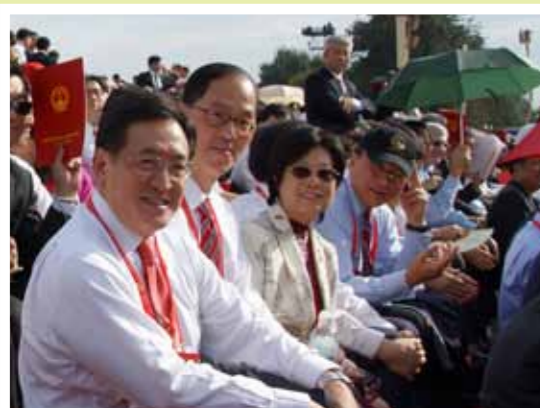
■ 左起：周一嶽、曾德成、曾鮑笑薇。

2011年5月31日是第二十四個世界無煙日，特區政府食物及衛生局局長周一嶽榮獲世衛組織頒發「世衛總幹事特別獎」。周局長在世界無煙日接受傳媒訪問時談了香港推行禁煙的過程，被視為可作其他事務借鑑的經驗之談。