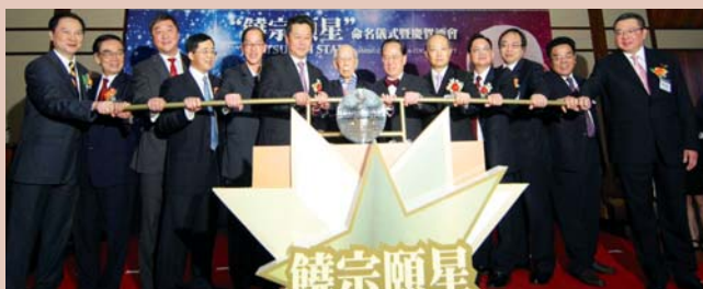
主禮嘉賓一起主持啟動儀式，「饒宗頤星」閃閃發光。

饒宗頤教授出生於潮州，治學於香港，揚名於國際，是蜚聲國際的國學界百科全書式大學者，素有國學大師之稱、國寶之譽。他在歷史、文學、語言文字、宗教、哲學、藝術、中外文化關係等人文科學領域中，皆有卓越的成就和突出的貢獻。2011年7月17日，國際天文聯盟批准南京紫金山天文台發現的國際編號為10017的小行星命名為「饒宗頤星」。小行星命名具有國際性、嚴肅性、唯一性和永久性，是一項崇高的國際榮譽。