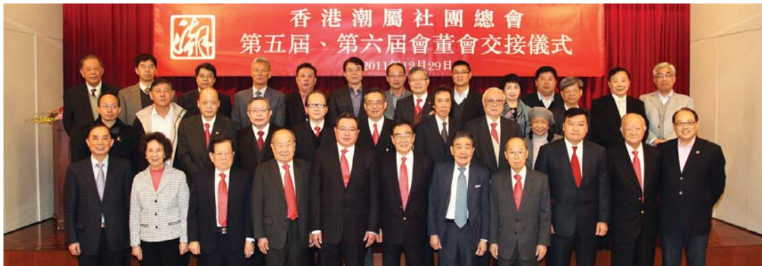
香港潮屬社團總會第五、第六屆會董會交接儀式大合照。

我們要同心協力維護香港繁榮發展，支持香港鞏固並提升國際金融、貿易、航運中心地位。偉大祖國永遠是香港的堅強後盾，香港明天一定會更美好！