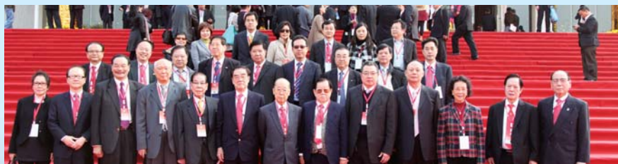
訪問團部分團員在僑博會會場外合照留念。