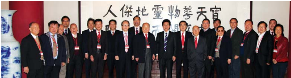
訪問團參觀惠州掛榜閣。