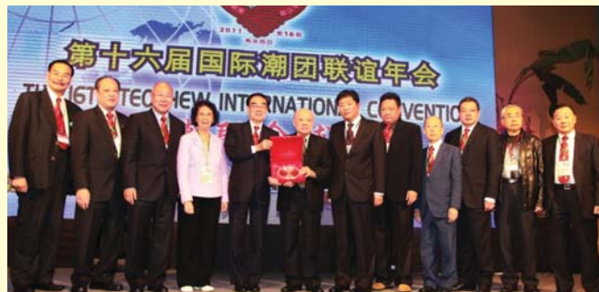
馬潮聯會向香港潮屬社團總會致送紀念品。