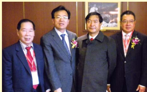
左起：澳洲僑領周光明、全國僑聯副主席李卓斌、原武警部隊司令吳雙戰上將、香港潮商會會長陳幼南。