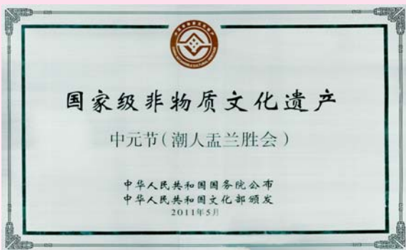
中華人民共和國文化部頒發的標牌。

國家文化部2011年8月29日在北京人民大會堂舉行第三批國家級非物質文化遺產名錄項目頒牌儀式，香港潮人孟蘭勝會列入名錄。中共中央政治局委員、國務委員劉延東出席頒發標牌儀式，向專程前往北京接受標牌的香港潮屬社團總會主席許學之，名譽顧問吳哲歆、陳強，以及秘書長林楓林等頒發標牌。