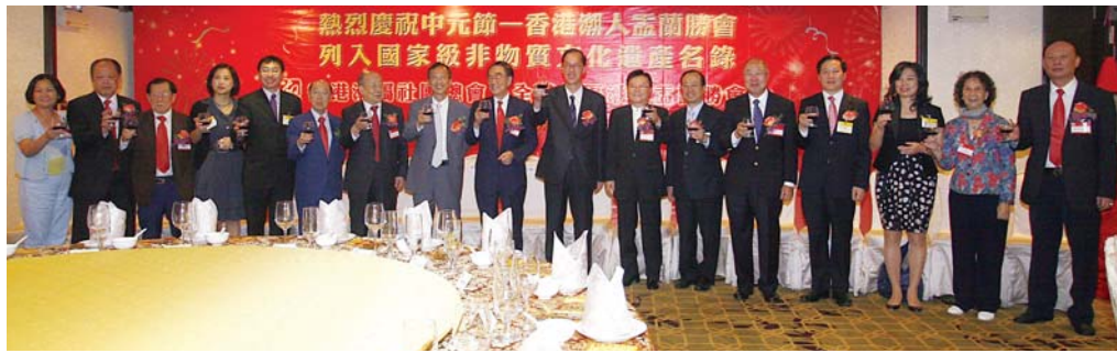
慶功晚宴上，賓主大合照。