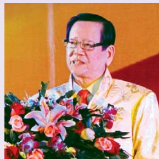
陳有慶在大會上致辭。

香港潮屬社團總會訪問團，出席「深圳第五次潮商大會」。大會潮商雲集，來自深圳、香港、澳門、上海等地和泰國、新加坡、馬來西亞、新西蘭、巴西、法國等國的潮商社團領袖和代表共一千多人，共商潮商發展大計。全國政協副主席、全國工商聯主席黃孟復發來賀信，中國僑聯副主席陳有慶，汕頭、潮州、揭陽、汕尾四市領導李鋒、李慶雄、吳紫驪、杜安義、張應傑、馬逸麗，深圳市委常委、統戰部長張思平等出席，見證潮商一年一度盛會。