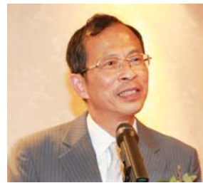
立法會主席曾鈺成致辭。