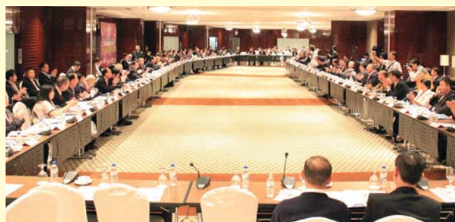
團長秘書長暨會員大會盛況。