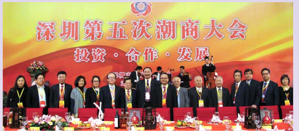
訪問團在潮商大會上合照。

香港潮屬社團總會訪問團，出席「深圳第五次潮商大會」。大會潮商雲集，來自深圳、香港、澳門、上海等地和泰國、新加坡、馬來西亞、新西蘭、巴西、法國等國的潮商社團領袖和代表共一千多人，共商潮商發展大計。全國政協副主席、全國工商聯主席黃孟復發來賀信，中國僑聯副主席陳有慶，汕頭、潮州、揭陽、汕尾四市領導李鋒、李慶雄、吳紫驪、杜安義、張應傑、馬逸麗，深圳市委常委、統戰部長張思平等出席，見證潮商一年一度盛會。