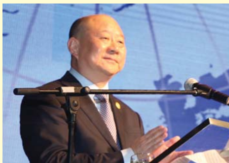
湖北省副省長田承忠致辭。