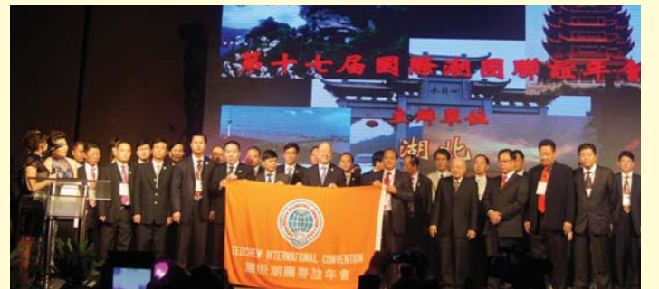
湖北潮人海外聯誼會接過年會旗幟。