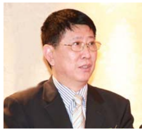
中聯辦港島工作部部長吳仰偉致辭。