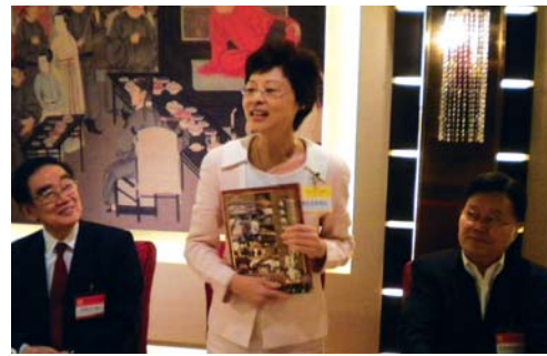
民政事務總署署長陳甘美華出席本會另一慶賀宴會，不忘叮囑舉辦孟蘭勝會活動時要注意安全。