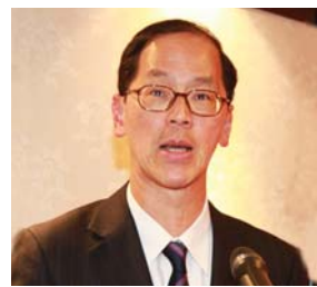
民政事務局局長曾德成致辭。