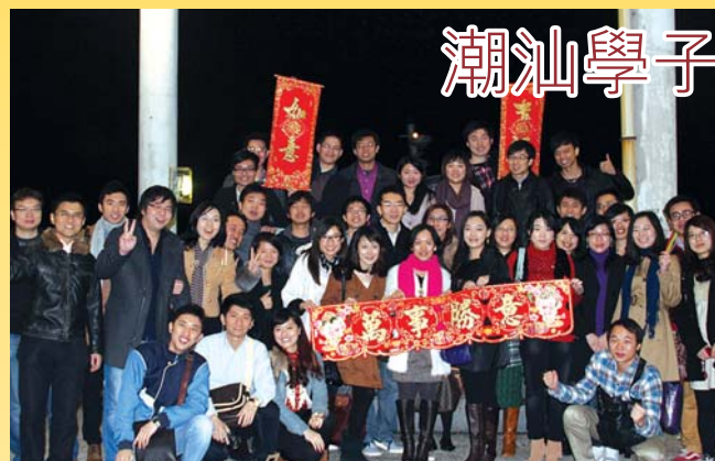
香港潮汕同學會來一張2012新年聯歡大合照。

香港潮汕同學會活力四溢，同學們除了認真面對學業，也積極參與社會活動，尤其是香港潮屬社團總會的活動，處處留影。新年伊始，同學會組織同學們歡慶佳節：自助餐起興，尖沙咀躍動，登船眺國金，觀維港煙花，握別九龍城。過一個別具新意的新年倒數夜，讓同學們留下美好的記憶。