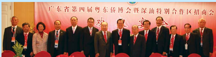
攝於廣東省人民政府歡迎宴會上。