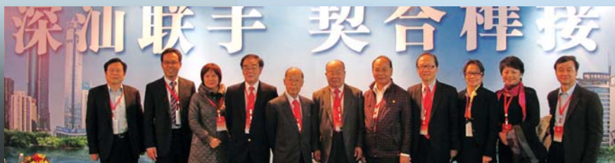
訪問團參觀「深汕特別合作區」時，合照留念。