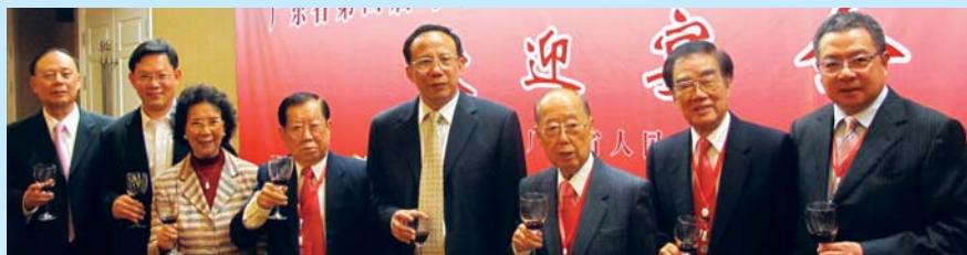
廣東省副省長林木聲(右四)與僑領們合照。