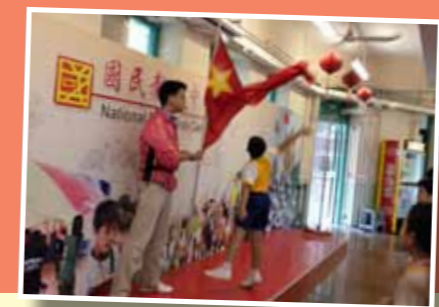
■參觀國民教育中心