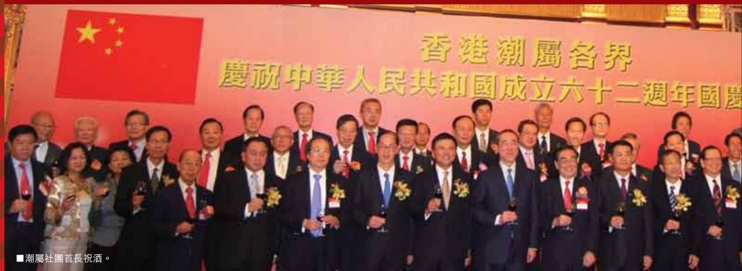
■潮屬社團首長祝酒。