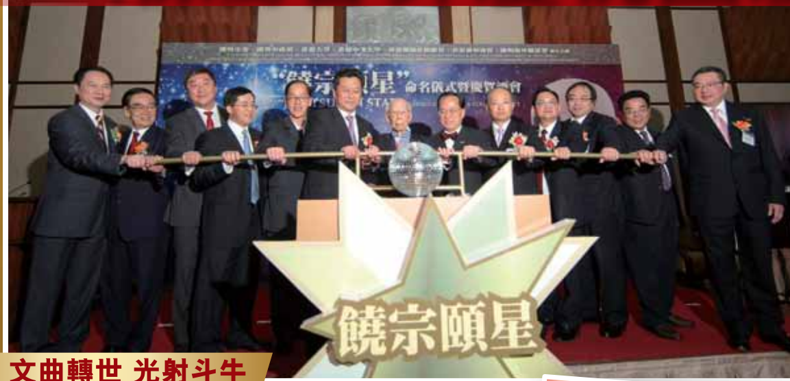
文曲轉世 光射斗牛