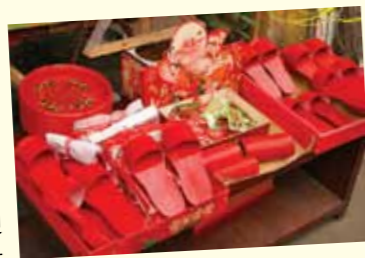
■ 孩子「出花園」穿的紅木屐

昔年潮州民俗，孩子(有些地方僅限於男孩)滿十五歲時，要舉行「出花園」儀式。出花園就是拜公婆神，公婆神即花公花母。宋楊循吉《除夜雜詠》說：「買糖迎灶帝，酌水祀床公。」「出花園」儀式有兩層意思：把公婆視為子女平安成長的保障；出花園表示孩子已成人。