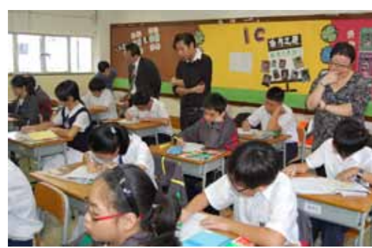
時代廣場及中大代表共九人到本校訪問，並到課室參觀同學上課的情況。