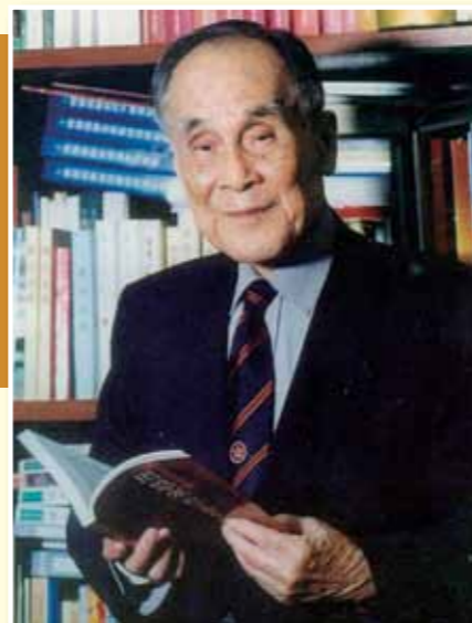
■《莊世平百年誕辰紀念文集》

毛澤東主席說過：「一個人做一點好事並不難，難的是一輩子做好事……」莊老在將近一個世紀的人生歷程中，每一腳步都與國家民族的利益緊密相連，畢生為祖國富強、民族復興、香港回歸祖國和深圳、汕頭經濟特區的建設嘔心瀝血，不辭辛勞，鞠躬盡瘁。莊老一生的業績、無私奉獻精神和高尚品格，永遠載入中華民族的光輝史冊。