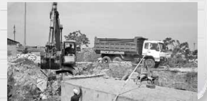
■潮州市啟動建造億噸大港工程。

潮州市建造億噸潮州港，着手大港口大經濟大發展理念、構築港口綜合交通樞紐體系、加快建設完善臨港產業轉移園區、打造國際資源物流中心這四方面的工作。潮州港有成為珠三角經濟區和海峽西岸經濟區的未來「樞紐和隘口」、對台經貿合作與交流的「橋頭堡」、廣東海上「東大門」等優勢。潮州市已通過大型央企、國內龍頭企業和面向世界五百強招商，並發揮知名潮人、著名僑領、歸國華僑以及廣大市民的積極作用，提升影響力。