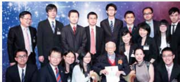
■香港潮汕同學會與饒公於「饒宗頤星」命名儀式大合照。