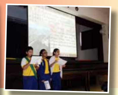
■周會活動 - 中國名勝介紹