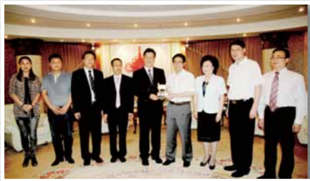
■汕頭市委書記李鋒在汕頭迎賓館會見了香港文匯報社長王樹成一行人。