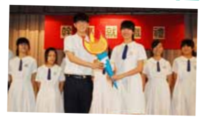
新一屆學生會內閣Kindle 成功獲得同學支持，接棒為同學服務。