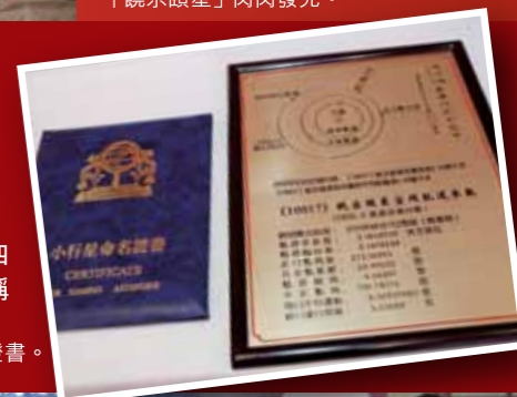
饒宗頤星命名證書。

中國科學院紫金山天文臺1978年10月30日發現。 饒宗頤，號選堂（1917年出生），是蜚聲中外的漢學大師和書畫家。他游學四海、著作等身，曾在亞洲、歐洲和北美洲的著名大學講學，學術著作80多部，被稱為「導夫先路的漢學大師」。