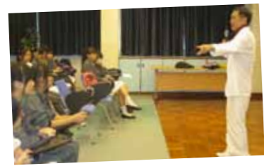
為提高學生的演說技巧，中文學會特意舉辦「口才培訓班」，並邀請前鳳凰衛視主持人嚴力耕先生來校指導同學朗誦及演說技巧。