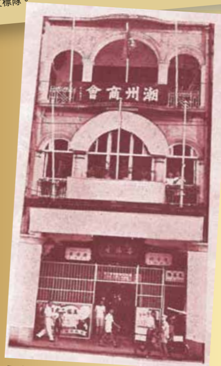
■ 上世紀五十年代本會建築物外貌。

1948年香港潮州商會舉行慶祝「商人節」活動，令這一至今已湮滅的節日藉着這珍貴的圖片而重現眼前，這是「流金歲月」提供的珍貴圖片的功勞。本期三幀圖片，除此之外，還可以從上世紀五十年代本會會館外貌以及本會第十七屆理監事就職紀念及與來賓的合照，見識上世紀三十年代既樸實又豪華的香港室內陳設，和五十年代上環一帶建築物的風格。