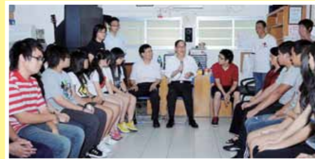
■民政事務處處長曾德成與二十多名青少年一起探訪香港晨曦會黃大仙中途宿舍。

禁毒宣傳以潮語「企硬！Take 嘢衰硬！」為口號，已街知巷聞。K 仔、丸仔這些毒品近年成為香港抗毒戰爭中的頭號敵人，對青少年的荼毒廣泛而深遠，要有效對抗毒品，必須動員社會各界的力量。「友出路」這個平台，就是為青少年鋪設健康人生路的一道最有效階梯。