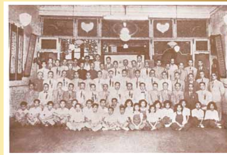
■ 本會第十七屆理監事就職紀念及來賓合影。