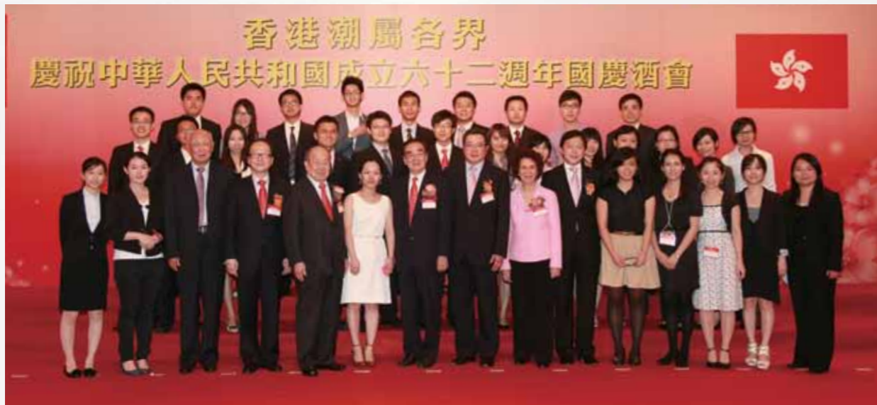
■香港潮汕同學會與潮屬社團首長大合照。

香港潮汕同學會以香港為家，積極參與社會活動，尤其是潮州商會及潮屬社團總會的活動，甚獲好評。不少同學認為，除了求學之外，社會更是一所難得的大課堂，為他們提供了最實用最有教益的機會。兩個月來，同學會參加了大型的潮屬社團主辦的國慶酒會、領略了饒宗頤星命名典禮的莊重典雅、為香港普寧同鄉聯誼會爭當義工的興奮，登高望遠感受蒼山如海的大自然壯觀。許學之主席特別於深灣遊艇會與同學們聚餐，表彰和讚賞他們投身社會事務。