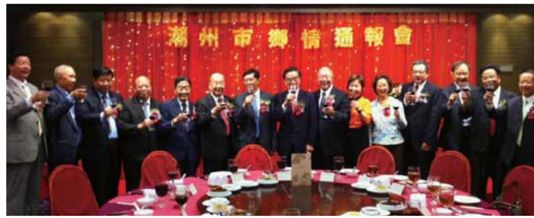
■ 賓主舉杯，共祝潮港兩地繁榮昌盛。

潮州市委書記許光一行在港舉行「潮州市鄉情通報會」，潮籍首長及鄉親逾百人出席。許光書記向與會者通報潮州市近年經濟社會發展情況，以及今後工作規劃，並期望透過通報會與潮籍鄉親加強聯繫溝通，共同推進潮港合作交流，共同為潮州的崛起而努力。陳偉南創會主席致辭時形容自己「人在香港，心繫家鄉」，一直關心家鄉的經濟發展。