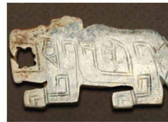
白玉福壽盒 清乾隆 · 青玉子母獸水丞 清 · 青白玉虎 商