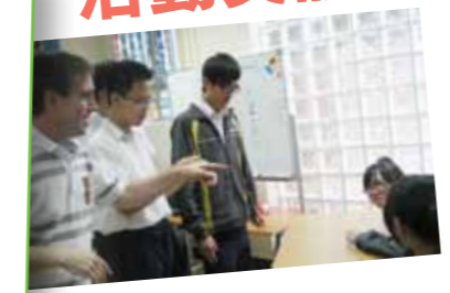
為提高同學學習英語的效果，本校的外籍英語老師特別設計不同的學習活動，以提高同學學習英語的興趣和動機。