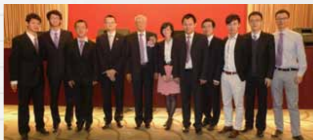
■香港潮汕同學會於香港普寧同鄉聯誼會成立十六周年暨第九屆會董就職典禮擔任義工。