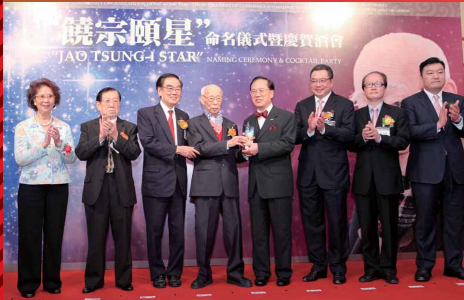
饒公與香港潮屬社團總會及潮州商會首長致送紀念品予曾蔭權特首。