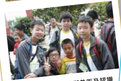
為讓學生了解城鄉差距及認識內地農村的发展，學校特別安排中一同學到韶關體驗農家生活。