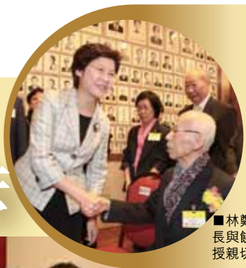
林鄭月娥局長與饒宗頤教授親切交談。