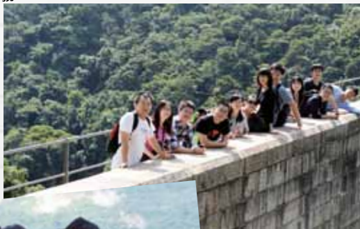
■蒼山如海，壯志凌雲。香港潮汕同學會大譚郊野公園遠足。

香港潮汕同學會以香港為家，積極參與社會活動，尤其是潮州商會及潮屬社團總會的活動，甚獲好評。不少同學認為，除了求學之外，社會更是一所難得的大課堂，為他們提供了最實用最有教益的機會。兩個月來，同學會參加了大型的潮屬社團主辦的國慶酒會、領略了饒宗頤星命名典禮的莊重典雅、為香港普寧同鄉聯誼會爭當義工的興奮，登高望遠感受蒼山如海的大自然壯觀。許學之主席特別於深灣遊艇會與同學們聚餐，表彰和讚賞他們投身社會事務。