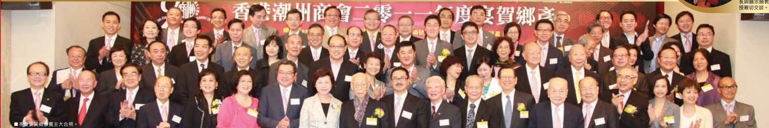
本會宴賀鄉彥賓主大合照。