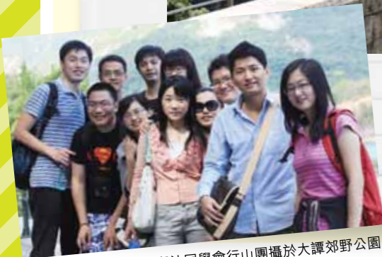
■香港潮汕同學會行山團攝於大譚郊野公園。