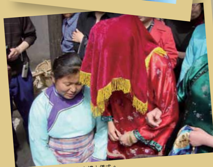
■ 舊時潮汕婚禮的「行六禮」儀式。

六禮中的前五禮與古禮相同，唯第六項「親迎」變為「迎親」。《潮州的習俗》載：「迎親的手續，是由男家備了一乘花轎，花轎前有兩人提着一對大燈籠及幾個吹唢呐和打鼓，花轎後跟着一兩乘轎子，轎裡坐着男家請往迎親的人到女家迎娶新娘。這種由婿「親迎」到請人前去「迎親」的嬗變，是由繁到簡的革新。」