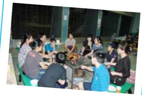
為讓新到本區的學童家長更了解學校，學校及家長教師會合辦「親子燒烤晚會」，與欣安村的家長和同學加強交流。