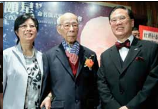
行政長官曾蔭權夫婦與饒公合影。