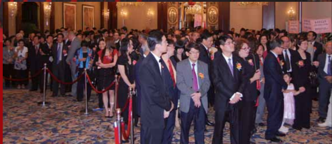
■場面感人，氣氛熱烈。