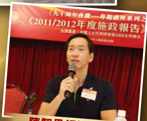
陳智思解讀施政報告