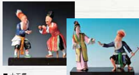
■ 十五貫 ■ 桃花過渡

潮州大吳泥塑源遠流長，其歷史可溯至南宋理宗嘉熙元年（1237年），距今近八百年。清代中葉至民國初為大吳泥塑發展的鼎盛時期，泥塑作坊遍及全村，出現以吳潘強為代表的一百多名泥塑藝人，藝術表現手法為雕、塑、捏、貼、刻、印、彩得到完美發展。其中的貼、印、彩的緊密有機結合形成了很強的民族風格，是區別於其他雕塑和民間泥塑的地方藝術特色。