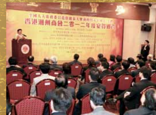
■ 同賀鄉彥，氣氛熱烈。