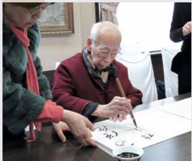
饒宗頤教授席間揮毫，送贈唐詩。

饒宗頤教授早在五十年代已赴日本京都大學講課及做學術研究，今次京都之行再訪京都大學人文科學研究所。故地重聚，老人家十分興奮，主動揮筆寫下李白詩〈聽蜀僧濬彈琴〉：「蜀僧抱綠綺，西下峨眉峰。為我一揮手，如聽萬壑松。客心洗流水，餘響入霜鐘。不覺碧山暮，秋雲暗幾重。」並送給研究所。