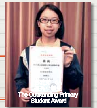
The Outstanding Primary Student Award

香島教育機構 2011年優秀小學生獎勵計劃 The Outstanding Primary Student Scheme