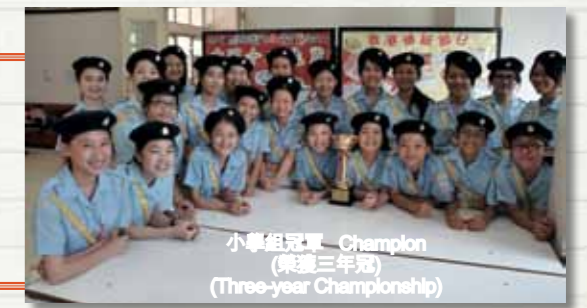
小學組冠軍—Champion (榮獲三年冠) (Three-year Championship)

香港交通安全隊 港島及離島總區周年檢閱禮步操比賽 Hong Kong Road Safety Patrol Hong Kong & Islands Regional Annual Inspection Parade March