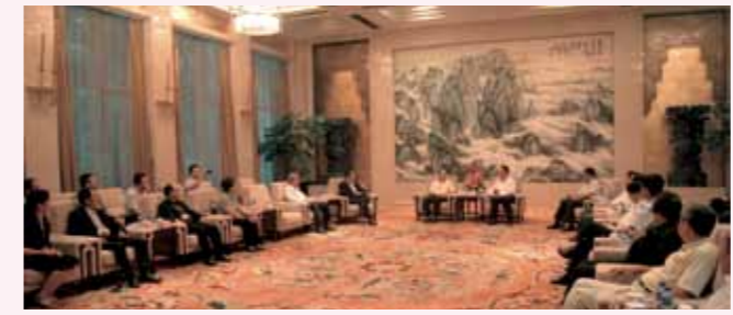
■ 湖北省委副書記張昌爾會見年會理事。

出席是次會議有：馬來西亞潮州公會聯合會主席林源德，香港潮屬社團總會主席陳幼南，泰國潮州會館主席蔡漢強，新加坡潮州八邑會館會長吳南祥，澳門潮州同鄉會理事長陳新濤，法國潮州會館副會長蔡梓霖，汕頭海外交流協會常務副會