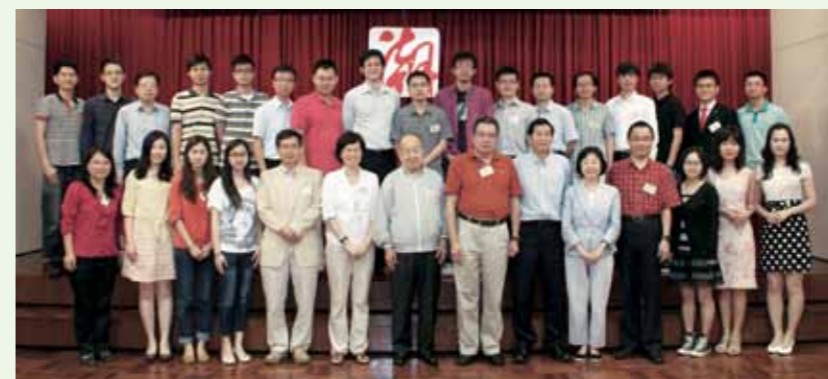
■ 「國際潮籍博士聯合會(暫名)」籌備會議大合照。