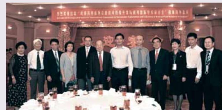
■ 潮州市李慶雄市長與部份與會者合照。

韓山師範學院是廣東省本科大學，辦學百多年來，為粵東地區培養大批人才，在港澳及東南亞地區也有不少校友。近年韓師進步很快，這次和香港科技大學合作，有助韓師學術地位更上層樓。