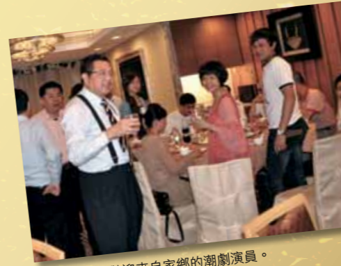
本會設宴歡迎來自家鄉的潮劇演員。