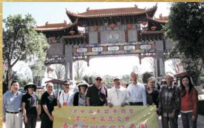
■ 代表團在官渡古鎮留影。