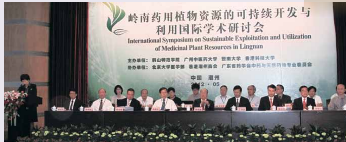
■ 「嶺南地區藥用植物資源的可持續開發與利用國際學術研討會」主席台。