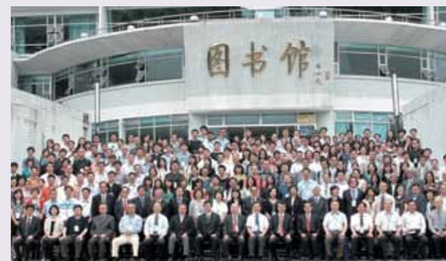
■ 出席的嘉賓、學者與部份韓山師範學院師生合照。

張成雄副會長回顧了十五年來，香港經歷SARS、世界金融海嘯、歐債危機等風浪，在世界經濟不景氣中，依然保持繁榮穩定，全賴中央鼎力支持。李克強帶來「三十六條」，為香港經濟、社會、民生等各方面注入新動力。他相信，隨着新一屆政府就任，香港必有一番新氣象。