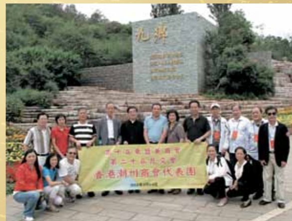
■ 代表團團員攝於九鄉國家四A旅遊區。