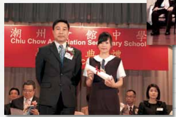
周處長頒發畢業證書予畢業同學