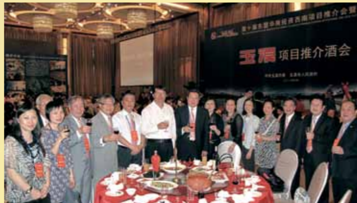
■ 出席玉溪市項目推介酒會。