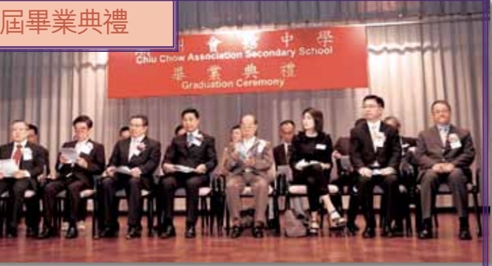
畢業典禮主禮嘉賓、校監及各校董