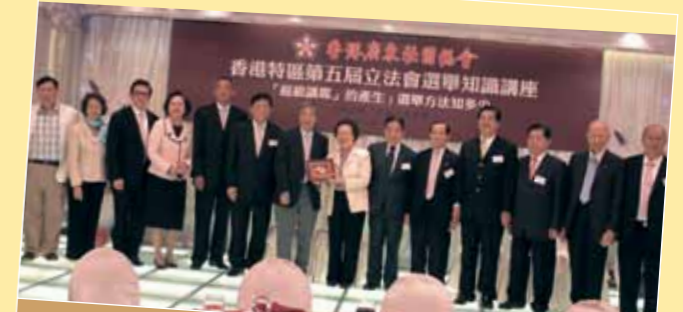
■ 潮屬總會首長出席廣東社團總會立法會選舉講座。