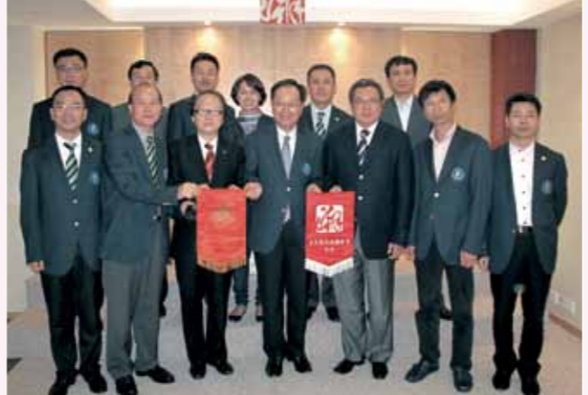
■ 深圳市潮青聯誼會到訪潮屬總會。