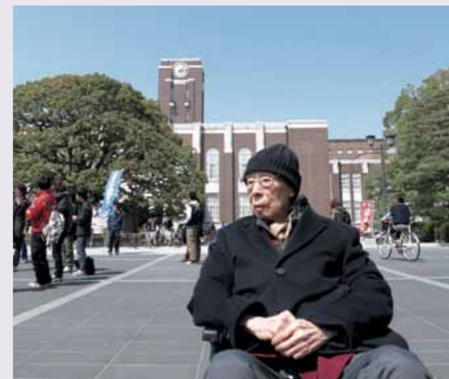
饒宗頤教授重訪京都大學。