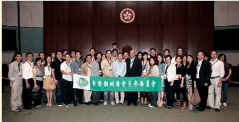
■ 青委參觀立法會，全體團員與立法會曾鈺成主席於會議廳大合照。