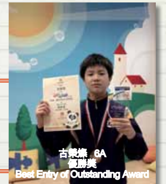
古樂熾 6A 優異獎 Best Entry of Outstanding Award

香港公共圖書館 2012年4.23世界閱讀日創作比賽 4.23 World Book Day Creative Competition 2012 高小中文組 Senior Primary Chinese Category