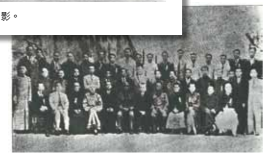
第十五屆理監事就職典禮紀念留影。