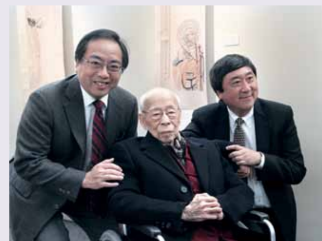
香港大學徐立之校長(左)、香港中文大學沈祖堯校長(右)祝賀饒宗頤教授。

個有趣的研究路向。例如饒教授綜合了唐人壁畫中的菩薩與神鳥，創作《蓮座菩薩》，就是追求唐人壁畫裡一種獨特的情趣，已不只是敦煌壁畫原來的模樣。饒教授也認為，禪畫是中國繪畫中一個很重要流派，所以對中國禪畫，尤其是八大山人繪畫的研究既深且廣，並因此開始對創作禪畫，亦作出多角度探討，創作出了不少具有時代性的禪意繪畫。