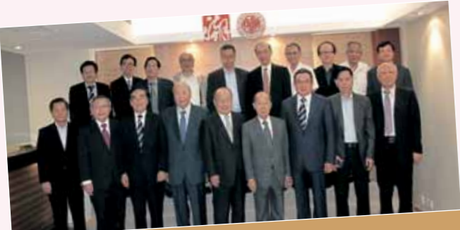
■ 莊世平基金會召開第一屆第一次會員大會。