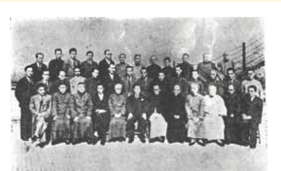
第十四會董就職留影。