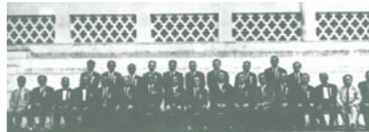
▲ 第20屆會董就職典禮。