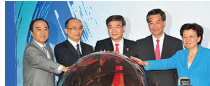
▲ 深圳希瑪林順潮眼科醫院開幕。

由香港著名眼科醫學權威，潮籍鄉親林順潮教授創辦的深圳希瑪林順潮眼科醫院在深圳開業並親任院長。這是CEPA對港資投資內地醫療服務領域「開閘」後，內地首家開業的港資獨資醫院。特首梁振英、中聯辦副主任殷曉靜、深圳市長許勤、深圳市人大主任白天等出席開業慶典。梁振英表示，兩地醫療合作將促進優勢互補，共同提升醫療服務水平，造福人民，共圓中國夢。林順潮認為，將香港優質資源幅射到內地，是香港中長期發展醫療產業重要的一環，北上提供醫療服務可以做到多贏結果。