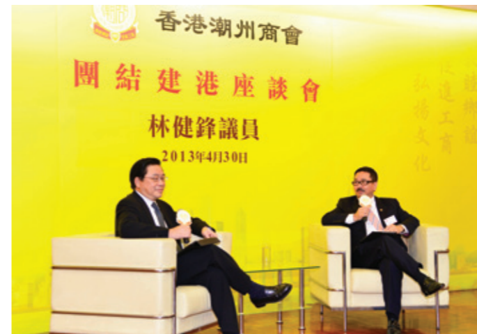
▲ 周振基會長(右)與林健鋒議員(左)對談。

本會4月30日於會所大禮堂舉行第7場「團結建港」座談會，邀請香港行政會議成員、立法會議員林健鋒到會。林議員於香港出生，是第12屆港區全國人大代表，曾任公職包括：盛事基金評委會主席、西九文化區管理局董事局成員、公務員薪俸及服務條件委員會成員等。林議員對社會政治經濟事務十分熟悉，對香港有着十分濃厚的感情。會董及同仁十分高興有機會分享他從政從商的心得體會。