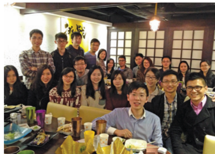
▲ 潮汕同學會新春聯歡。

蛇年新春到來，趁著春意濃，歡度春節氣息還未散盡，香港潮汕同學會的兄弟姐妹們於3月3日在燒魂屋舉行了「開年飯」活動，大家共聚一堂，交流近況，暢敘鄉情，歡樂的笑聲和暖暖的情誼充滿每個同學的心，大家期待新一年人人健康開心，事事順利。