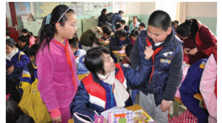
▲ 參觀朝陽區高碑店中心小學，與當地學生交流分享。