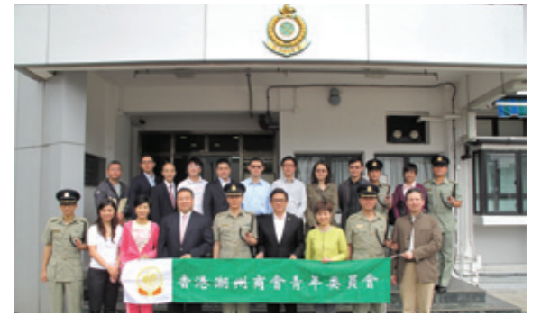
▼ 參觀香港海關訓練學校大合照。