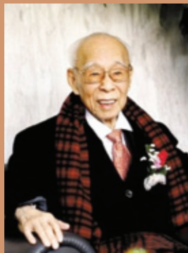
▲ 饒宗頤獲「世界中國學貢獻獎」。

以「中國現代化：道路與前景」為主題的第5屆世界中國學論壇在上海展覽中心舉行，近300名專家學者共同探討中國與世界的互動相處之道。來自俄羅斯的齊赫文斯基、美國的傅高義、香港的饒宗頤等3位中國學泰斗，獲頒「世界中國學貢獻獎」。