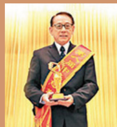
▲ 楊受成蟬聯5屆最具愛心獎。

英皇集團主席楊受成博士，是本港成功人士，也是潮籍人士，早於2005年第一屆「中華慈善獎」已奪得「中華慈善獎——最具愛心捐贈個人獎」，此後由2008年起一連5屆蟬聯此項殊榮，成為香港潮人的典範。