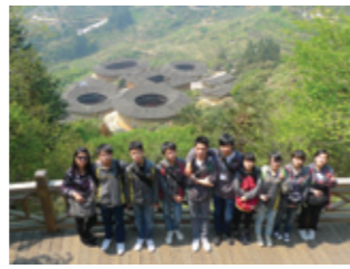
▲ 從高處俯瞰南靖田螺坑土樓群「四菜一湯」的形勢。

為加深同學對國家文化及內地升學與就業的認識，學校為中四全級同學舉辦《閩南文化考察與內地升學體驗之旅》。同學參觀華僑大學，了解國內大學收生要求、科系、費用及就業前景等，為前途作較全面的規劃。同學參觀田螺坑土樓，從歷史角度認識土樓文化遺產，加深對福建本土歷史文化的認識，更可從藝術角度欣賞土樓建築藝術風格。