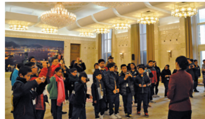
▲ 感謝中聯辦的安排，讓我們有機會參觀人民大會堂，並一睹香港廳的風采。