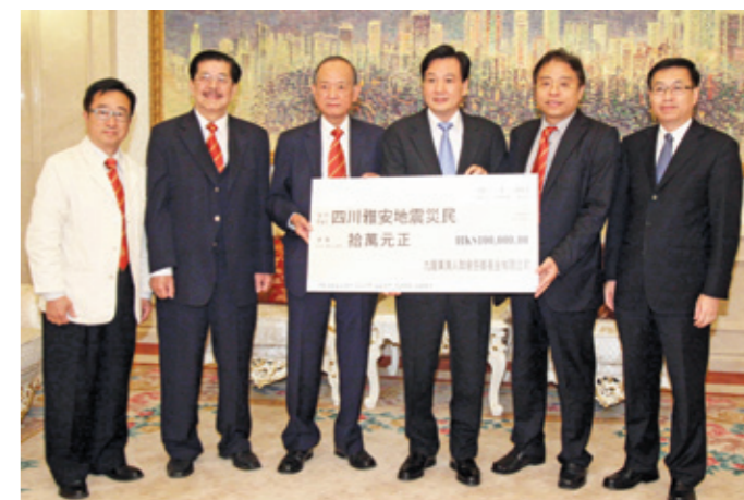
▲ 九龍東潮人聯會透過中聯辦捐10萬元善款予災區，由中聯辦副主任林武(右3)代表接受。