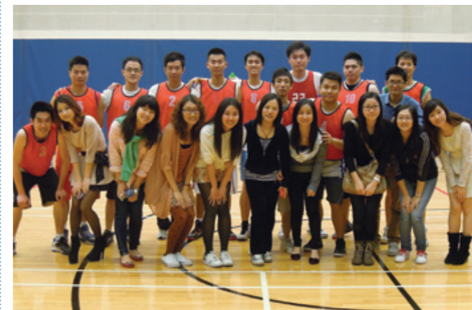
▲ 香港潮汕同學會籃球隊與啦啦隊大合照。

「香港潮汕同學會」與「新港青年會」3月10日晚於荔枝角公園體育館舉行2013年首場籃球友誼賽，激烈而有序，賽後兩隊隊員相互擁抱握手，並合照留念。是次比賽更有美女啦啦隊加油助威，氣氛熱烈。