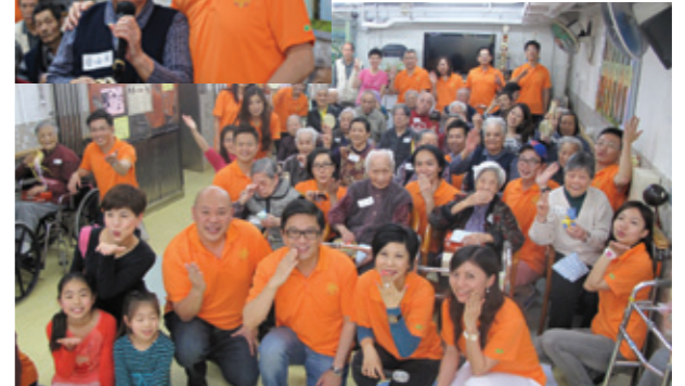
▼ 探訪順天邨黃張見紀念老人之家。