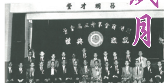
▲ 第19屆理監事就職典禮。