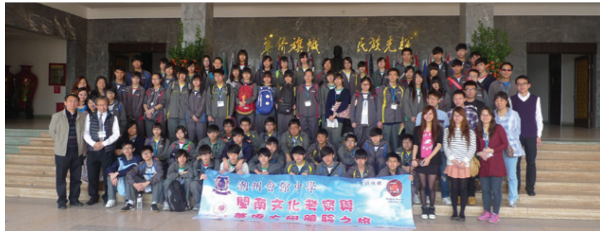
▲ 本校師生在華僑大學泉州校區與大學招生主任及華大師生合照。