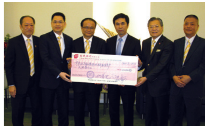
▲ 潮僑工商塑膠聯合總會將20萬元善款透過中聯辦轉交災區，由中聯辦協調部副部長郭亨斌(右3)代表接受。