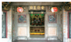
▲ 安濟王廟(青龍古廟)。

青龍古廟在潮州韓江大橋西端南堤，據記載建於北宋，又相傳諸葛征蠻，蜀漢永昌太守王伉守城抗賊，歿為神明。青龍古廟創自明代，因常見青蛇蜿蜒出沒，不傷人而來去無蹤，故名。正廳門上題額「青龍古廟」，大門橫額則題「安濟聖廟」。據傳，明代潮州人謝少滄在雲南為官，恰逢大旱饑饉，他為免延遲時日先開官倉濟災而後上奏朝廷，獲罪問斬；按滇俗，處決囚犯吊於大樹三天尚活者可免其死。其地白天日炙而夜司風寒，誰知「天降神人」，張開大黑布化為烏雲頂住烈日風霜，三天後謝竟死裡逃生，即備祭品到神廟祭拜，見正中端坐者就是搭救自己的神人蜀漢永昌郡太守、「安濟聖王」王伉，自此日夜焚香拜之，並於回潮時，將王伉及大、二夫人偶像帶回設點供奉。廳外有「仙師宮」和官廳，官廳前座供謝少滄木主。每年正月，安濟聖王出遊，城中萬人空巷，爭迎神駕，出遠洋和經商者尤將其視為事業騰達的保護神。