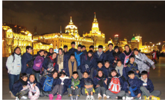
▲ 披上華麗彩衣的上海黃浦外灘。

為了幫助同學在新學制中奠下良好基礎，成功銜接新高中課程，我校於2012年3月14-17日，舉辦了《通識教育科——上海學習之旅》。此活動是配合中二級通識教育科議題——《上海與香港》及《旅遊樂無窮》，並回應新高中「現代中國」及「今日香港」的學習單元之需要，全級同學到上海進行學習、考察及體驗，見證中國改革開放後的成果，以收「靈活學習、見多識廣、觸類旁通」的果效。是項活動獲辦學團體、校方及關愛基金的支持，大額贊助學生的遊學費用。