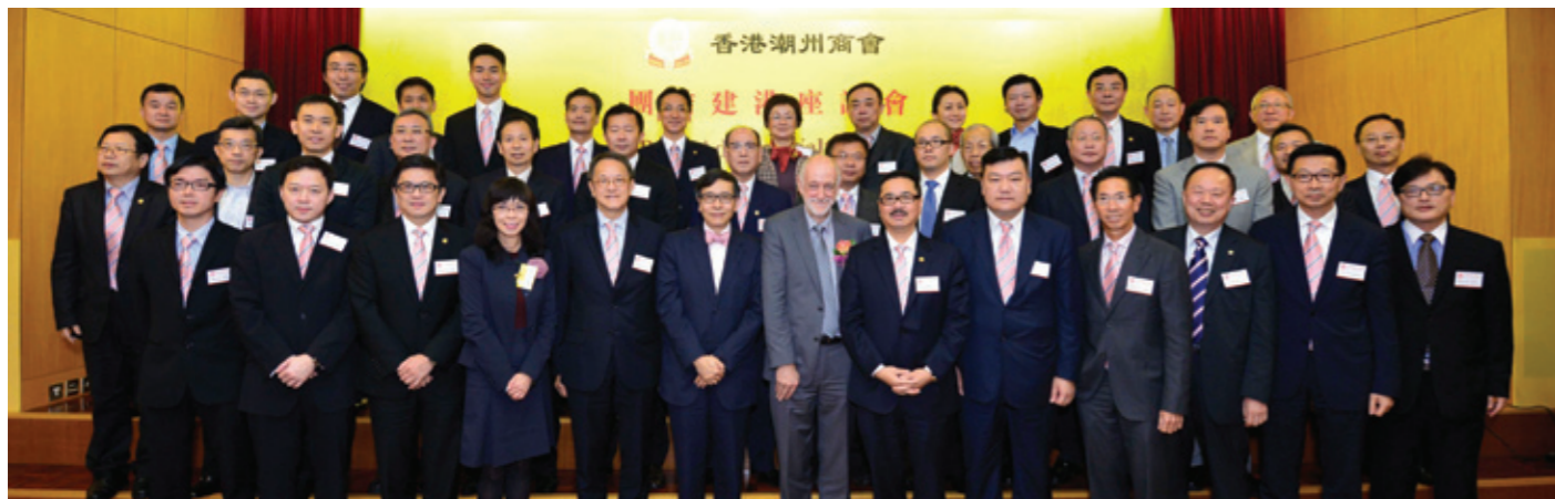
▲ 出席團結建港座談會嘉賓與首長會董合照。

本會3月26日於會所大禮堂舉行了第6場「團結建港」座談會，邀請香港演藝學院華道賢校長到會，與會董及同仁分享他出任校長的心得體會，對培養香港演藝界人才的期盼，以及如何提高香港演藝的專業性及實用性。