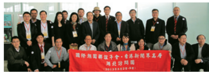
▲ 香港新聞界高層湖北訪問團出發前在香港機場合影。

「第17屆國際潮團聯誼年會」籌委會於5月3日上午在湖北省政府新聞中心舉行新聞發佈會。年會常設秘書處邀請30多位香港媒體高層前往參加新聞發佈會並赴鄂參觀考察。