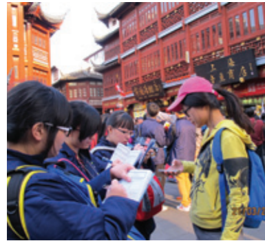
▲ 努力完成考察任務，訪問遊客。

為加深同學對國家文化及內地升學與就業的認識，學校為中四全級同學舉辦《閩南文化考察與內地升學體驗之旅》。同學參觀華僑大學，了解國內大學收生要求、科系、費用及就業前景等，為前途作較全面的規劃。同學參觀田螺坑土樓，從歷史角度認識土樓文化遺產，加深對福建本土歷史文化的認識，更可從藝術角度欣賞土樓建築藝術風格。