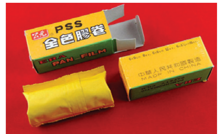
▲ 當年公元廠出品的產品。