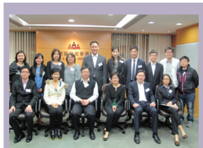
▲ 青委代表出席中西區青少年反吸毒社區計劃——Teen生我才——生命師傅答謝晚會。