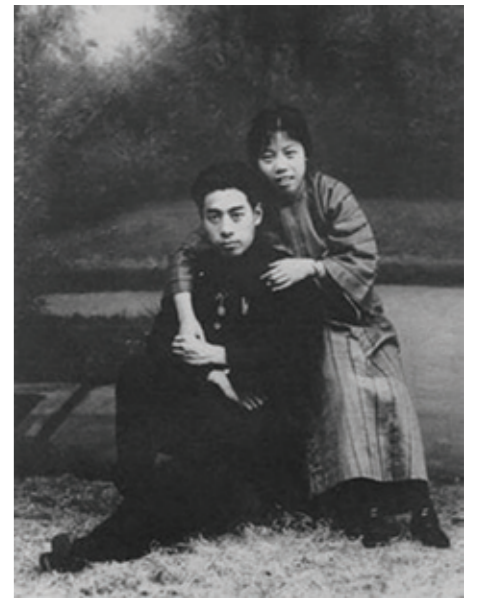
▲ 1926年鄧穎超與周恩來在汕頭。

同年，在鄧大姐的推動下，國民黨汕頭市黨部同意開辦婦運訓練班，市婦協馬上從各方面挑選了30名婦女骨幹參加。2月25日訓練班開始，由吳文蘭主持。國民黨左派人士李春濤等人還到婦運班講課。2月29日汕頭婦協組織