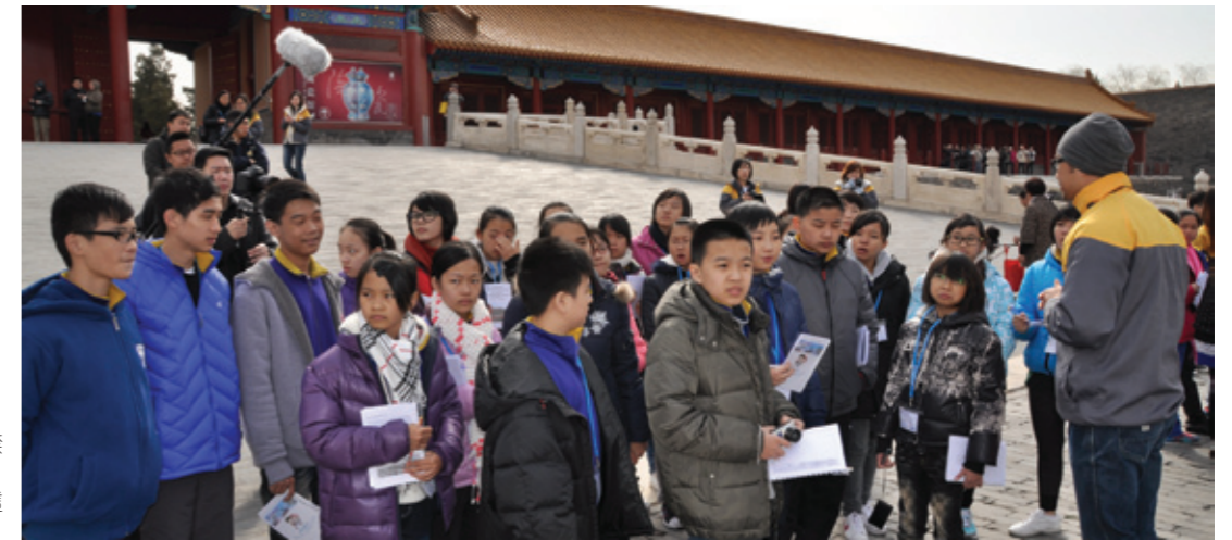
▶ 我們在〔我的家在紫禁城〕工作團隊的帶領下，一同以多角度感受故宮這座獨特的建築群。