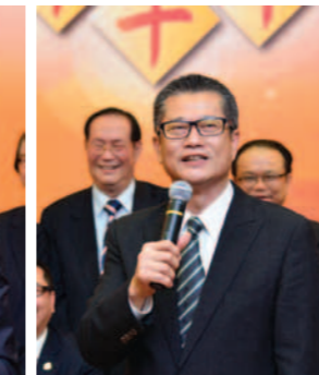
▲ 發展局局長陳茂波致辭。