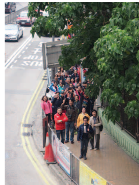
▲ 嘉賓和校長帶領大家從薄扶林道校舍正門出發。