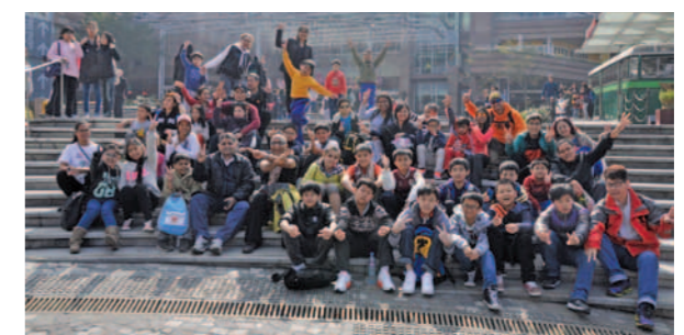
▶ 大家步行約一個半小時，到達終點 - 山頂廣場。