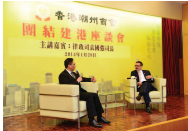
▲ 周振基會長(右)與袁國強司長(左)對談。

本會1月28日於會所大禮堂舉行第15場「團結建港」座談會，邀請律政司袁國強司長到會。袁國強司長是資深大律師，2012年7月1日獲委任為律政司司長，加入政府前為執業大律師，專注處理商業糾紛，曾擔任國際仲裁的仲裁員及商業糾紛的調解員。袁國強司長對香港有十分濃厚的感情，會董及同仁十分高興有機會分享他在香港律政事務工作中取得的成就和心得體會。