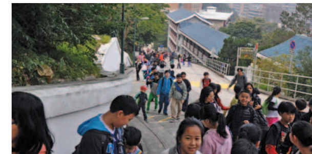
▲ 參加者途經香港大學宿舍。