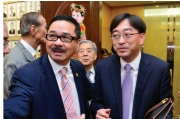
▲ 周振基會長(左)迎候高永文局長(右)。