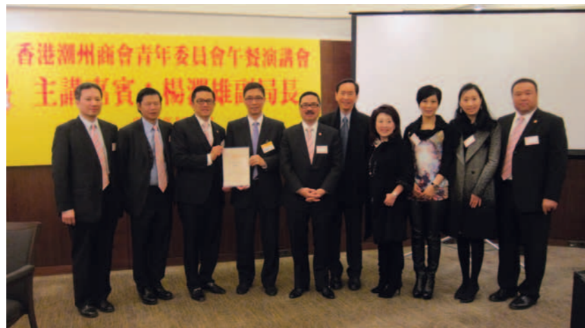
▲ 致送感謝狀予教育局副局長楊潤雄（左四）。

青年委員會第11屆第17次例會1月10日於香港吳臣道1號1字樓香港會夏慤房舉行，香港教育局副局長楊潤雄擔任此次午餐會主講嘉賓。楊副局長以「香港教育當前的挑戰」為題，簡介香港的教育現狀；圍繞「究竟香港的教育制度是好是壞？」，「甚麼才是理想的教育制度？」，「如何提升社會對本地教育制度的信心？」三大問題，與本會委員共同探討當前香港教育面臨的機遇與挑戰。