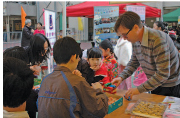
▲ 本校英文科老師帶領本校同學負責英文科攤位遊戲。

2014年1月28日，本校應邀參與馬鞍山聖約瑟小學的綜合學科展。本校中文科及英文科為此舉辦了兩項攤位遊戲，甚受該校學生歡迎。