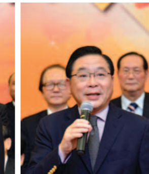
▲ 行政立法兩會議員林健鋒致辭。