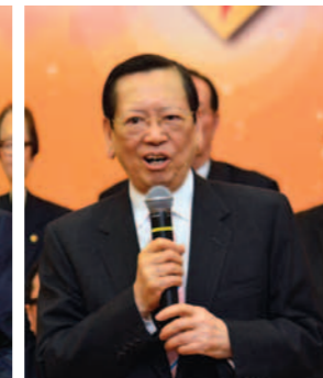
▲ 全國僑聯副主席陳有慶致辭。