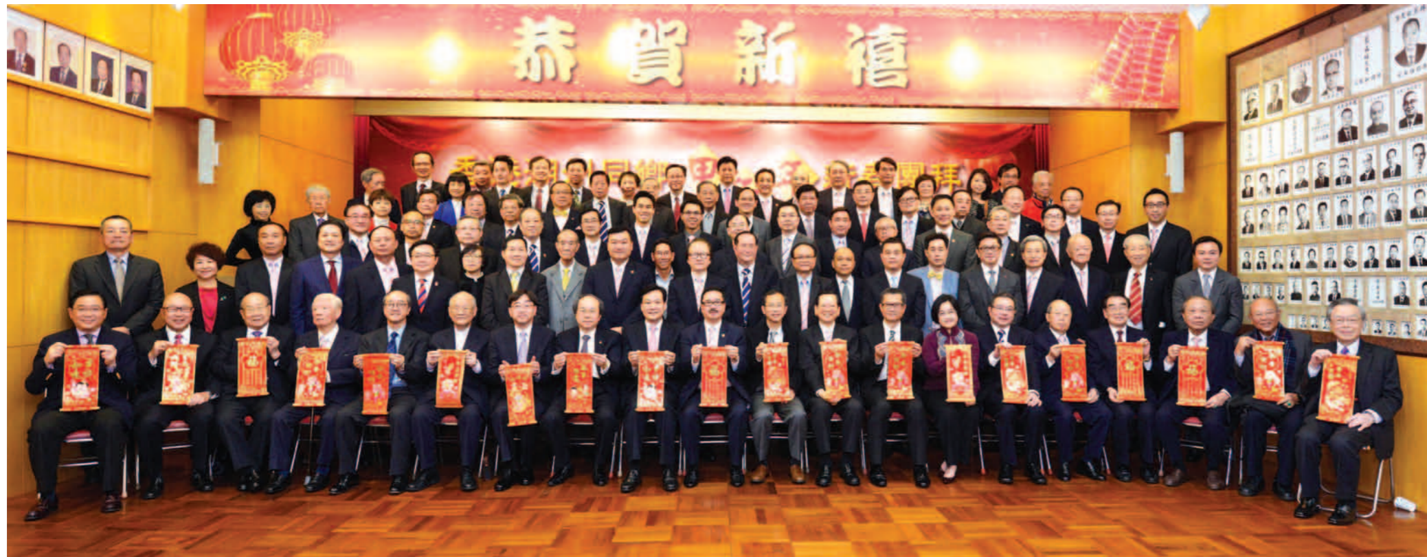
▲ 賓主同向全港潮籍鄉親拜年。