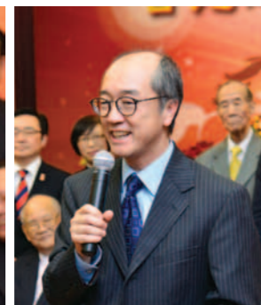
▲ 香港科技大學校長陳繁昌致辭。