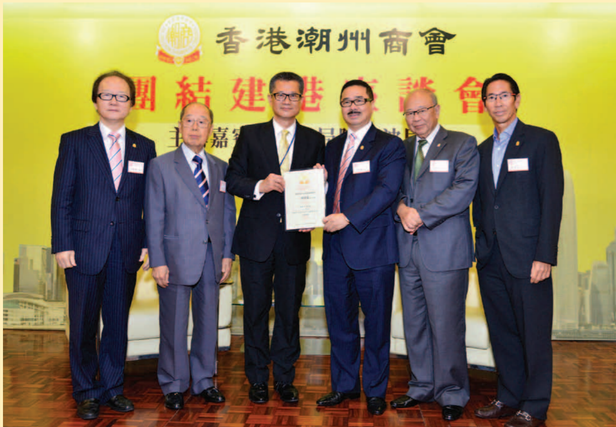
▲ 本會首長向陳茂波局長頒發紀念狀(左起：張成雄、蔡衍濤、陳茂波、周振基、藍鴻震、陳智文)。