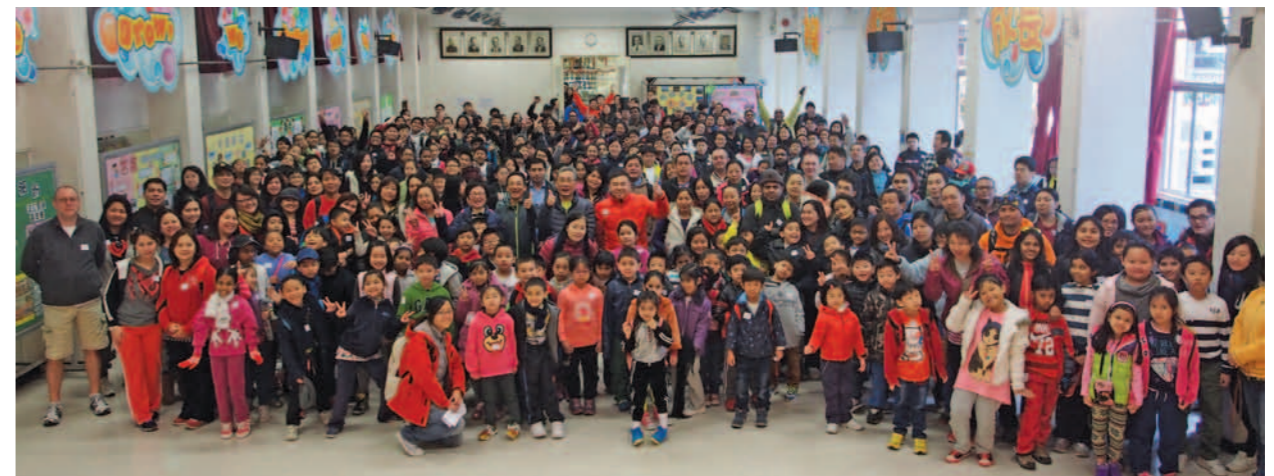
▲ 參加者及嘉賓齊來大合照。