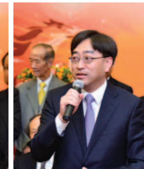
▲ 食物及衛生局局長高永文致辭。