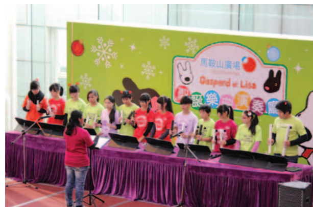
▲ 本校手鐘班在馬鞍山廣場表演。

「聖誕頌歌節」是由九龍倉集團「學校起動計劃」提供，由本校K-POP流行舞蹈團、手鐘班及合唱組負責表演。內容包括「聖誕及新年歌曲手鐘演奏」、「中英文聖誕及新年歌曲演唱」及「K-POP流行舞蹈」表演。是次表演，除讓同學有機會服務社區外，更讓同學增加演出機會、磨練演奏、演唱及跳舞技巧，並提升同學的合作精神。