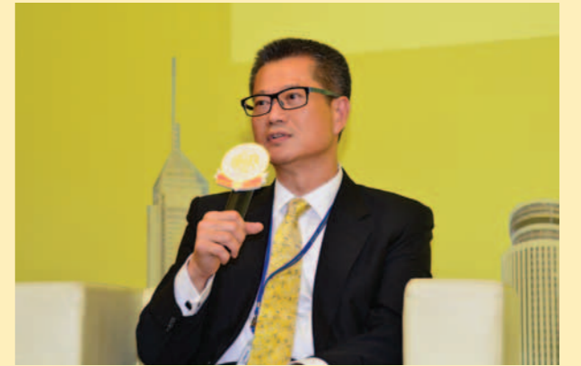
▲ 發展局陳茂波局長演講。

陳局長說，進入政府工作之後，對公務員的工作有了更深切認識和體會。覺得公務員都非常用心工作，可能商界覺得公務員很準時下班，其實不是這樣，每個部門都有自己的政策範疇，有時候不是想做就能做，牽涉到資源配套的問題。政府各部門之間的溝通，雖然不是經常都非常順利，但起碼政府提供了一個平台讓各部門溝通協作，如果各部門