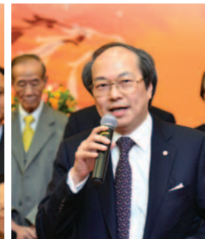
▲ 全國政協常委戴德豐致辭。