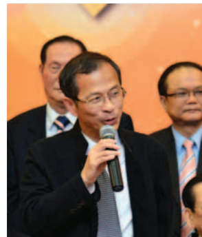
▲ 立法會主席曾鈺成致辭。