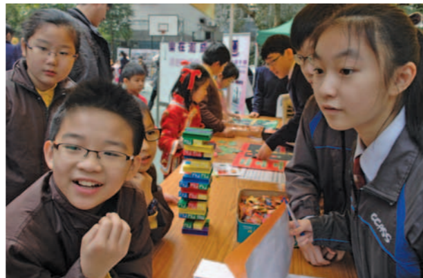
▲ 小學生對本校負責的遊戲活動甚感興趣。