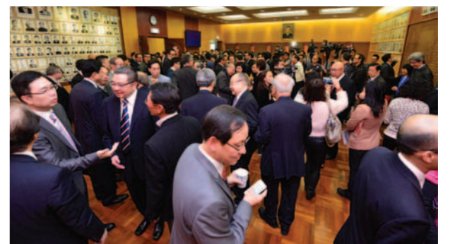
▲ 春風得意，潮人歡騰。