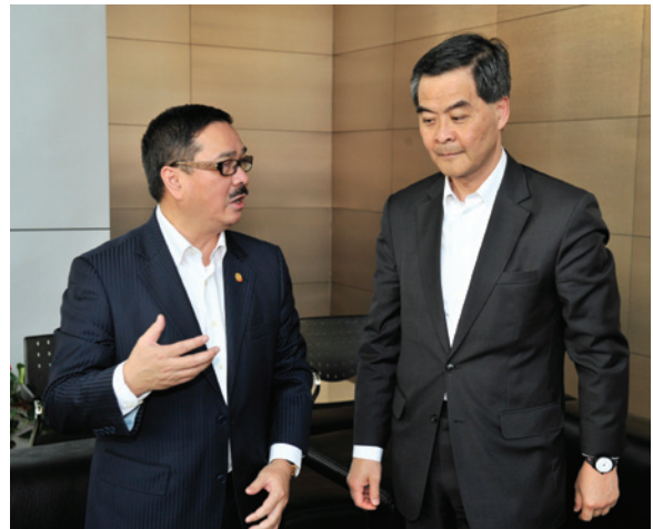
▲ 周振基會長（左）向特首梁振英（右）介紹汕頭駿碼科技集團。