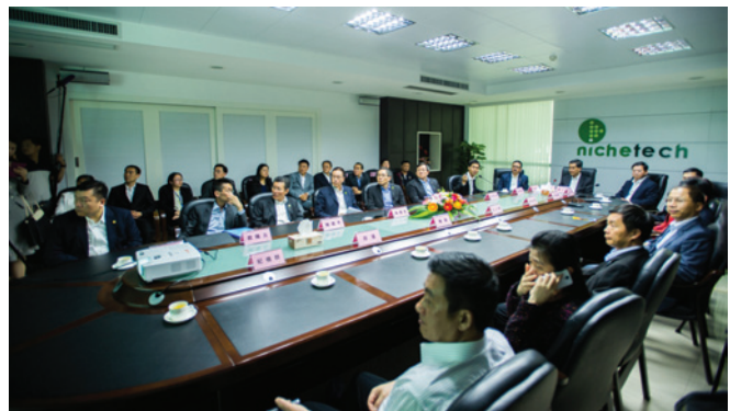
▲ 特首梁振英在周振基會長及周博軒陪同下，觀賞汕頭駿碼科技集團的發展歷程短片。