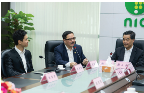
▲ 特首梁振英（右1）親切詢問駿碼科技集團的發展情況。