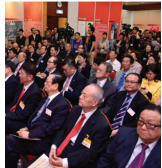
開幕儀式隆重熱烈。