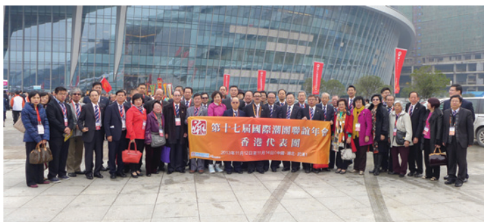
▲ 香港代表團攝於大會會場外。