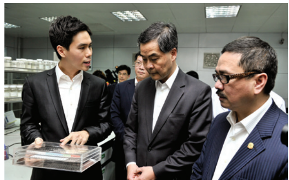
▲ 周振基會長（右）、特首梁振英（中）聽取周博軒（左）介紹新科技產品。