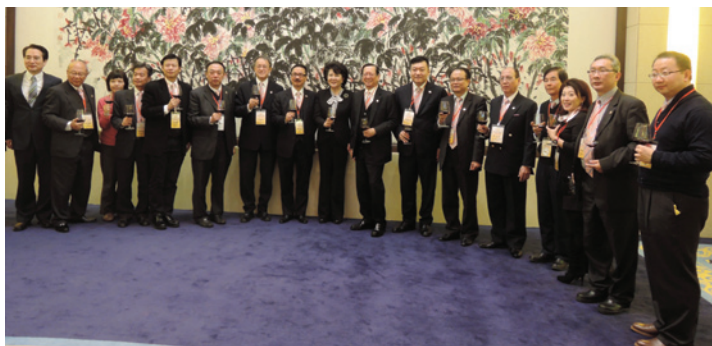
▲ 裘援平（左9）、譚天星（左1）於釣魚台國賓館宴請訪問團。