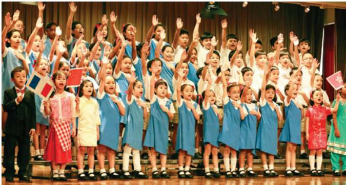
▲ 校慶主題曲大合唱。