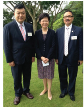
▲ 周振基會長（右）、胡劍江副會長（左）與政務司司長林鄭月娥（中）合照。