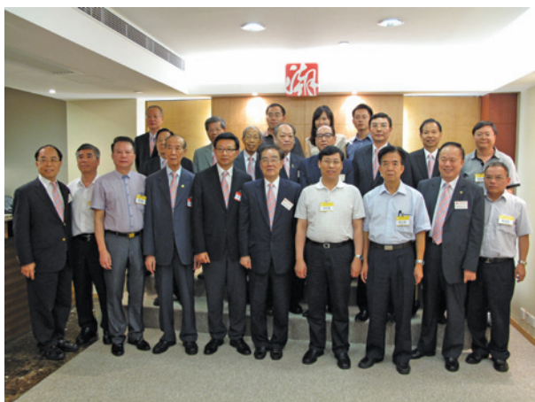
▲ 與上海考察團合照。

由上海市浦東新區副書記吳信寶率領的上海浦東新區現代服務業考察團2012年9月14日到訪香港潮州商會。2010年，上海浦東新區政府與香港潮州商會及上海潮汕商會簽署了戰略合作協議，浦東新區十分重視三方的合作關係，這次到訪為了通報浦東的經濟轉型，爭取香港潮商更大步伐走進浦東，共同把浦東這塊「餅」做大做強。