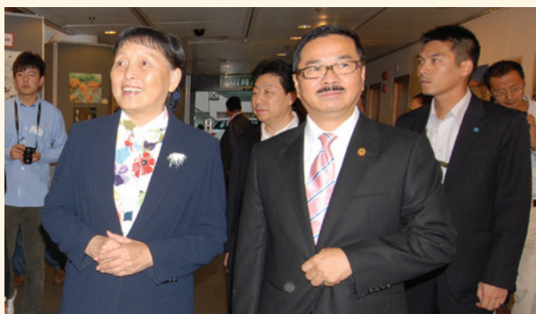
▲ 周振基會長陪同全國政協副主席張梅穎參觀紫荊盃兩岸四地學生書畫作品展，香港潮州商會為該活動協辦單位之一。