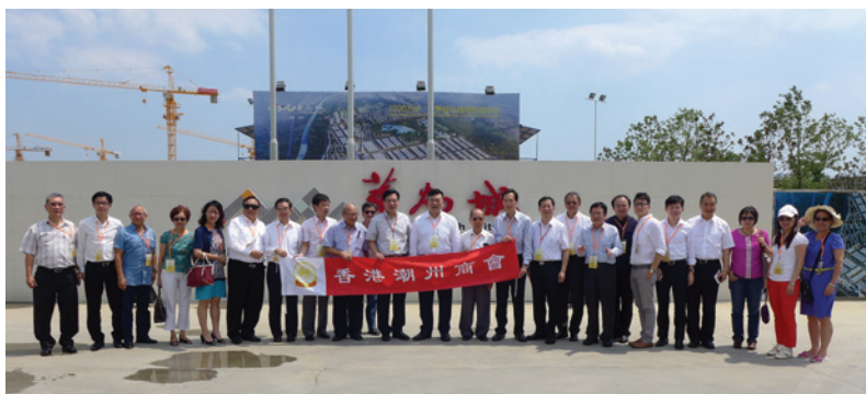
▲ 訪問團考察潮商投資之合肥華南城項目。