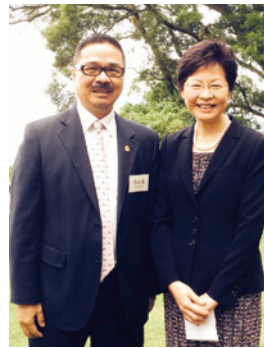
▲ 周振基會長（左）與政務司司長林鄭月娥（右）合照。