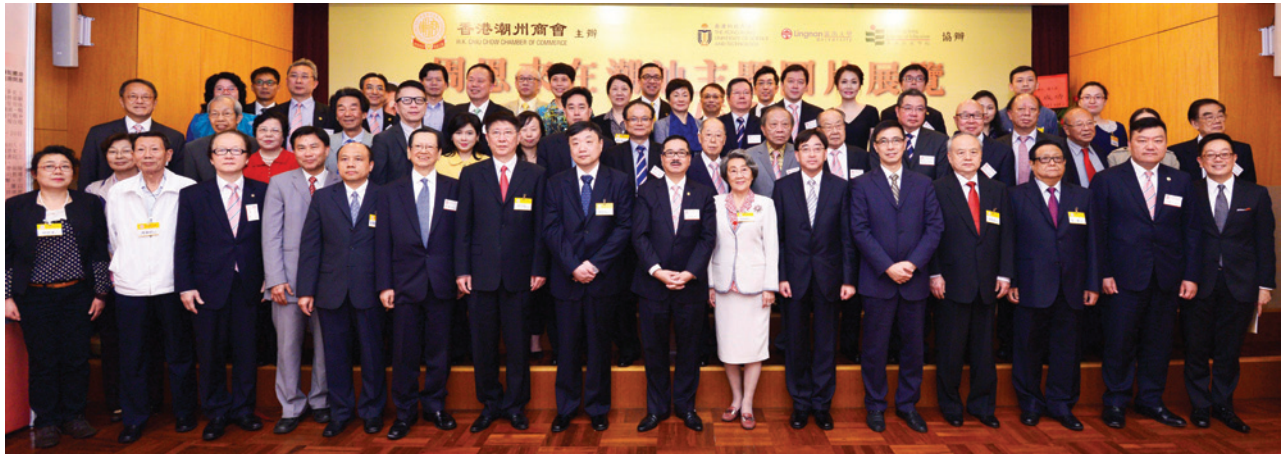
▲ 主禮嘉賓與本會同仁合照。