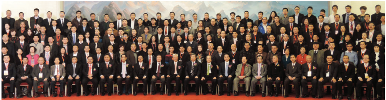
▲ 2013第二屆天下潮商經濟年會，與會嘉賓大合照。