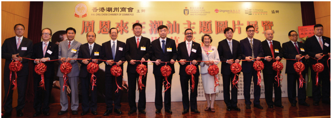
▲ 主禮嘉賓與本會會長、副會長主持剪綵儀式。

周恩來一生為國為民，廉潔奉公，鞠躬盡瘁，被稱為人民的好總理，成為廣大民眾心目中的典範。為紀念周恩來誕辰115周年，香港潮州商會主辦「周恩來在潮汕」大型專題圖片展覽，4月25日舉行隆重的開幕典禮。周恩來姪女周秉德，中共中央文獻研究室副主任張宏志，中聯辦港島工作部部長吳仰偉，中國僑聯副主席陳有慶，教育局局長吳克儉，食物及衛生局局長高永文，嶺南大學校長鄭國漢，中央警衛局原副局長高振普少將，周恩來秘書、武警指揮學院原副院長紀東少將等擔任主禮嘉賓。展覽在潮州商會展出一個月之後，還在嶺南大學、香港教育學院及香港科技大學巡回展出。