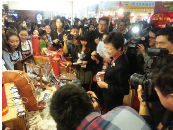
▲ 主禮嘉賓林鄭月娥司長蒞臨攤位。

九龍倉「學校起動計劃」於荷里活廣場舉行2013新春喜盈「營」年宵會，讓同學全面體會創業營商之道。潮州會館中學學生會及經濟科同學合作，協力籌辦「潮之手作」攤位，銷售手作皮具和飾物。參與同學藉此機會實踐課堂所學，體驗創作和銷售的寶貴經驗。