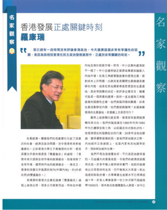
▲ 羅康瑞談香港發展。