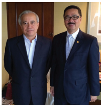
▲ 全國政協副主席、全國工商聯主席王欽敏11月10日在香港接見周振基會長(右)。