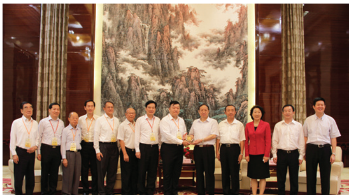
▲ 安徽省省長王學軍（右5）、安徽省政協主席王明方（右4）、安徽省副省長花建慧（右3），會見胡劍江（右6）為團長、林武（右7）為榮譽顧問的香港潮州商會訪問團。