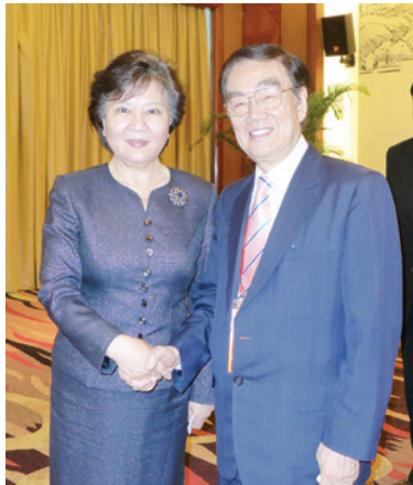
▲ 許學之永遠榮譽會長與裘援平主任合照。