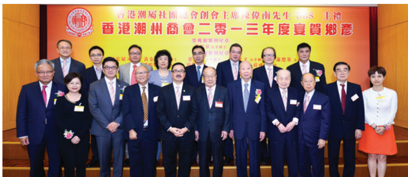
▲ 出席賀鄉彥典禮之獲勳鄉彥與首長合照。