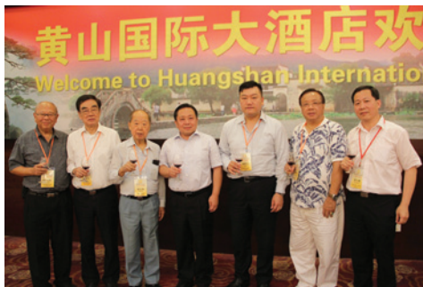
▲ 黃山市委書記王福宏（中）與訪問團成員共進工作晚餐。