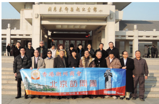
▲ 訪問團參觀位於天津的周恩來鄧穎超紀念館。