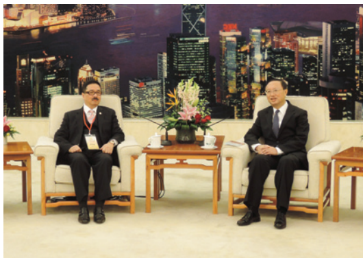
▲ 周振基會長與楊潔篪國務委員（右）對談。

為了凝聚會董、會員及居港潮籍鄉親，維護《基本法》、支持特區政府依法施政，將香港潮州商會打造成為支持香港繁榮穩定的重要力量，由會長周振基博士擔任團長，中聯辦副主任林武為榮譽顧問，吳康民、陳有慶、戴德豐為榮譽團長，藍鴻震、汪正平為名譽團長，馬亞木、朱鼎健、鄭戰良為名譽顧問，谷康生為顧問，張成雄、胡劍江、林宣亮為副團長，以及常董和會董等50人代表團訪問北京。代表團受到國務委員楊潔篪、國務院僑務辦公室主任裘援平和副主任譚天星、中央統戰部副部長林智敏及國務院港澳辦副主任周波等熱情接待。