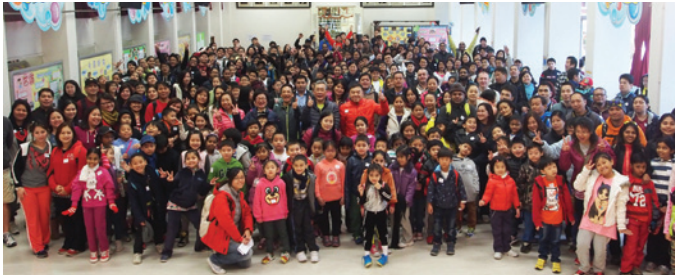
▲ 「學校發展基金」步行籌款參加者合照。