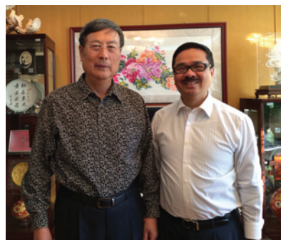
▲ 周振基會長(右)與全國政協前副主席黃孟復合影。