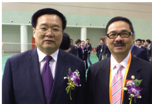
▲ 周振基會長(右)與湖北省王國生省長在第17屆國際潮團聯誼年會開幕式上合照。