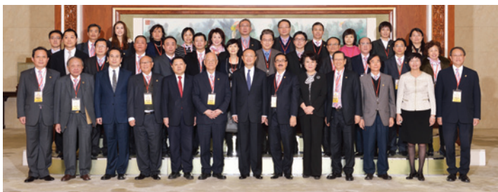
▲ 訪京團於人民大會堂拜會楊潔篪國務委員（前排左7）。