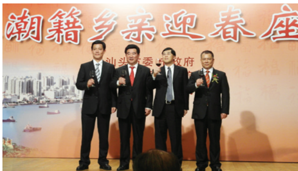
▲ 左起：潮州市市長李慶雄、汕頭市委書記陳茂輝、潮州市委書記許光、揭陽市委常委黃耿城，舉杯同祝香港潮籍鄉親新春宏圖大展。

汕頭、潮州、揭陽三市政府2013年1月24日攜手假香港灣仔君悅酒店舉行「2013年香港潮籍鄉親迎春座談會」。汕頭市委書記陳茂輝、市長鄭人豪，潮州市委書記許光、市長李慶雄，以及揭陽市委常委黃耿城等主要領導，與本港政商界名流和潮籍鄉彥歡聚一堂，敘鄉情友情，迎新春佳節，共謀家鄉發展大計。