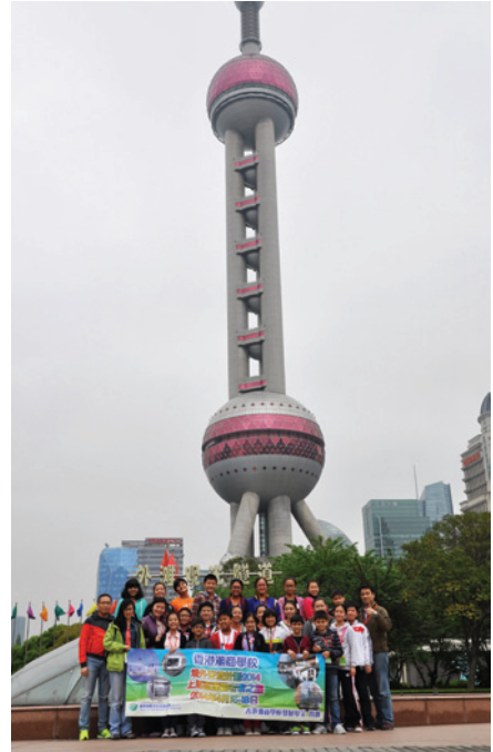
▲ 師生們在東方明珠前合照留念。