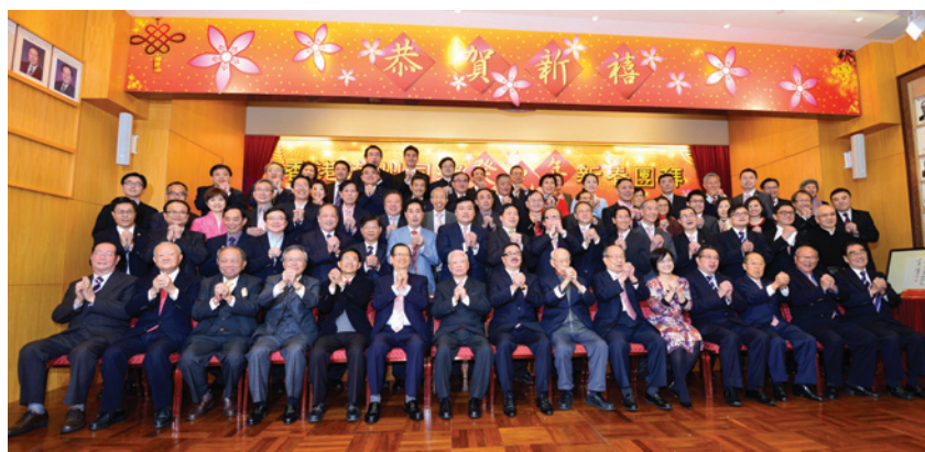
▲ 恭賀新春 萬事如意。