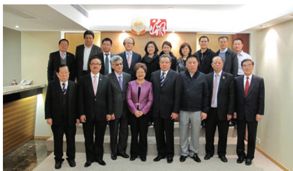
▲ 黃陳小萍部長伉儷（前排左3及4）與潮屬兩會首長合照。

現任加拿大聯邦耆老事務國務部部長黃陳小萍及夫婿黃以諾教授2013年1月8日到訪，受到陳幼南、周振基等首長的熱烈歡迎，雙方進行了親切的交談，特別對加強香港與加拿大潮籍鄉親的交流合作，增進友誼，表示了極大關注和殷切期盼。陪同黃陳小萍部長到訪的有加拿大溫哥華潮州同鄉會會長林少毅伉儷、副會長陳楚宏伉儷、秘書長方耀明。