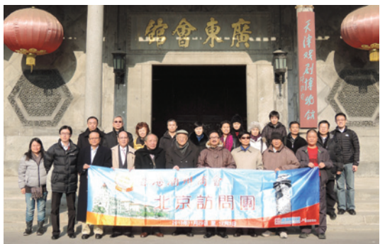
▲ 訪問團參觀位於天津的廣東會館。