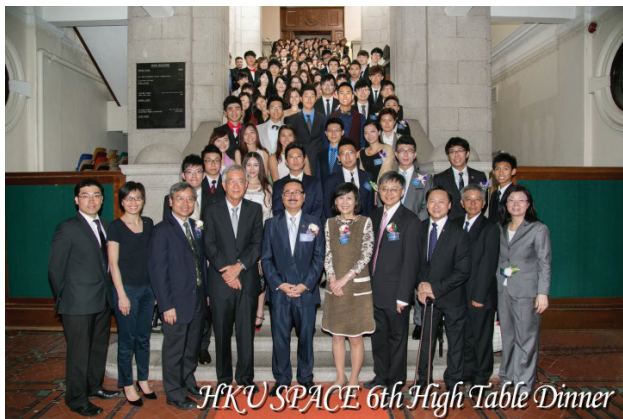
▲ 高桌晚宴全體出席者合照。

大的傳統，各學院，hall學校，各社團都會舉辦，大家可以藉此高桌晚宴認識不同的人，會邀請名人任嘉賓並演講，是港大的特色。