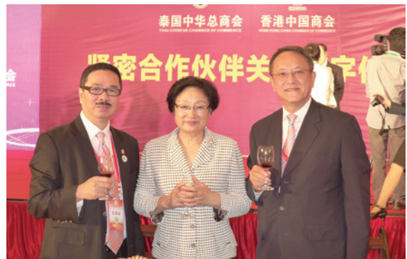
▲ 周振基會長（左）、林宣亮副會長（右），與全國政協副主席李海峰（中）合照。