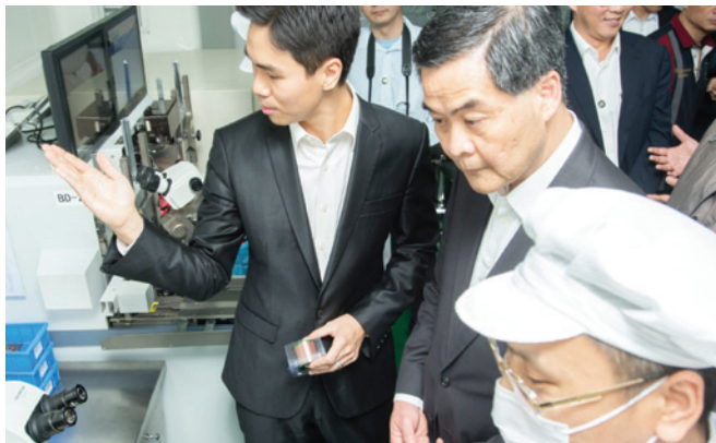
▲ 特首梁振英興致勃勃參觀汕頭駿碼科技集團。