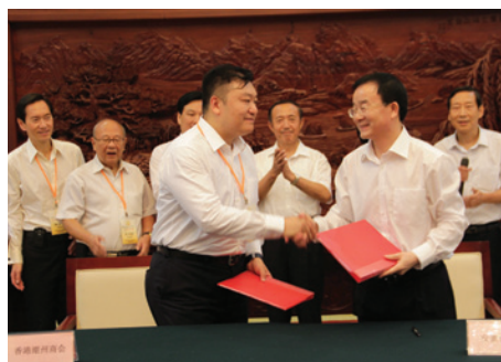
▲ 安徽商務廳長曹勇（右）和胡劍江團長簽署合作協議。