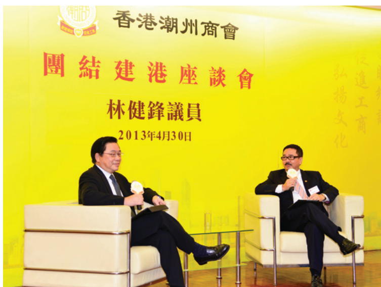
▲ 周振基會長（右）與林健鋒議員對談。

第7場「團結建港」座談會2013年4月30日舉行，邀請香港行政會議成員、立法會議員林健鋒到會。林議員於香港出生，是第12屆港區全國人大代表，曾任公職包括：盛事基金評委會主席、西九文化區管理局董事局成員、公務員薪俸及服務條件委員會成員等。林議員對社會政治經濟事務十分熟悉，對香港有着十分濃厚的感情。會董及同仁十分高興有機會分享他從政從商的心得體會。