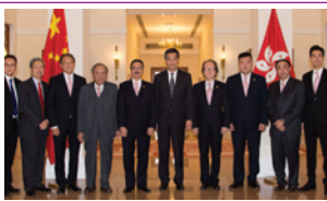
特首梁振英宴請本會首長