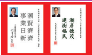
宴賀榮任六大慈善團體要職鄉彥 （2014年）