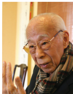
饒宗頤 教授 GBM