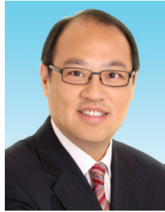
林大輝 博士 SBS BBS 太平紳士