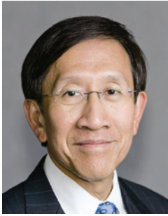
方正 GBS SBS 太平紳士