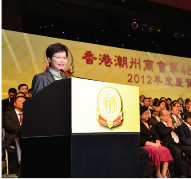
▲ 政務司林鄭月娥司長致辭。