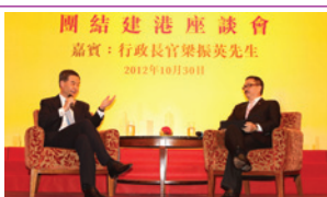
第48屆會董會創辦「團結建港」座談會