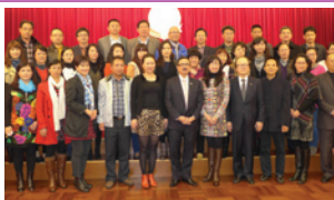
接待廣東社會組織總會考察團