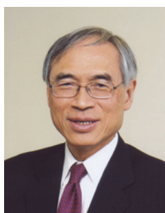
劉遵議 教授 GBS 太平紳士