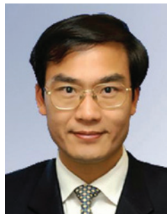
林順潮 教授 太平紳士