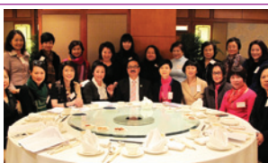
首屆婦委成立及舉行第一次會議