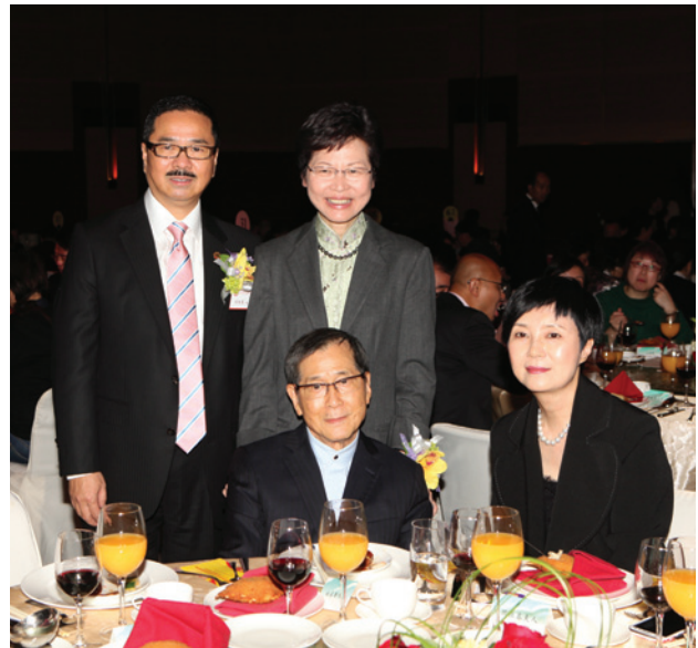
▲ 周振基會長（後排左1）和夫人（前排左2）陪同林鄭月娥司長（後排左2）探望粵劇表演藝術家林家聲（前排左1）。