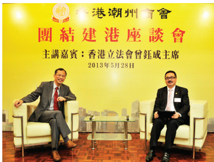
▲ 周振基會長（右）與曾鈺成主席對談。

第8場「團結建港」座談會2013年5月28日舉行，邀請立法會主席曾鈺成到會。曾鈺成的民意認受度甚高，對社會政治事務十分熟悉，他高興地為會董談了有關行政與立法兩者關係的看法和見解，令大家對立法會運作有了全新的認識。曾鈺成肯定潮州商會是一個愛國愛港的優秀社團，一向支持特區政府依法施政。周振基會長感謝曾鈺成主席百忙之中為首長、會董介紹香港的最新政治形勢。