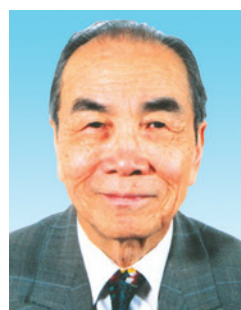
黃麗松 教授 CBE 太平紳士