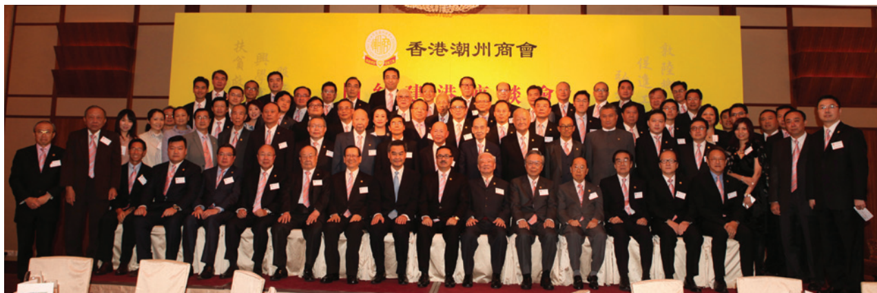
▲ 特首梁振英出席首次「團結建港」座談會，賓主大合照。