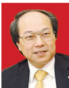
戴德豐 博士 GBS SBS 太平紳士