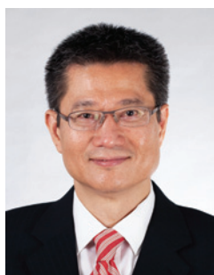
陳茂波 MH 太平紳士