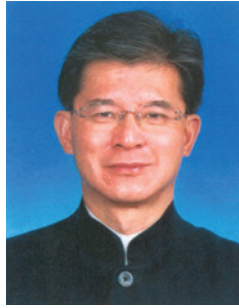
羅康瑞 GBS 太平紳士