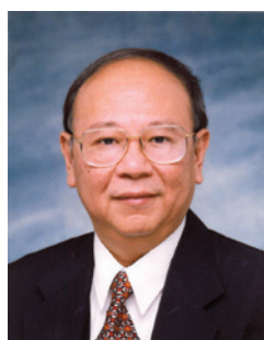
藍鴻震 GBS 太平紳士