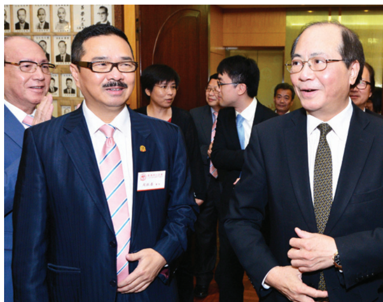
▲ 周振基會長(左)迎接吳克儉局長到會。

第21場「團結建港」座談會2014年7月29日舉行。邀請教育局吳克儉局長到會。周振基會長熱烈歡迎吳克儉局長蒞會，感謝吳局長為潮州商會首長、會董介紹香港的教育情況和發展前景。吳局長首先對香港教育局培養新一代的夙願作了作了簡單扼要又全面的介紹，同時對潮州商會一直以來支持教育局推動教育事務表示讚賞，他對有機會到潮州商會，與眾多潮籍商界精英切磋交流教育政策和前景深感鼓舞。參加座談會的會董及同仁十分高興有機會分享吳局長在教育工作中取得成就的心得體會。