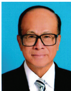
李嘉誠 博士 GBM 太平紳士