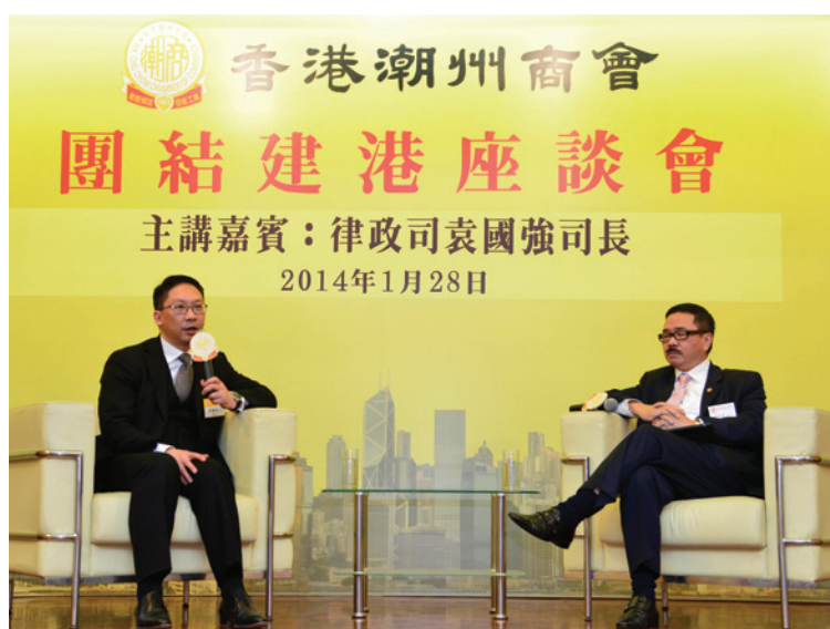
▲ 周振基會長（右）與袁國強司長對談。

第15場「團結建港」座談會2014年1月28日舉行，邀請律政司袁國強司長到會。袁國強司長是資深大律師，2012年7月1日獲委任為律政司司長，加入政府前為執業大律師，專注處理商業糾紛，曾擔任國際仲裁的仲裁員及商業糾紛的調解員。袁國強司長對潮州商會一直以來支持特區政府依法施政表示讚賞，希望在香港2017年普選特首上多以書面表達意見，為香港普選出一位既符合基本法，又符合全國人大常委會決定的特首給商界樹立榜樣。