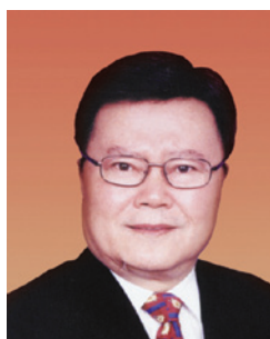
馬介璋 博士 SBS BBS