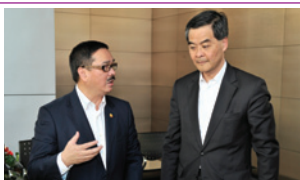
特首梁振英視察汕頭駿碼科技集團