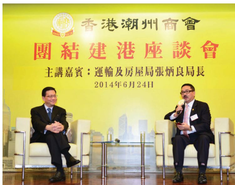
▲ 周振基會長（右）與張炳良局長對談。

第20場「團結建港」座談會2014年6月24日舉行，邀請運輸及房屋局張炳良局長到會。張炳良局長獲頒金紫荊星章，也是太平紳士，2012年6月之前為香港教育學院校長暨公共行政學講座教授，2008年之前為香港城市大學公共及社會行政學系教授，1995年至1997年曾任立法局議員。張局長致力香港運輸及房屋事務，會董及同仁分別就運輸及房屋方面的問題，包括鐵路、巴士、隧道以及公屋等與張局長切磋。張局長讚揚潮州商會是一個有份量的愛國愛港社團。