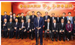
甲午年潮州同鄉新春團拜