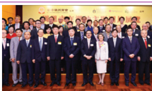
舉辦「周恩來在潮汕」大型專題圖片展覽