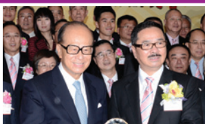
第48屆會董隆重舉行就職典禮