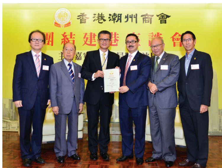
▲ 本會首長向陳茂波局長頒發紀念狀（左起：張成雄、蔡衍濤、陳茂波、周振基、藍鴻震、陳智文）。

第10場「團結建港」座談會2013年7月30日舉行，邀請發展局局長陳茂波到會。陳局長積極推動特區政府新界東北發展計劃，為市民創造更多良好的居住條件。陳局長就任以來，選擇迎難而上，為香港未來發展努力奮鬥的精神獲得同仁讚賞和支持。陳局長勇於任事，對推動本港發展政策不遺餘力，面對風波不退避，不卸責，值得肯定，這種奮鬥精神令大家十分敬佩。