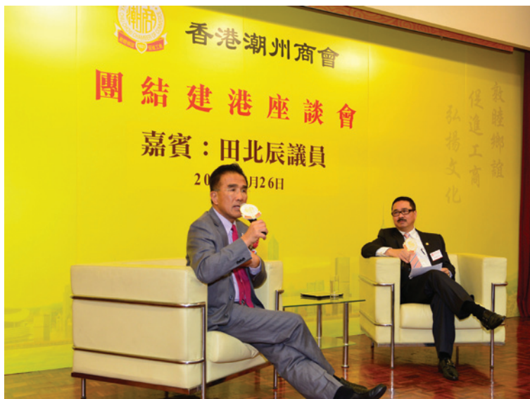
▲ 周振基會長（右）與田北辰議員對談。

第5場「團結建港」座談會2013年2月26日舉行，邀請香港立法會議員田北辰到會。田北辰於香港出生，是第12屆港區全國人大代表，立法會議員。他曾任公職包括：九廣鐵路公司管理局主席、語文教育及研究常務委員會主席、僱員再培訓局主席等等，涉及廣泛的社會政治經濟事務。他對香港潮州商會懷有深厚的感情，知道是一個愛國愛港愛鄉的優秀社團，期望潮州商會繼續支持特區政府依法施政，為國家和香港出力。