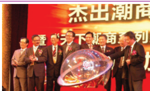
出席第二屆天下潮商經濟年會