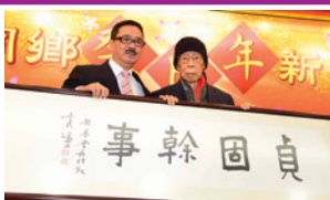
癸巳年潮州同鄉新春團拜