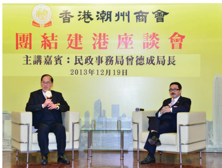
▲ 周振基會長（右）與曾德成局長對談。

第14場「團結建港」座談會2013年12月19日舉行，邀請民政事務局曾德成局長到會。曾德成局長2007年7月1日獲委任為民政事務局局長。他曾於1998年7月至2007年6月出任中央政策組全職顧問，加入政府前從事新聞工作接近30年，曾經獲選為第七屆至第十屆全國人民代表大會代表。曾局長對香港有十分濃厚的感情，會董及同仁十分高興有機會分享他在民政事務工作中取得的成就的心得體會。