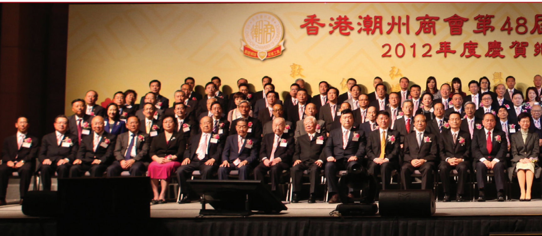
▲ 第48屆會董就職典禮暨慶賀鄉彥聯歡晚會賓主大合照