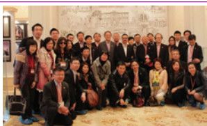
癸巳年新春行大運