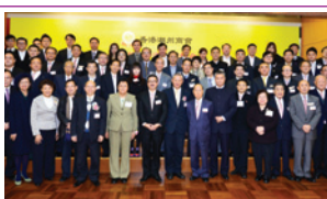
港區全國人大代表候選人介紹會