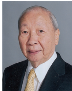
黃松泉 SBS BBS MBE 太平紳士