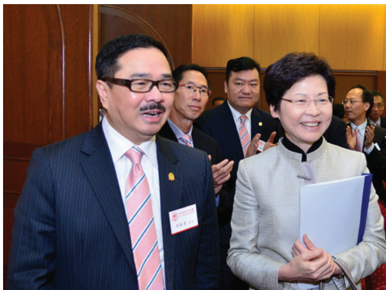
▲ 周振基會長（左）迎接林鄭月娥司長到會。

第17場「團結建港」座談會2014年3月25日舉行，邀請政務司司長林鄭月娥到會。周振基會長對林鄭月娥司長蒞會表示熱烈歡迎，他感謝司長百忙之中為本會首長、會董介紹關於香港2017年行政長官及2016年立法會選舉產生辦法。林鄭月娥司長對本會一直以來支持特區政府依法施政表示讚賞。她表示，本會是香港重要的愛國愛港社團之一，希望在香港政改諮詢上多發表意見，共同為推動香港政改獻策出力。