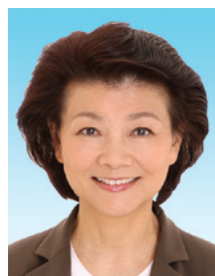
梁劉柔芬 GBS SBS OBE 太平紳士