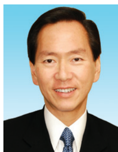
陳智思 GBS 太平紳士