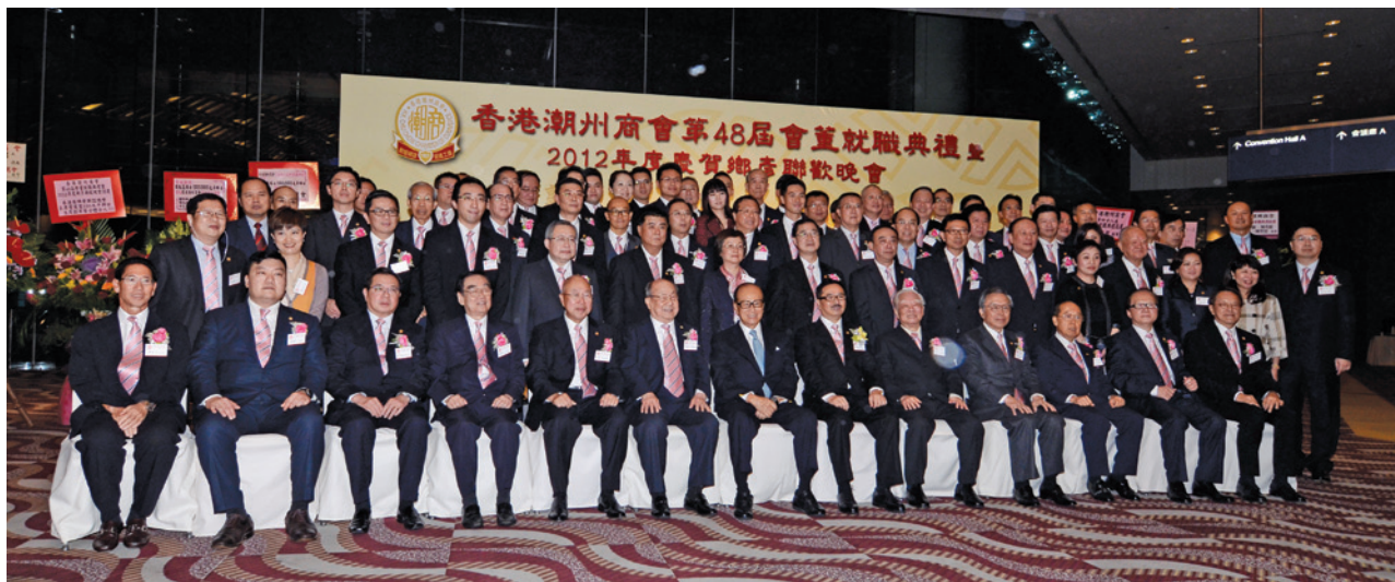
▲ 李嘉誠與第48屆會董會同仁合照。