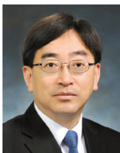
高永文 BBS 太平紳士