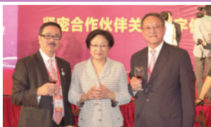
出席第9屆粵東僑博會