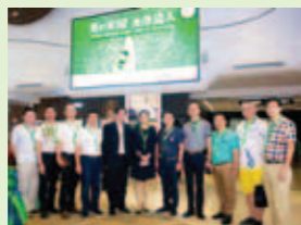
▲ 環保公益綠絲帶行動啟動合照。

環保公益綠絲帶行動以多種系列活動的形式持續開展，包括：舉辦「創意環保公益比賽」、向全市民眾徵集環保主題的創意視頻和平面設計，以此呼籲全民環保意識的崛起。