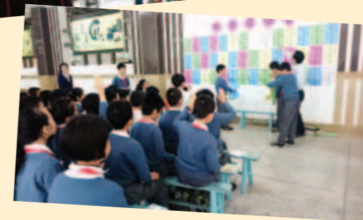
▲ 舞龍、功夫、猜燈謎及皮影戲等傳統藝術成功融入校園生活當中。