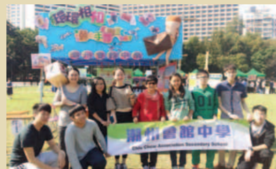
▲ 同學們以「環環相扣~潮之手帶」為題，製作精美皮革飾物，藉此介紹皮革類書籍。

第27屆閱讀嘉年華於11月28日假維多利亞公園中央草坪舉行。當日節目豐富，參加的學校有40多間，場面十分熱鬧。本校圖書館學會以「環環相扣~潮之手帶」為題，利用碎皮製作美觀而實用的匙扣及手帶，介紹皮革類書籍，藉此推動閱讀，攤位亦大受歡迎。