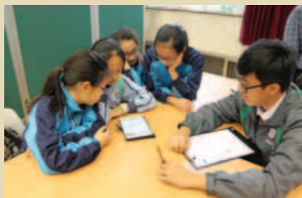
▲ 參賽同學們在「數理比賽」中，全力以赴，表現投入。