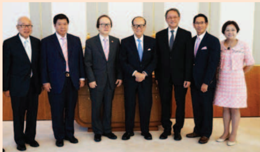
▲ 李嘉誠(右4)、張成雄(左3)，與林宣亮(右3)、陳智文(右2)、黃書銳(左2)、高佩璇(右1)、莊學山(左1)等合照。

李嘉誠博士熱情接待了本會各位首長，與各位首長熱情敘談，並就本會會務發展表示了關注。各位首長對於李嘉誠博士的期望深感欣慰，表