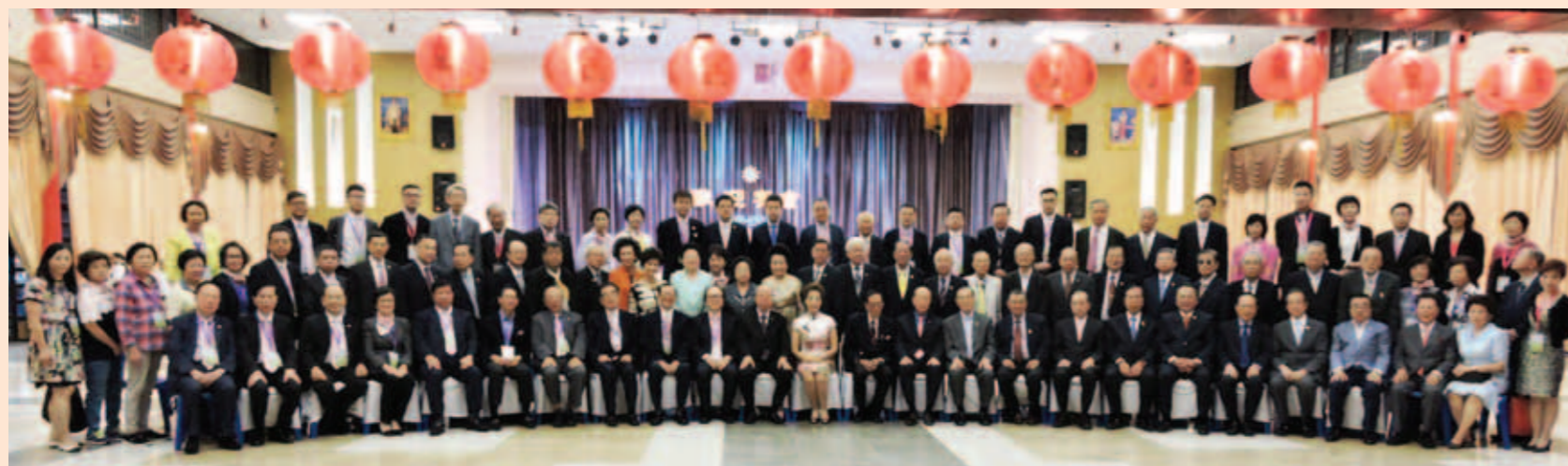
▲ 訪問團全體成員與泰國潮州會館僑領及常務委員合照。

其中有些鄉賢來自馬來西亞之馬六甲、新山或東海岸等地，要開車數小時或坐飛機到達吉隆坡，前來接待香港鄉親。