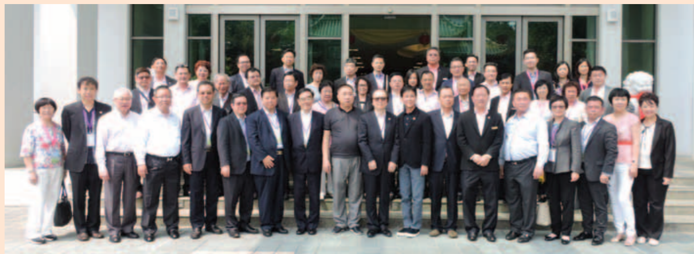
▲ 訪問團成員與新加坡潮州八邑會館首長合照。