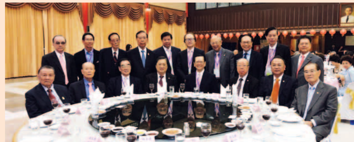
▲ 泰國著名僑領陳有漢博士(前排左4)接待訪問團。