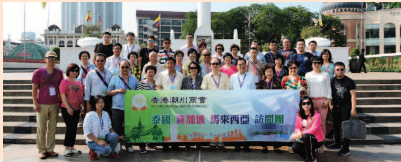
▲ 於吉隆坡獨立廣場大旗桿前合照。

訪問團不少成員，也趁此行和當地鄉親洽商合作，並探討投資的機會。在這次訪問前，本會也專門邀請新加坡駐港總領事蒞會，同會員及代表團成員講解新加坡的商機。