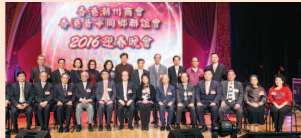
▲ 賓主持迎春晚會開幕典禮。