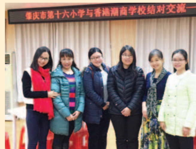
▲ 觀課活動後，與當地中文科老師合照留念。

本校中文科主任及副主任於十二月三日及十二月四日與肇慶市第十六小學中文科老師進行交流活動，並為來年本校小四學生與當地小學生交流前作準備。