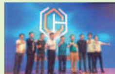
▲ 潮籍精英攜手創「潮創會」。

在「大眾創新、萬眾創業」的新形勢下，首屆潮人創新創業大會隆重舉行，全球潮人創新經濟促進會（「潮創會」）宣告成立。「潮創會」以創新的工作思維，在積極整合人才、資金、項目的基礎上，推動與傳統的工商業界、社團組織以及相關創新領域等各方資源的合作。進一步促進各類技術合作和交流，拓展各類創新產業與專案的融資合作管道，成為凝聚海內外潮人的創新型合作平臺，實現「新經濟、新潮人、新力量」的發展目標。