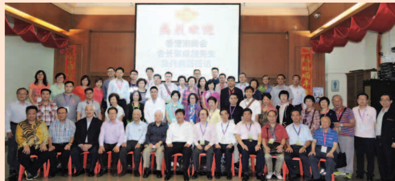
▲ 賓主雙方於馬潮聯會會所合照。