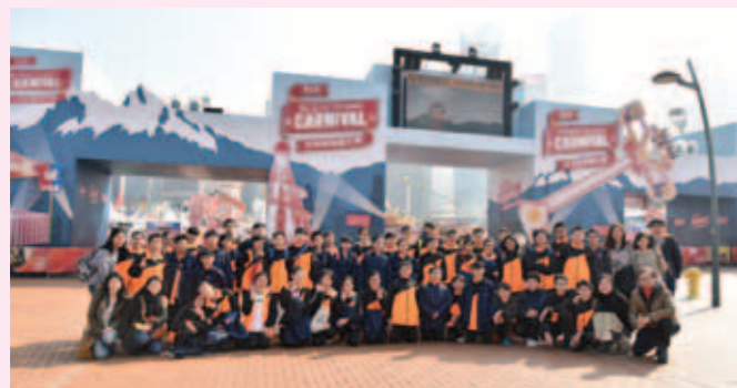
▲ 中一級同學們參觀「歐陸嘉年華」，藉此加強班級的凝聚力。

本校於農曆新年假期安排中一級全體學生參觀「歐陸嘉年華」及登太平山觀賞維港夜景。是次活動不單擴闊學生的視野，並能促進師生的關係。