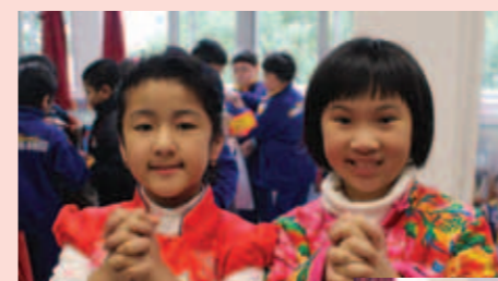
▲ 不同國籍的同學以粵語互送祝福。