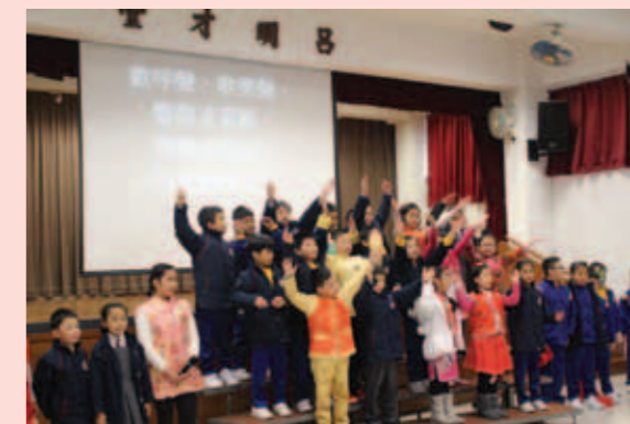
▲ 三年級同學領唱賀年歌。

農曆新年假期後，學校舉行了一年一度的新春團拜活動。當天早上，全校師生齊集禮堂，一起唱賀年歌，欣賞有關農曆新年傳統習俗的短劇，及互相以吉祥的新年賀語，送上祝福。大家喜氣洋洋，整個校園洋溢著濃厚的節日氣氛。