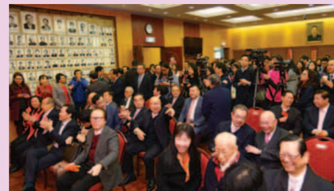
▲ 鄉親團拜，歡樂年年。