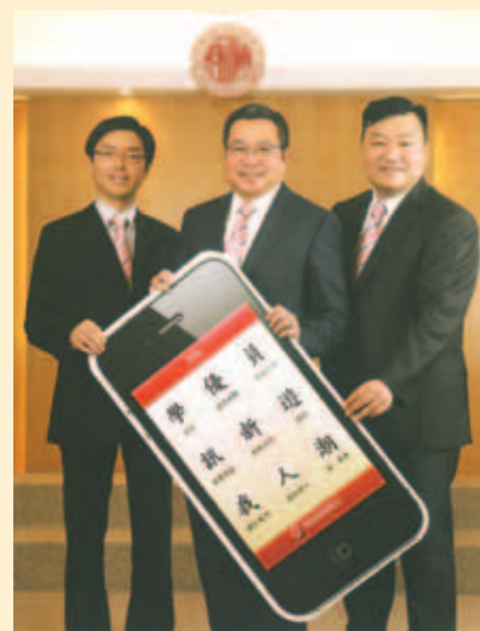
▲ 運用新科技向全球推廣香港潮州商會商務及文化。

「我記得剛進公司時，父親叫我到內地經營鋁廠。我很擔心，說，我們是做金的。父親笑著說：『還不是和做金一樣，戒指是把金拉成條，然後捲起來，做鋁是先將鋁鎔成條，再鑄成管，只不過大一點嘛！』生意上很多事都是觸類旁通，要勇於嘗試，不要自己局限自己。」他說，「許多人問我，現在涉足的事業範圍這麼廣，你是如何規劃的？其實，一切就像『快跑的未必能贏，力戰的未必得勝……臨到眾人的，在乎當時的機會。』又像孫中山先生所說：『順天意、應潮流、順人情。』我就是這樣做而已。」