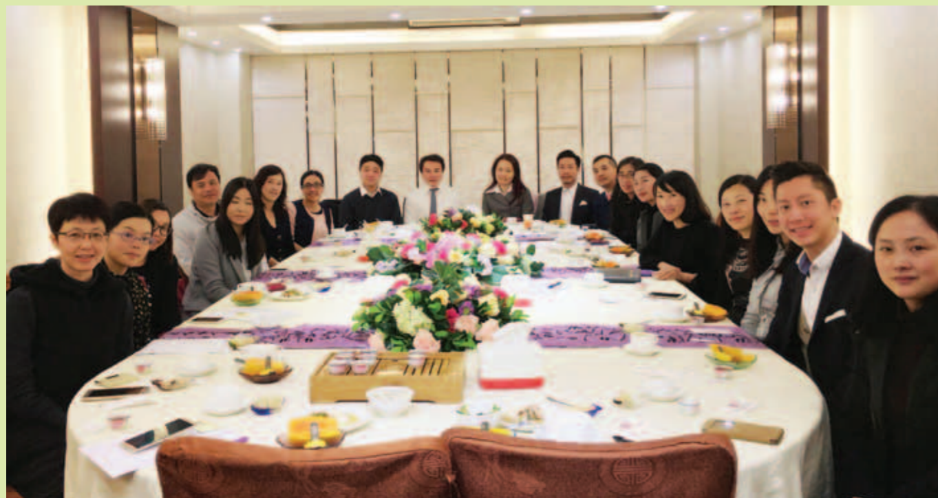
▲ 青年工商界新春聯歡舉行籌備會議。

青年是社會的未來和希望，工商界青年發揮自強不息的精神，履行職責、凝聚力量、創造良好營商環境，支持特區政府依法施政。為進一步加強各商會青委會聯繫，吸納更多年輕人關心祖國，共建香港、共創繁榮，由本港十五家商會青委會合辦的「香港青年工商界新春聯歡晚宴」，2016年3月16日灣仔名爵宴會廳舉行，並邀請特區政府、中聯辦官員、各合辦團體、友好團體首長等嘉賓出席。青委作為今年的承辦機構，為辦好新春聯歡晚宴，主動積極進行籌辦工作，為此，兩次於本會會員俱樂部舉行籌備會議，與