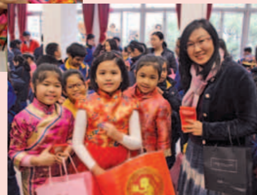
▲ 校長、老師和同學們，預先準備好放有糖果及新年賀詞卡的紅封包，互相交換。