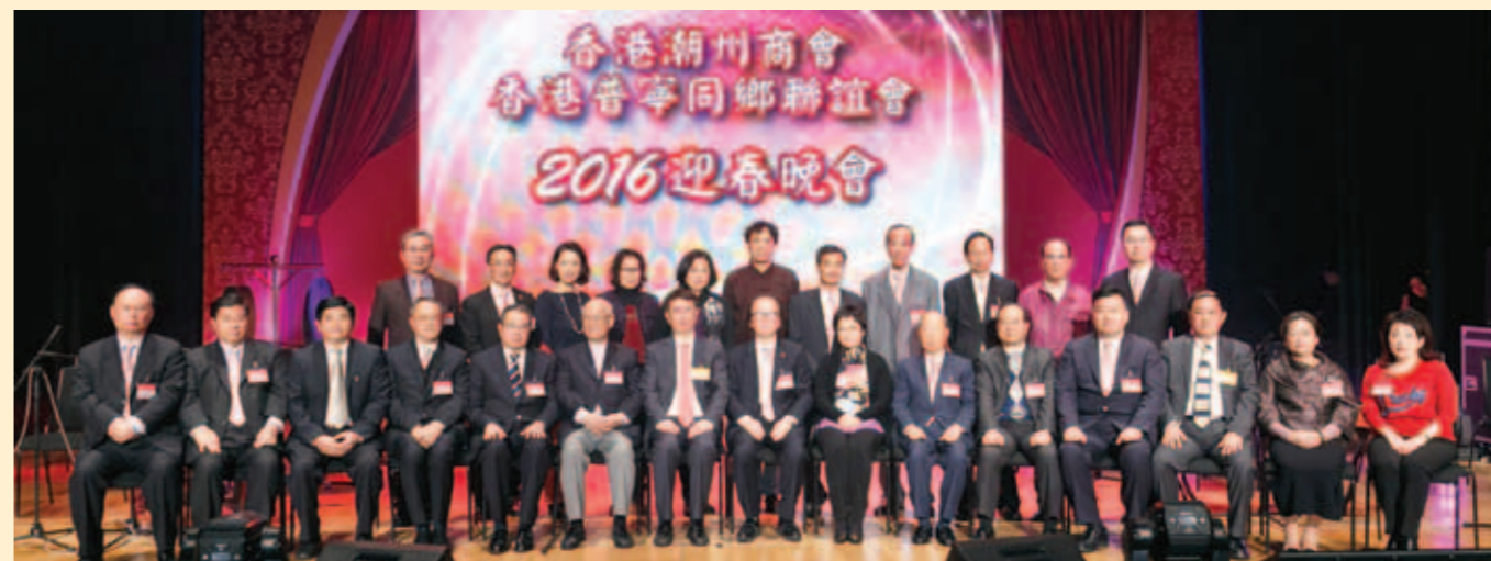
▲ 潮州商會主辦之2016迎春晚會開幕典禮。

潮州人移民香港，開頭只是做些苦力之類的勞工，而且集中在西環一帶。後來也就是開開小店、賣賣鹹魚之類。但今天，在香港工商界執牛耳的潮州人不少。李氏、廖氏、羅氏、馬氏等潮州人，這些大家族都已執香港工商界的牛耳。