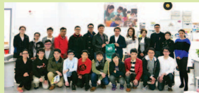
▲ 參觀城市大學應用程式實驗室合照。