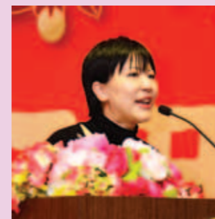
▲ 黃何詠詩專員致賀辭。