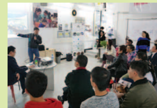
▲ 張澤松博士介紹應用程式。

青委文化創意組與青年議會聯合組織兩會成員及本會青委主辦「青年創新新創比賽2015」的獲獎者，2016年2月20日參觀香港城市大學應用程式實驗室，香港城市大學電子工程學系副教授兼應用程式實驗室總監張澤松博士，介紹該實驗室舉辦有關應用程