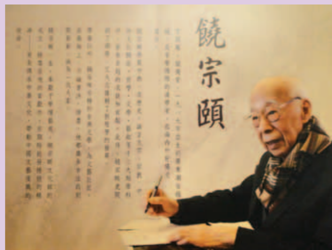
▲ 饒宗頤先生身體力行，實踐個人理念。

關於人生哲學，饒宗頤先生提出了自己的「安頓說」，他認為「一個人在世上，如何正確安頓好自己，這是十分要緊的」。這與海德格爾所謂的「人，