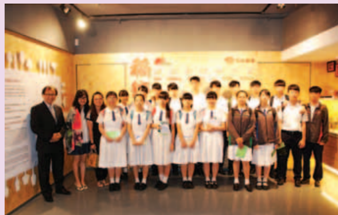
▲ 中五級18名學生與曾校長(左一)、帶隊何老師(左二)及黃老師(左三)參觀稻香集團

本校為了加深同學對香港餐飲業經營運作的認識，旅遊與款待科安排同學參觀稻香集團。透過參觀，有助同學掌握香港飲食業的就業前景。