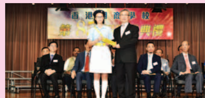
▲ 本校交通安全隊勇奪港島及離島總區周年檢閱禮步操比賽小學組總冠軍，獲冠軍獎盃一座，由校監代表接受。