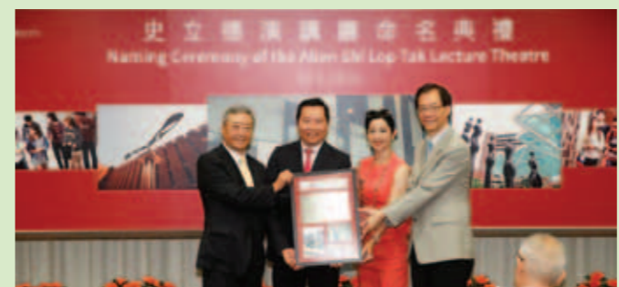
▲ 校董會主席及校長致送紀念品予史立德博士伉儷。

史立德博士1980年畢業於理工大學前身香港理工學院，多年來積極回饋母校。他除了在工商界有出色的成就外，亦熱心服務社會，樂善好施，積極關注青年教育工作，是備受敬重的慈善家。