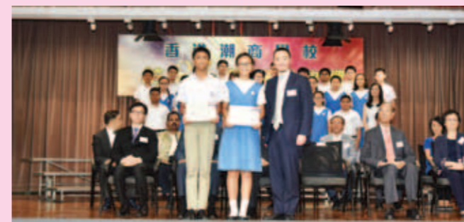
▲ 主禮嘉賓政制及內地事務局副局長陳岳鵬先生JP為畢業生授憑。