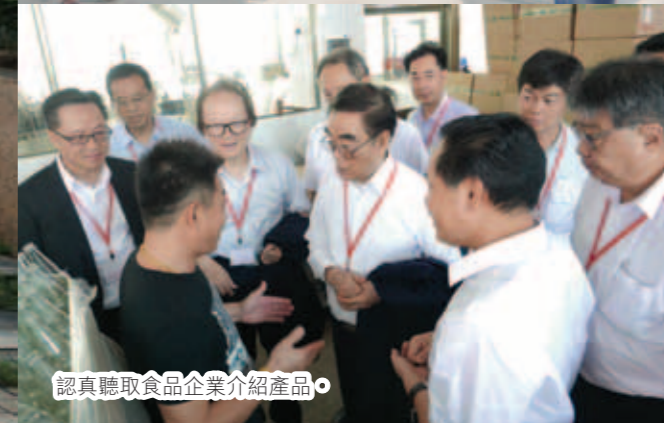
認真聽取食品企業介紹產品。