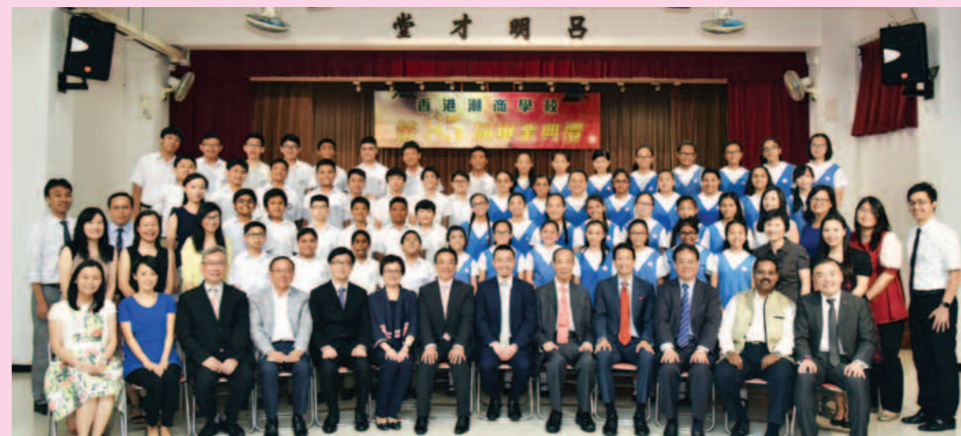
▲ 嘉賓、老師與畢業生大合照