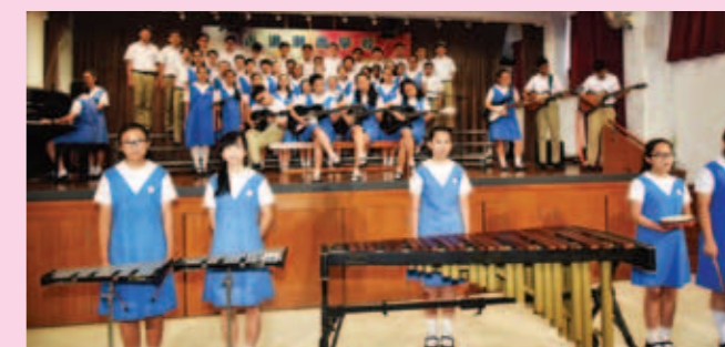
▲ 畢業生為大家獻唱「You raise me up」、「單車」及「Auld Lang Syne」。各畢業生憶起在校點滴，難捨難離、場面感動。