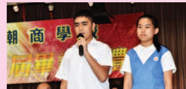
▲ 畢業生代表以粵語和英語致辭。