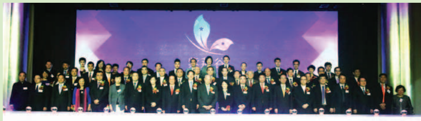
▲ 「紫荊谷創新創業發展輔導中心」啟動儀式合照。

輔導中心根據各學校的學科優勢，分別設置科技創新與發展、互聯網+、中國市場與國際市場、中國與「一帶一路」、中國與國際產能合作、高端現代服務業、生態環保行業、金融創新、文化創意、影視製作、國際貿易與跨境物流供應鏈、跨境電子商務與實體營銷、城市規劃與建築設計包括製造業等相關輔導內容，分行業、分類別根據各所大學的特色分別制定個性化具體輔導方案，並由學校教授、老師對輔導對象進行專業性、綜合性輔導，輔導期間專門組織輔導對象實地參觀考察內地發展創業成功的企業，現場傳授發展創業經驗並作實效性的輔導。