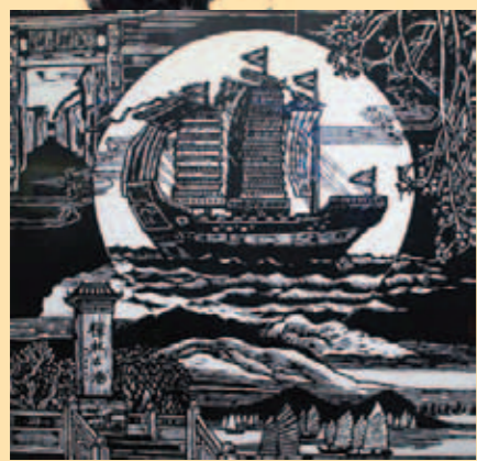
▲ 紅頭船的故鄉(版畫)。