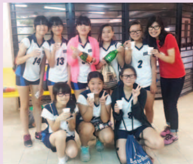
▲ 女子丙組排球隊代表獲勝後難掩興奮心情