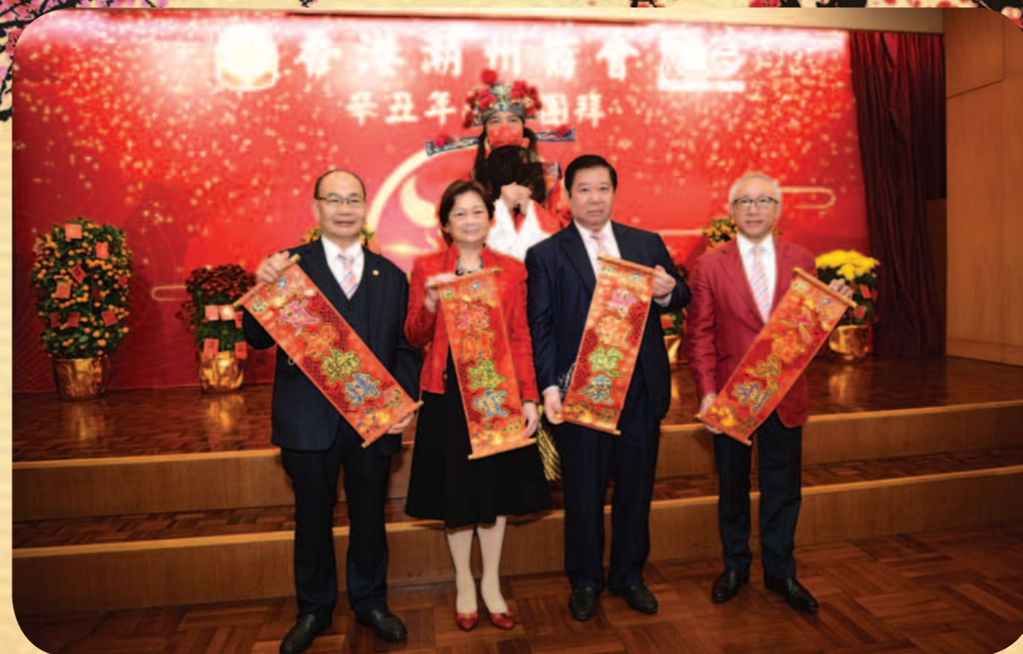
本會首長向全體同仁拜年，祝願各位牛年行大運。