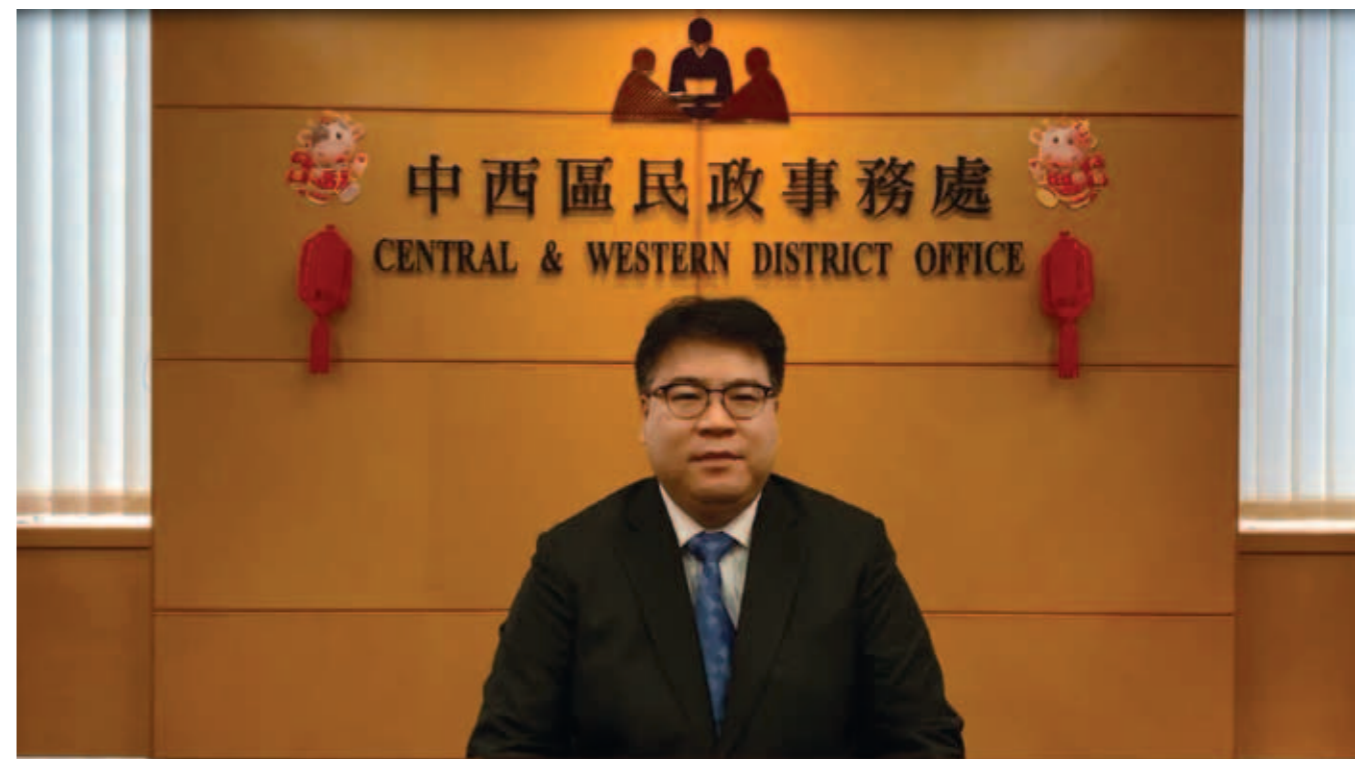
▲ 中西區民政事務處專員梁子琪擔任主禮嘉賓，向各位拜年。