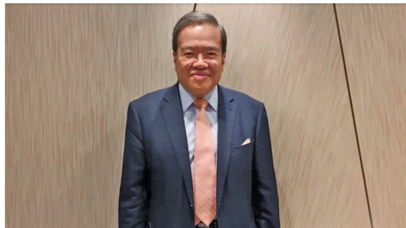
▲ 全國政協常委、榮譽主席胡定旭以潮州話向各位嘉賓拜年。