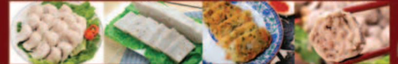
魚肉皮餃 手工扎肉餅 土豆糰 手打牛肉丸