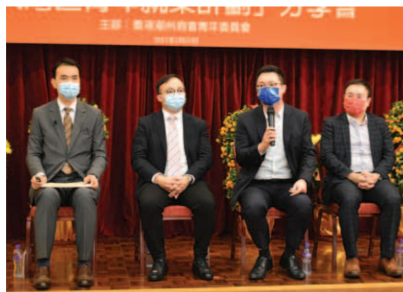
▲ 勞工及福利局副局長何啟明（右二）為本會成員講解就業計劃。

高級勞工事務主任楊子傑於現場詳盡講解「大灣區青年就業計劃」的內容；本會會董、青委副主任陳賢翰先生於線上分享企