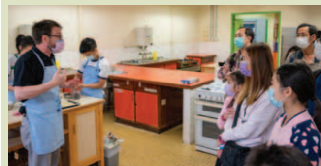
▲ 外籍英文科老師及本校同學於家政室製作曲奇餅，並送上包裝曲奇餅予家長，分享學生的成就。

型STEAM活動及形形色色分享。他們表示活動有趣，並能學習不同學科知識。當天小學家長與同學帶著愉快心情及不同活動的小成果，滿載而歸。