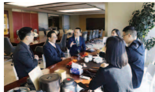
▲ 賓主雙方進行友好會談。

商會將圍繞「感恩、傳承、團結、奉獻」之主題，舉行會慶及一系列的慶祝活動，歡迎陳主席屆時撥冗出席，與潮籍鄉親及嘉賓共敘鄉情友誼。