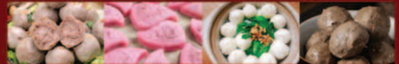
手打牛筋丸 紅糰桃 手工墨魚丸 黑椒牛肉丸