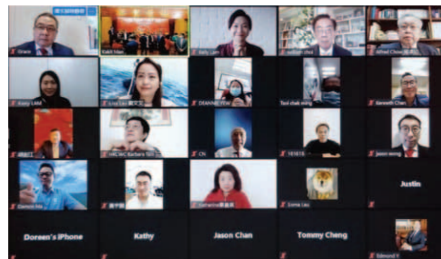
▲ 本會資深會長、常董、會董及會員參加線上新春團拜。