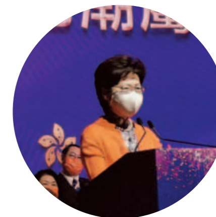
▲ 行政長官林鄭月娥致辭。