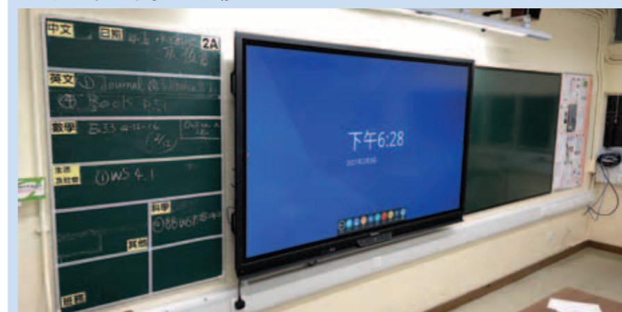
▲ 二樓課室增設電子白板。

為配合「自攜裝置」(BYOD)電子學習計劃，校董會資助學校於2樓6個課室，增添電子白板，老師將運用電子白板配合教學，務求讓課堂變得生動有趣，並提升教學效率。互動白板支援無線投影及觸碰，方便老師投影學生平板電腦上的課業，並能夠增加師生及同學之間的互動，提高學習效能。