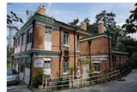
▲ 位於香港半山波老道的「母親的抉擇」辦公室。

面對意外懷孕的少女及其家人。1987年，一小群希望協助意外懷孕少女及其家人面對困境的人成立「母親的抉擇」。今天，「母親的抉擇」繼續透過四項服務，包括意外懷孕支援服務、幼兒之家、領養服務，以及寄養服務，在香港的社會裡影響數以千計的生命。