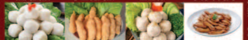
手工馬鮫魚丸 炸蝦尖 黑椒豬肉丸 潮汕鴨舌