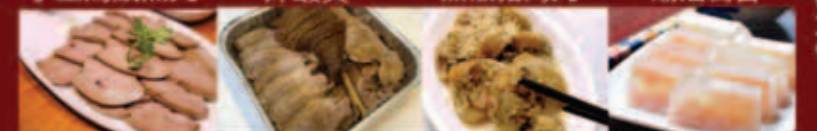
油獅頭鵝肝 油獅頭鵝 豬腳釀糯米 水晶肉皮凍