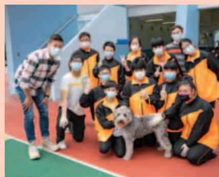
▲ 寵物學會導師與本校師生合照。

本校於去年11月28日舉行寵物學會簡介會及講座。新界南總區防止罪案辦公室「動物守護計劃」代表獲邀到校與同學分享愛護動物、尊重生命的訊息。講座後，同學跟寵物學會導師學習與狗隻相處