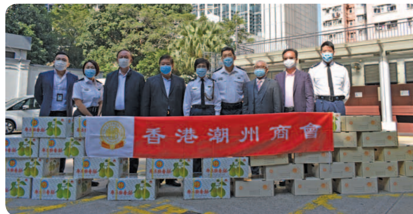
▲ 本會首長新春慰問西區警署警員。