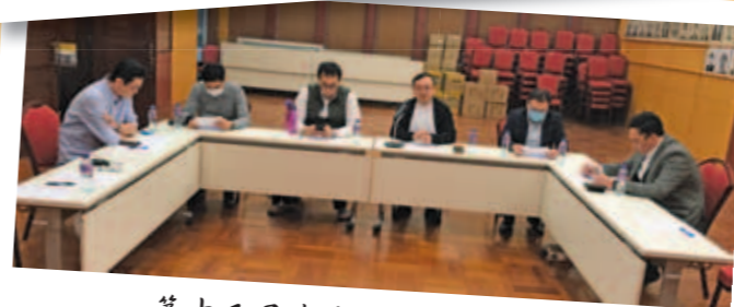
第十五屆青委首次召開集思會