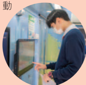
▲ 同學登上流動展覽車，投入參與互動遊戲。