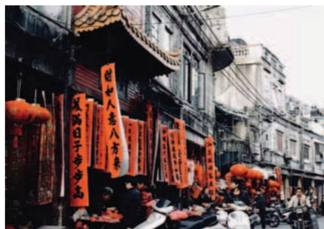
▲ 新春佳節 - 喜氣洋洋。