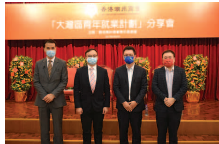
▲ 左起：高級勞工事務主任（就業資訊及推廣科）楊子傑、青委主任柯家洋、勞工及福利局副局長何啟明、青委副主任巫江峰。

青委主任柯家洋致辭時表示，過去一年，新冠疫情持續，香港經濟面臨嚴峻挑戰，失業率持續高