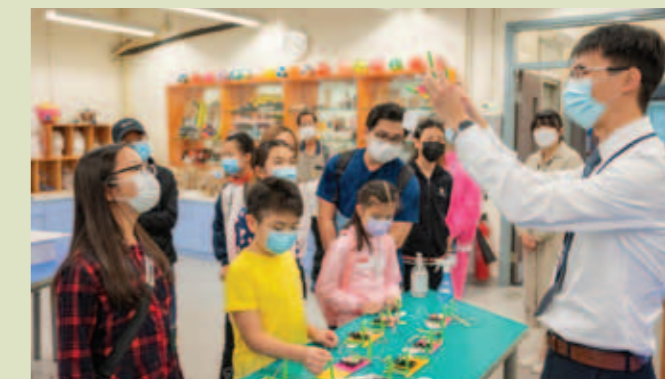
▲ 郭老師向小學家長及同學展示本校同學課業。