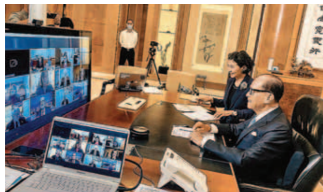
▲ 李嘉誠獎金贈醫學諾獎兩無名英雄。