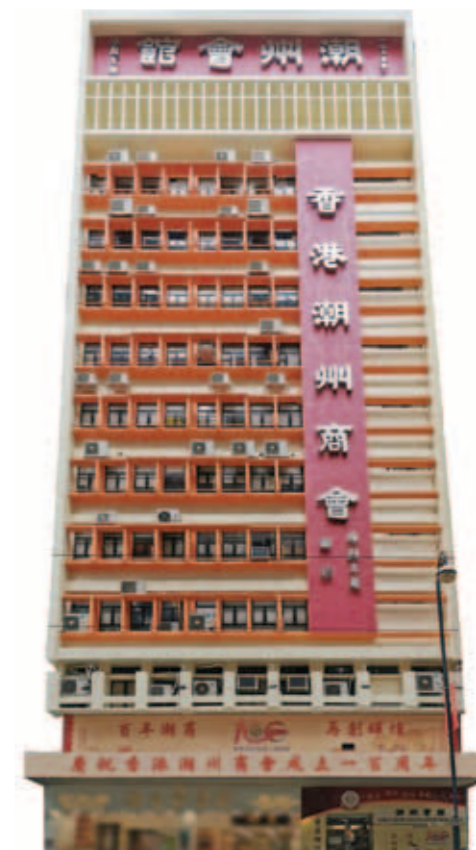
▲ 潮州會館外牆新裝修全景。