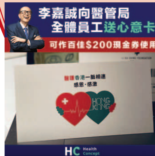
▲ 李嘉誠送出「春天的禮物」。

基金會將向醫管局全體9.7萬名人員派發心意卡。基金會稱，會將心意卡送到各醫院，醫護人員手持心意卡，由2月8日至5月31日，即可在全港百佳店鋪換取及使用$200現金券。