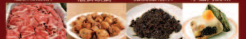
雪花肥牛 馬蹄小裸肉 新鮮撒機菜 土豪粽